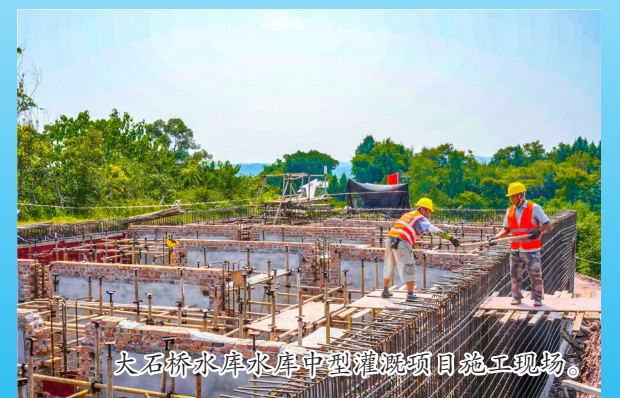
大石桥水库中型灌区项目施工现场。

规划铜车坝中型灌区项目，预计可解决卧佛、小渡3.2万城镇供水以及复兴河沿岸灌区4万亩耕地的用水和1.52万农村人口的饮水问题。