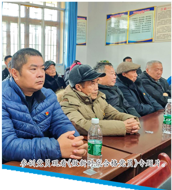
参训党员观看《做新时代合格党员》专题片。