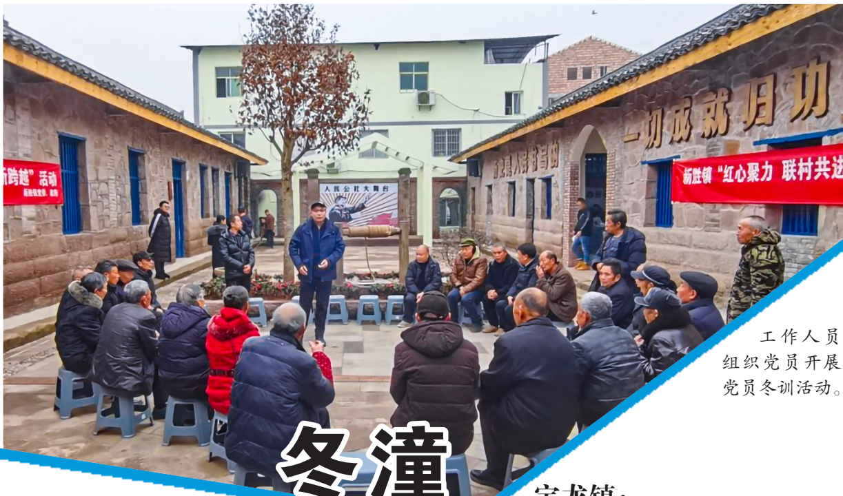
工作人员组织党员开展党员冬训活动。