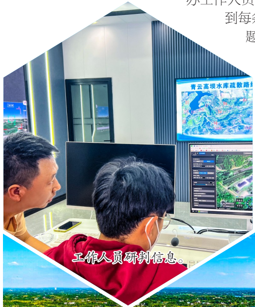
工作人员研判信息。