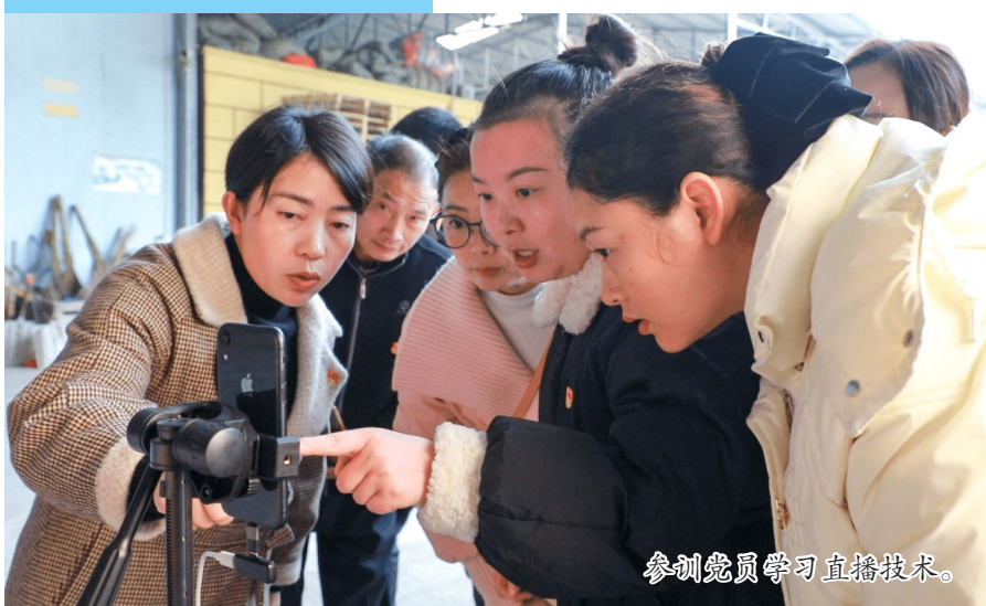
参训党员学习直播技术。

党员冬训是广大基层党员每年的“加油站”，为切实提升党员思想政治素质和服务群众本领，连日来，全区各镇街因地制宜，在不同时段火热开展党员冬训。此次冬训立足各镇街实际，精心规划，通过多样化的学习形式和丰富实用的培训内容，为党员们带来一场场知识与思想的盛宴，推动广大党员在理论武装、党性修养、能力提升等方面实现新突破，以崭新的面貌和昂扬的斗志迎接新挑战，为潼南高质量发展注入强劲“红色动力”。