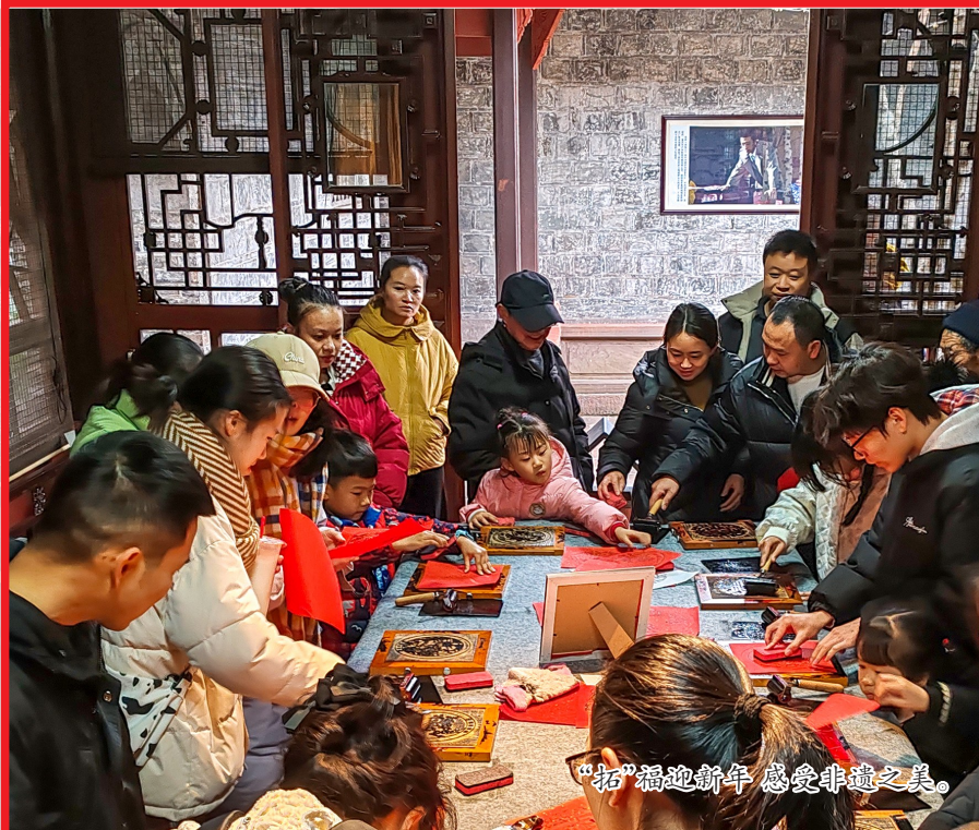
“拓”福迎新年 感受非遗之美。