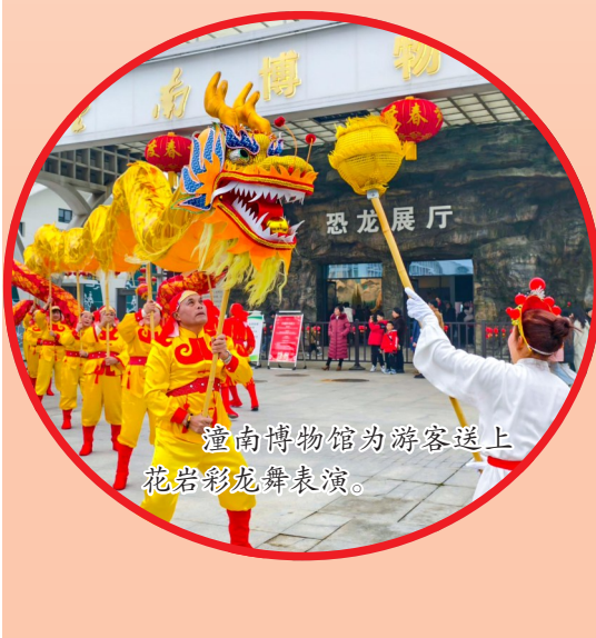
潼南博物馆为游客送上花岩彩龙舞表演。