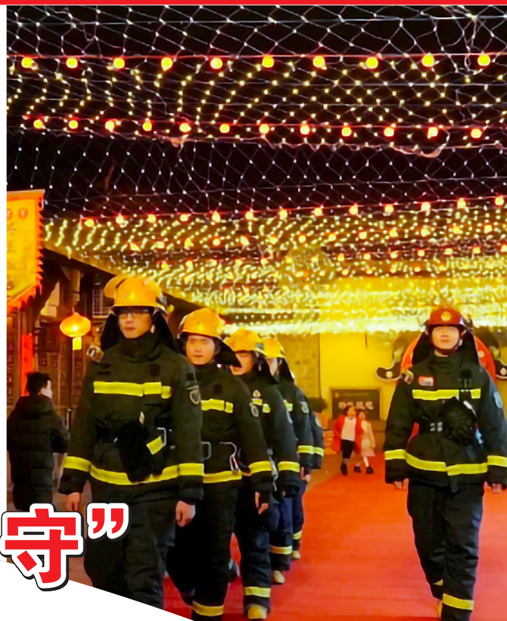
消防员在景区点位巡逻。