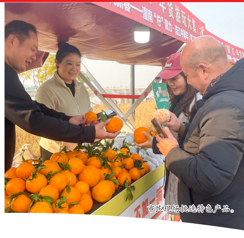
市民现场挑选特色农产品。