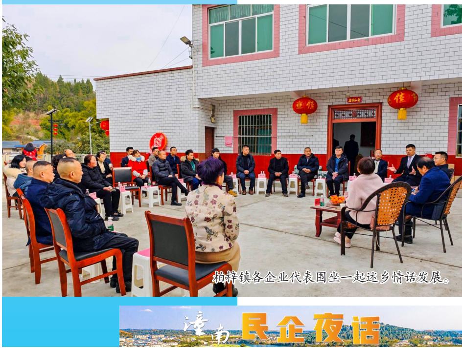
柏梓镇各企业代表围坐一起话发展。

“潼南民企夜话”成功入选第一届重庆市改革创新《以制度机制创新重塑政商交往体系》典型案例、全国工商联“创四优”优秀宣传作品，已成为我区“亲”“清”新型政商关系的一张名片。今年，我区将持续塑强“潼南民企夜话”特色品牌，迭代升级“民企夜话”工作机制，推进“区级+部门+镇街”三级联动，实施“民企面访”“民企夜校”“民企护航”三项行动，完善区级领导牵头出席、职能部门分领域举办、镇街因地制宜开展、网民广泛参与互动的全覆盖服务体系，助推民营经济高质量发展。