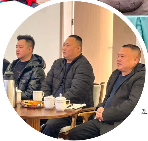
大佛街道企业和社区代表互相倾听，交流意见。