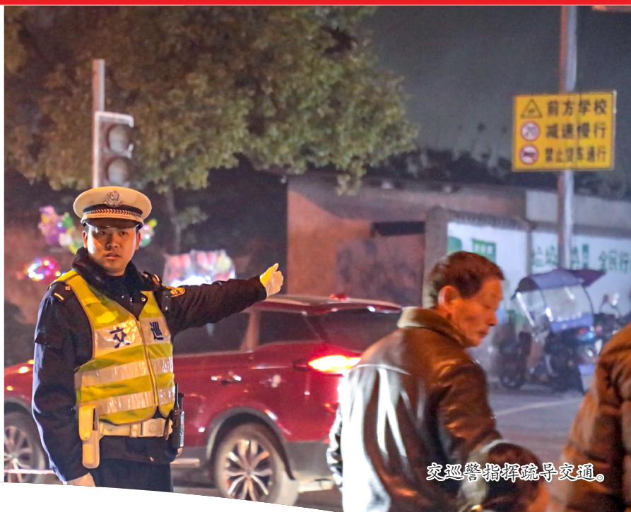
交巡警指挥疏导交通。