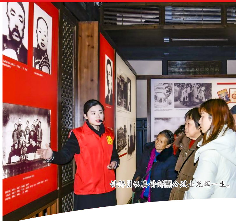
讲解员认真讲解革命烈士光辉一生。