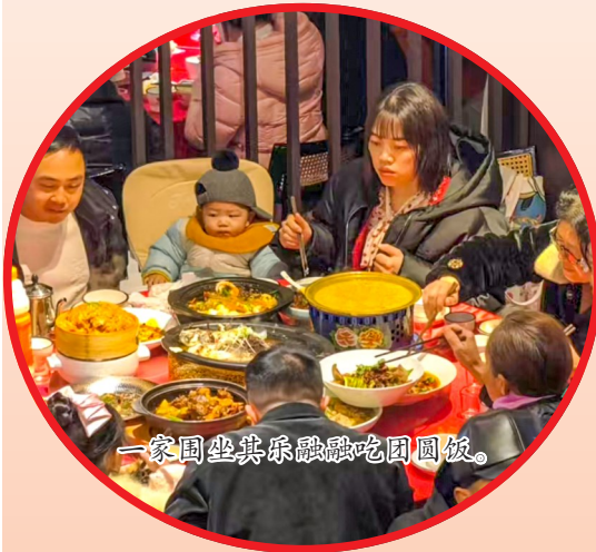
一家人其乐融融吃团圆饭。