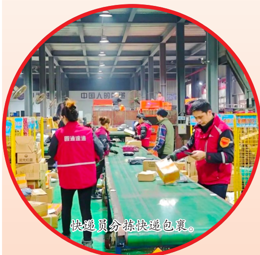
快递员分拣快递包裹。

们身着整齐的服装,在车水马龙中熟练地指挥交通,保障道路畅通无阻。5个重要停车场里,他们有条不紊地引导车辆停放,确保每一辆车都能有序归位。 与此同时,场镇秩序维护组、应急保障组、消防安全保障组、市场监管组等7个工作小组也在各自的岗位上忙碌而专注。他们或是在街头巷尾巡逻,维护场镇的和谐秩序;或是仔细检查消防设施,守护古镇的消防安全;或是深入市场,保障商品质量和价格稳定。