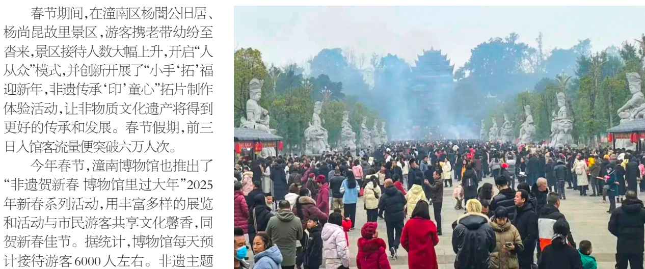
大佛寺景区游人如织。