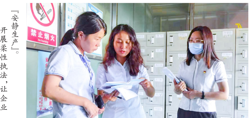
“安静生产”。开展柔性执法，让企业

连日来，记者访部门、入园区、进企业，倾听窗口工作人员、企业负责人对提升政务服务质效的感触与心声，见证潼南厚植营商环境沃土所激发出的澎湃动能。