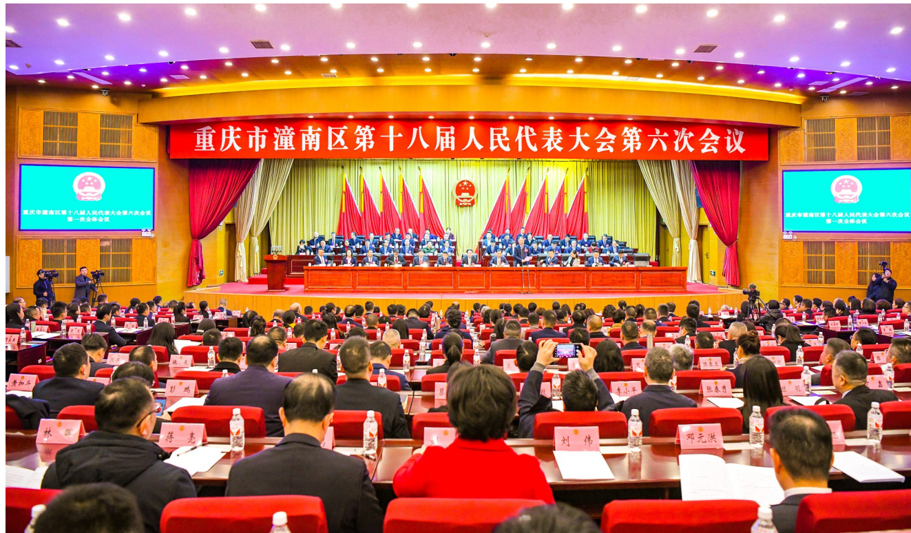
右图：大会现场。

本报讯（两会报道组）1月13日上午，重庆市潼南区第十八届人民代表大会第六次会议在区委党校学术报告厅隆重开幕。