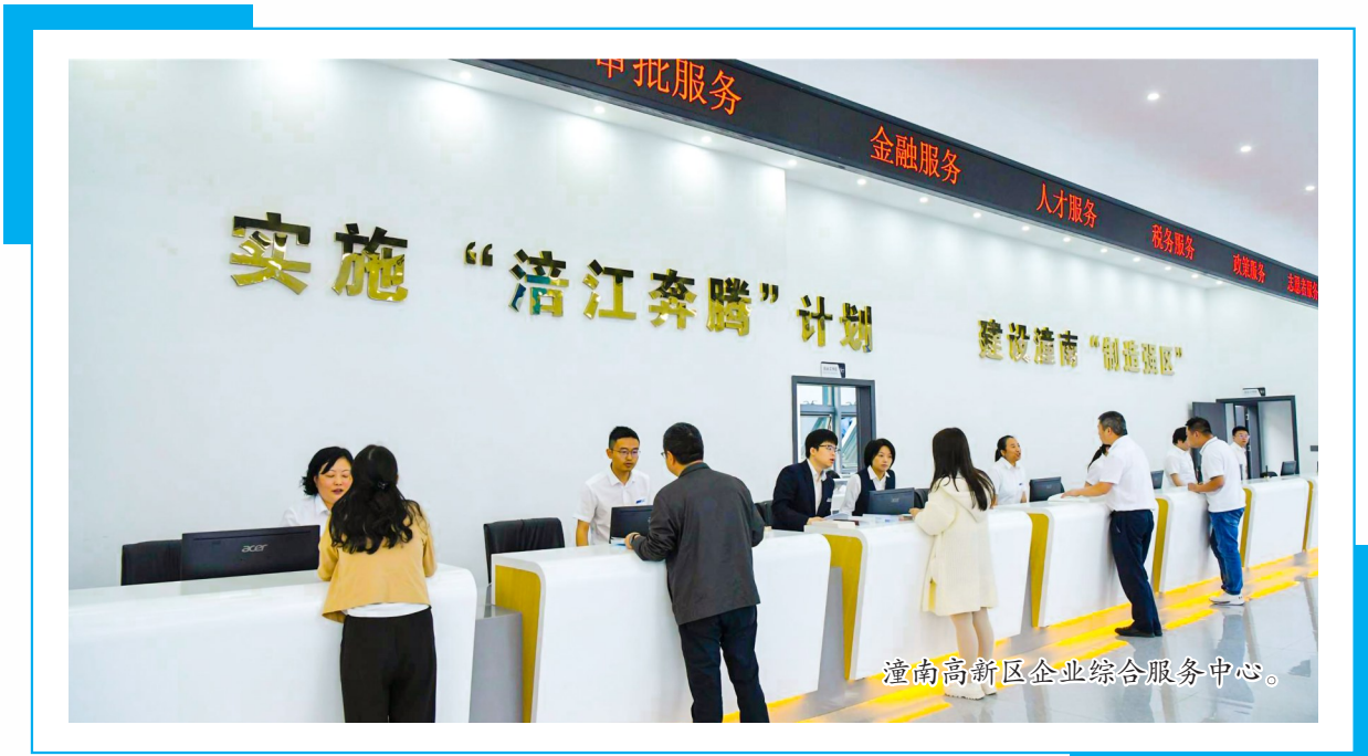
潼南高新区企业综合服务中心。