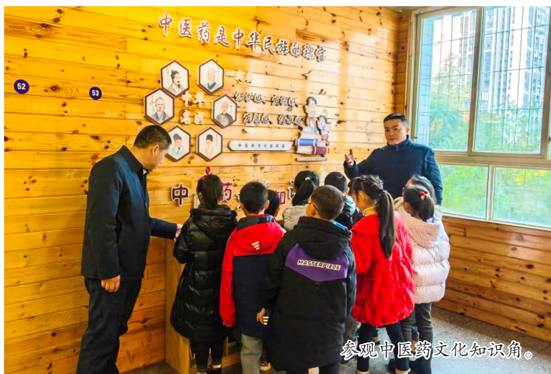
参观中医药文化知识角。