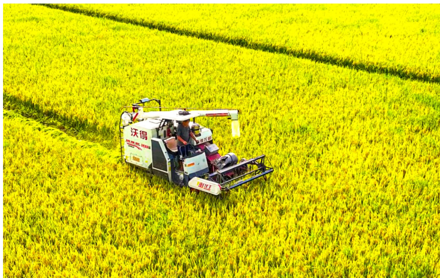
龙形镇万亩水稻实现全程机收。

在推进高标准农田建设的同时，龙形镇还严控耕地保护和生态保护，夯实农业生产基础。全面落实耕地保护和粮食安全党政同责，坚决遏制耕地“非农化”、防止耕地“非粮化”，确保粮食生产底线不动摇。通过严格落实耕地占补平衡、进出平衡，龙形镇守住了粮食生产底线，也为未来产业发展奠定坚实基础。