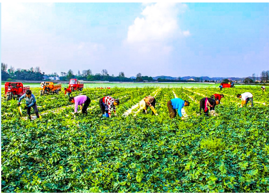
村民在联村集体经济核心产业区采收蔬菜。

发展壮大集体经济，带动群众就业增收，人居环境持续改善，治理效能全面提升……自大佛街道打破传统行政村壁垒，创新设立大佛坝联村党委以来，党建联建整合资源力量的步伐稳步向前，一个宜居宜业和美的现代化新农村雏形正在显现，群众幸福感更加可感可及。