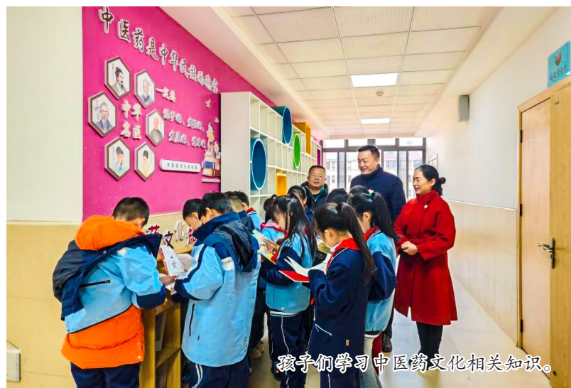
孩子们学习中医药文化相关知识。

本报讯（记者 吕洁）近日，由区卫生健康委打造的4个校园中医药文化知识角完成建设，吸引众多学生驻足学习。