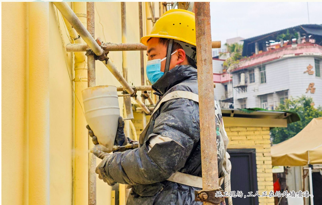
施工现场，工人正在给外墙喷漆。