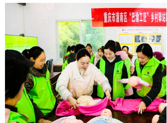
培训老师通过教具“手把手”示范。

本报讯（记者 邓瑜欣 唐霞涵）近日，米心镇苦竹村集体经济合作社“巴渝工匠”乡村驿站举办2024年就业技能育婴员培训班，进一步提高农村劳动力职业技能水平，促进农民增收。