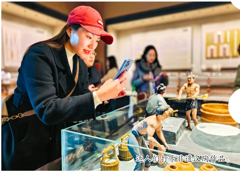
达人们打卡非遗汉陶作品。