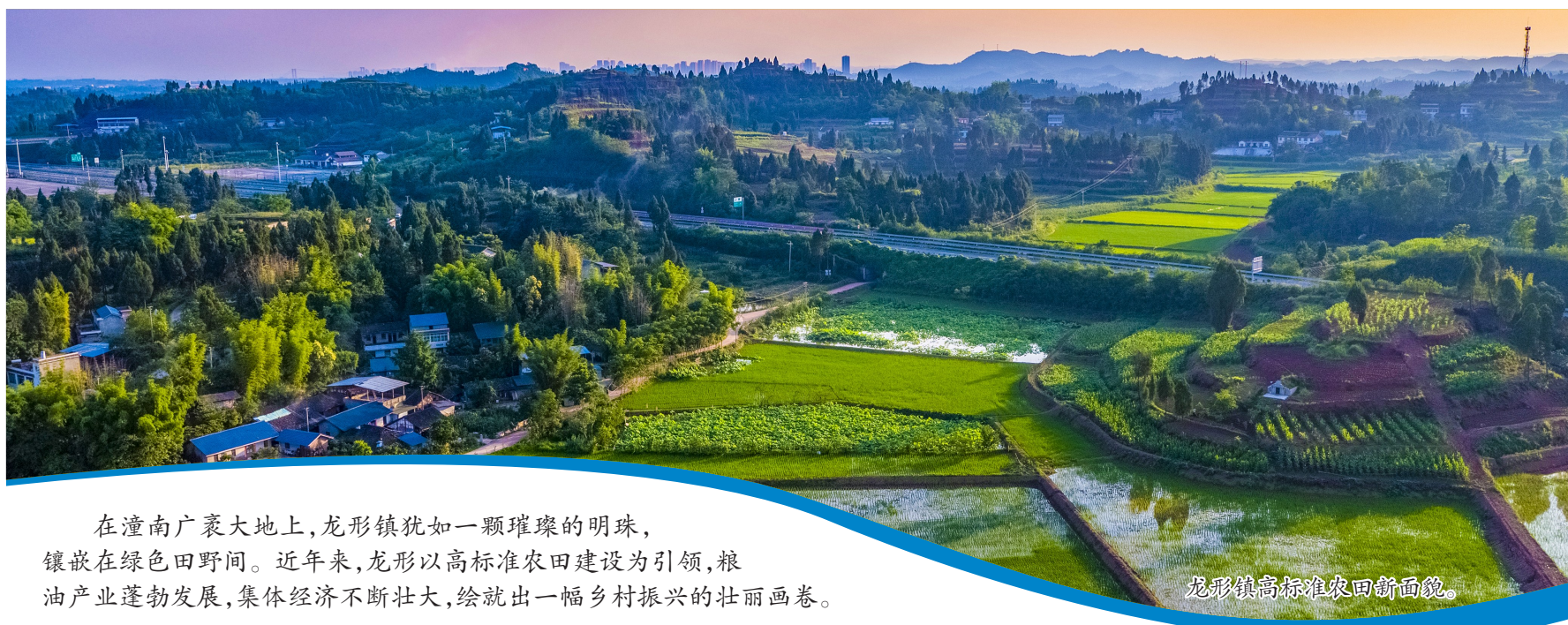
在潼南广袤大地上，龙形镇犹如一颗璀璨的明珠，镶嵌在绿色田野间。近年来，龙形镇以高标准农田建设为引领，粮油产业蓬勃发展，集体经济不断壮大，绘就出一幅乡村振兴的壮丽画卷。