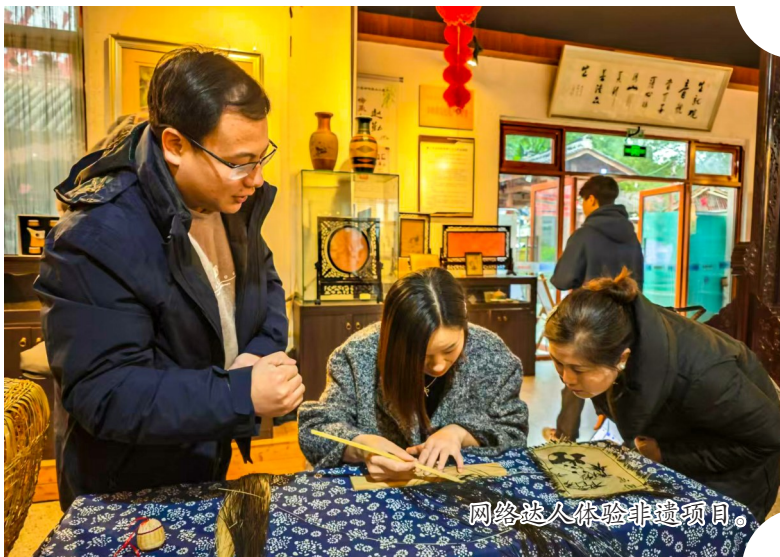
网络达人体验非遗项目。

遂潼两地网信相关负责人纷纷表示,将以此次活动为契机,携手并肩,相向而行,持续加深在非遗文化传承方面的合作,更好地保护非遗文化,为遂潼川渝毗邻地区一体化发展、成渝地区双城经济圈建设贡献更多更有力的网信力量。