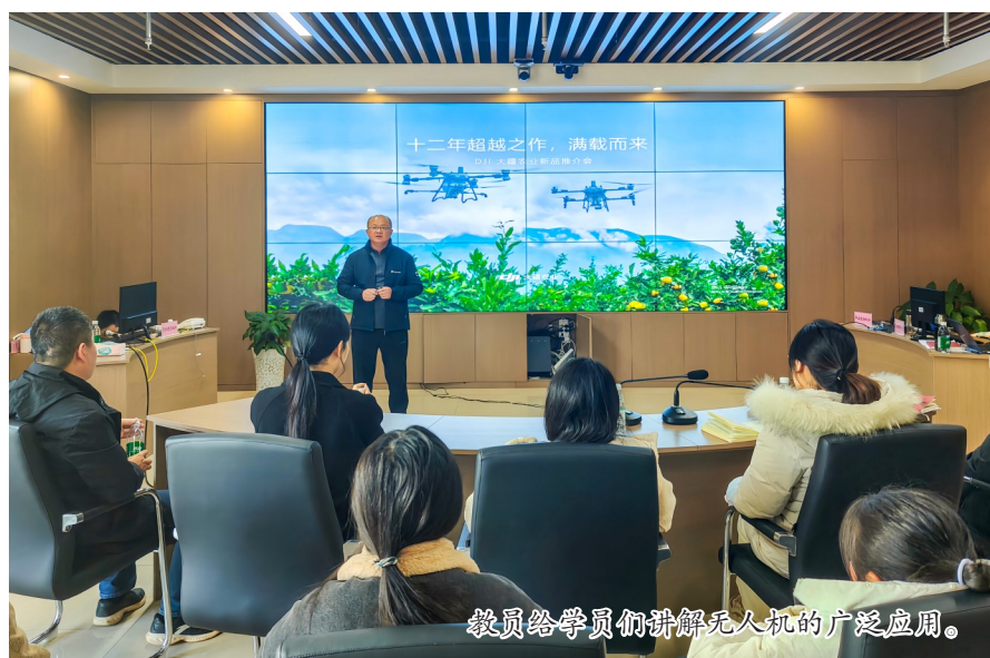
教员给学员们讲解无人机的广泛应用。

本报讯(记者 李彦亭)近日,双江镇“青竹荟”脱机课堂再次吹响集结号,为镇青年干部、部分村(社区)干部共30余人带来一场别开生面的无人机基础知识与操作技能培训。