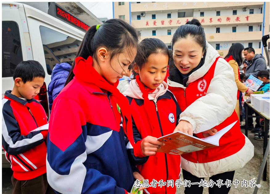
志愿者和同学们一起分享书中内容。

本报讯（记者 陈俊霖）岁寒知雅意，书香暖童心。近日，市少年儿童图书馆2024年亲子阅读进基层活动潼南专场在塘坝镇永康小学举行。