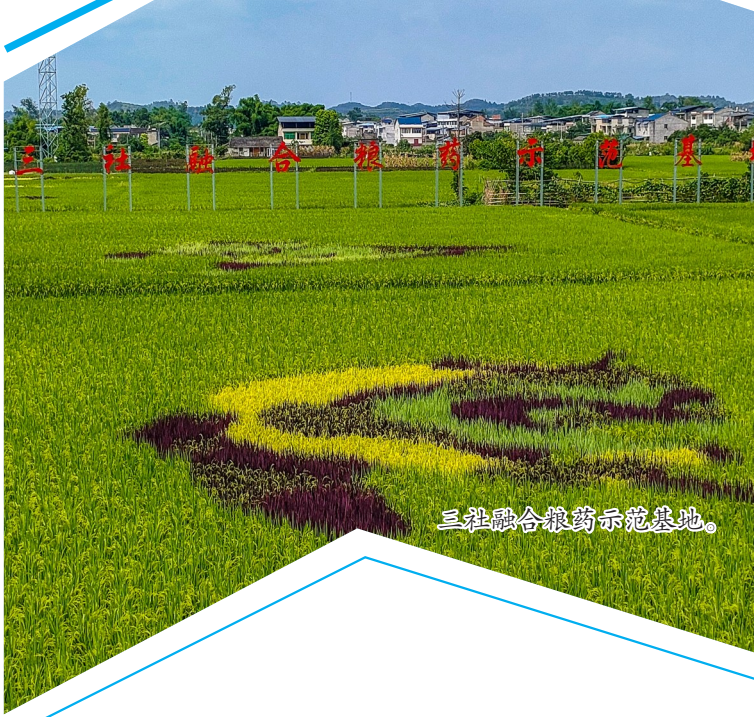
三社融合服务示范基地。