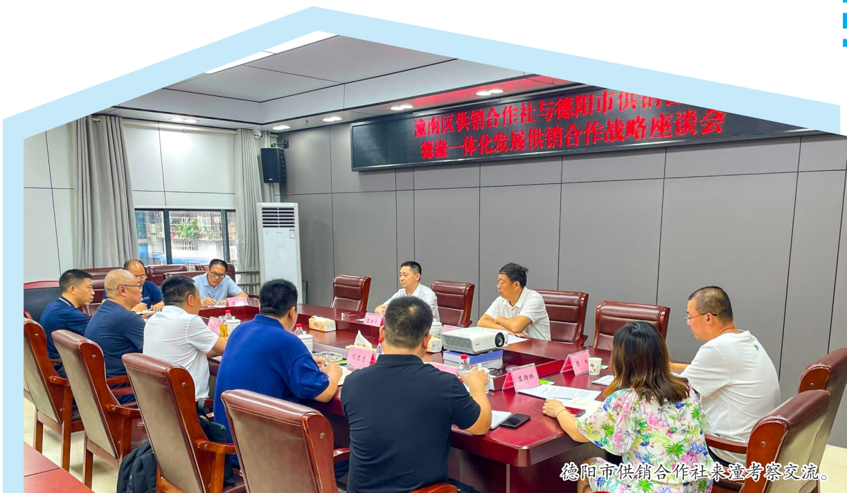
德阳市供销社来潼考察交流。

近年来,我区供销社坚持从“三农”工作大局出发,以全面提升全系统农业社会化服务水平为突破口,持续深化综合改革,围绕服务乡村振兴大局,通过支持基层供销社开展农业社会化服务,推进适度规模经营和绿色高效农业生产,增强服务带动小农户能力,破解“谁来种地”“地怎么种”的问题,切实在服务乡村振兴大局中发挥重要作用。下一步,区供销社将进一步创新服务模式,拓展服务领域,整合服务资源,增强服务能力,为推进乡村加速振兴贡献力量。