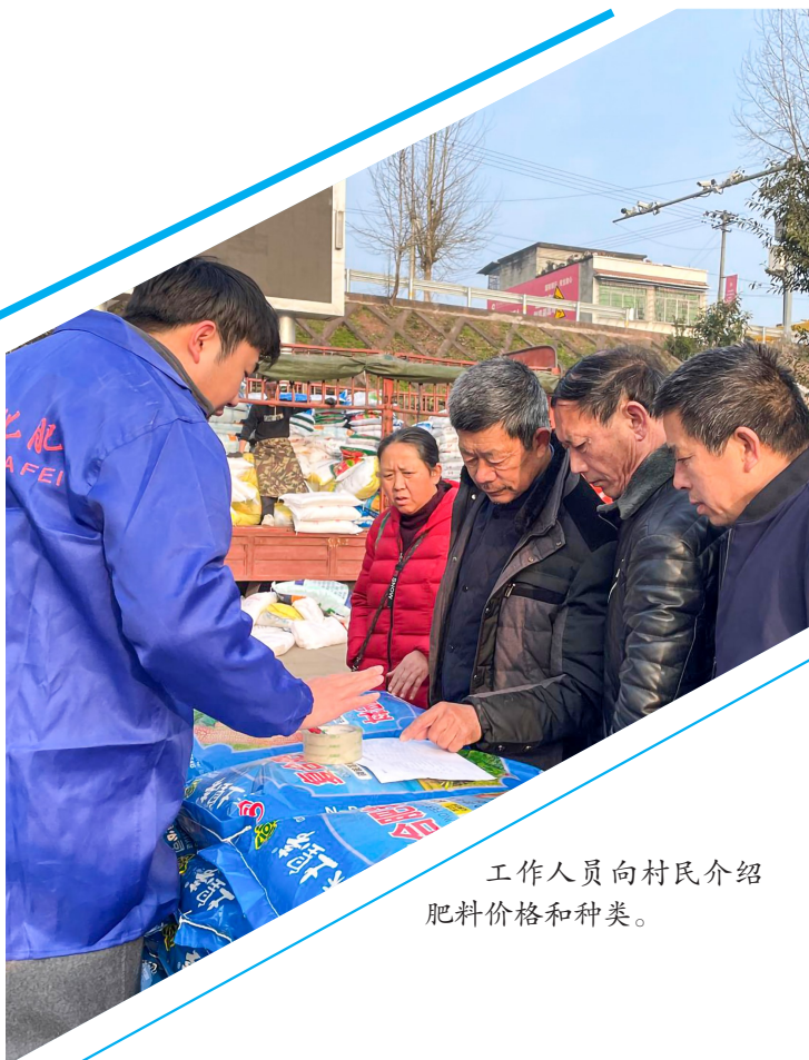
工作人员向村民介绍肥料价格和种类。