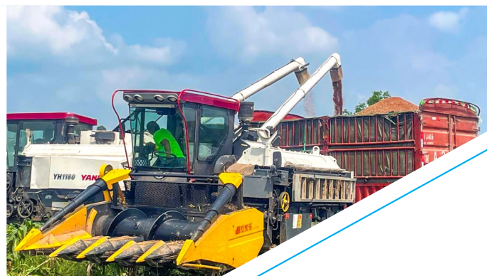
区供销社合作社在高粱收割期间开展农机服务。