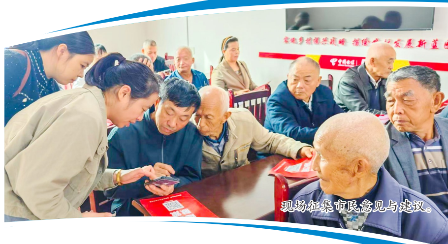
现场征集市民意见与建议。