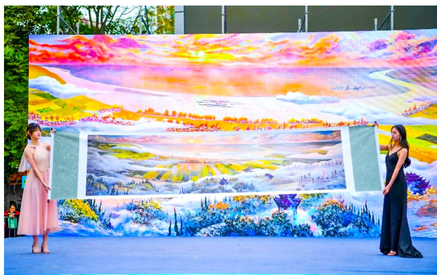
大型油画《世界宽谷·田园城市》展示。

活动在激情四溢的舞蹈《阳光路上》中拉开序幕,演员们身着绚丽的服装,用整齐的舞步和欢快的节奏,瞬间点燃了现场观众的热情。紧接着,鼓舞《威风狮鼓》、狮舞翻腾,鼓声震天,展现了大佛街道深厚的非物质文化遗产底蕴,情景朗诵《涪江奔腾 大佛新曲》尤为引人注目,通过朗诵与VCR的结合,分章节展现了大佛街道的悠久历史、人文高地、革命摇篮等元素,让观众仿佛穿越时空,直观地领略到大佛街道的飞速发展和崭新面貌。“这个节目让我更加了解了大佛街道的历史和