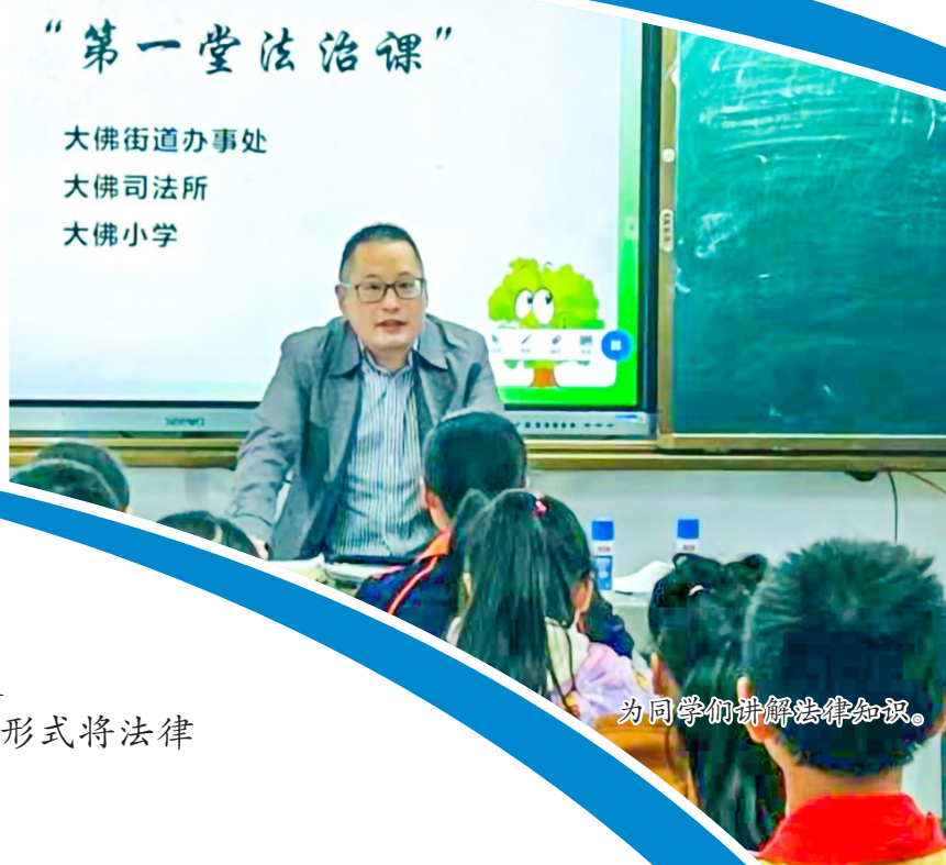
为同学们讲解法律知识。

立冬好时节，普法正当时。为了更加丰富广大市民法治生活，提升公民法治素养，增强群众尊法、学法、守法、用法的意识，区司法局组织开展普法宣传活动，面对面、零距离、全覆盖，以丰富多样的形式将法律知识送到群众身边。