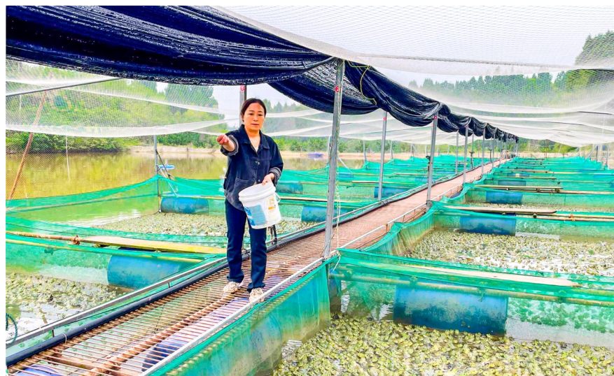
基地工人投喂鱼和牛蛙。

本报讯（记者 刘城志 张峻豪）近年来，玉溪镇充分利用当地自然资源和水产养殖优势，探索绿色生态的“鱼蛙”共生养殖新模式，助推乡村振兴，带动养殖户增收致富。