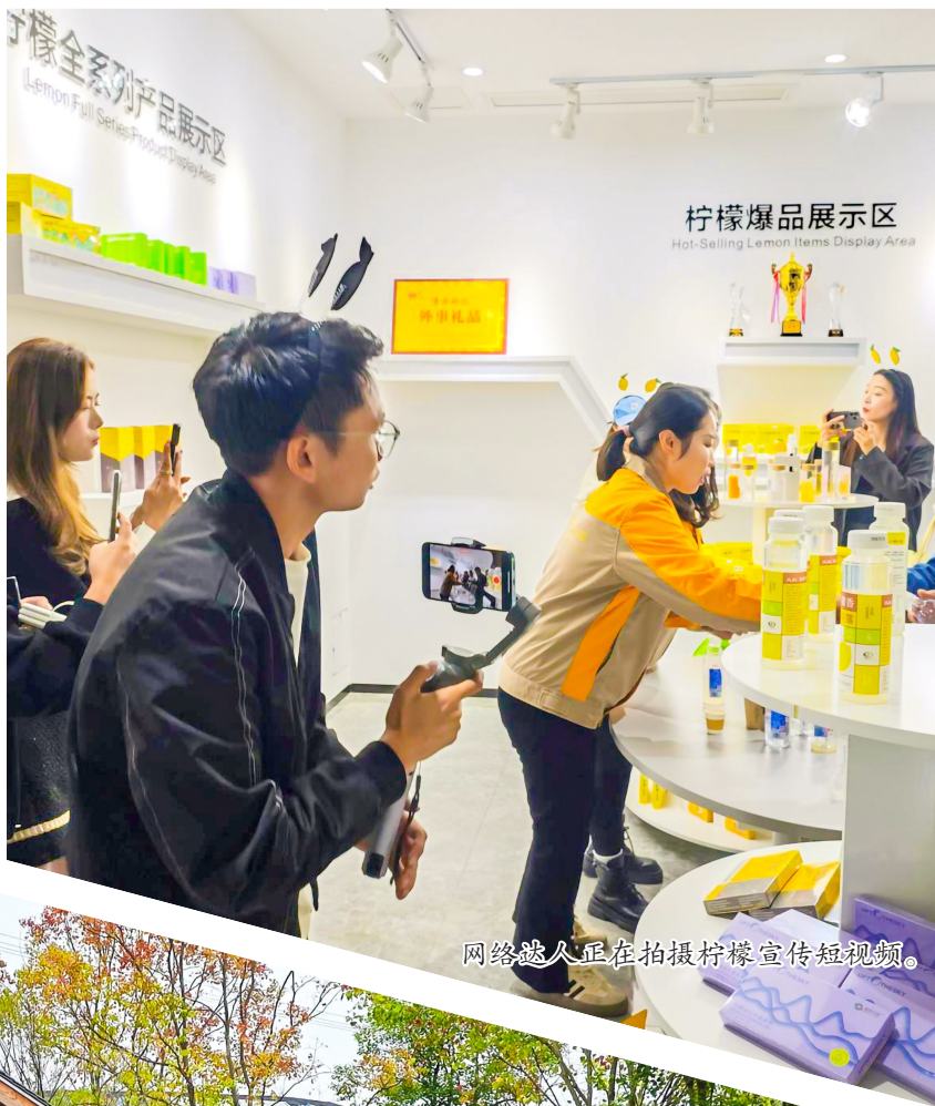
网络达人正在拍摄柠檬宣传短视频。