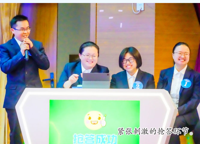
紧张刺激的抢答环节。