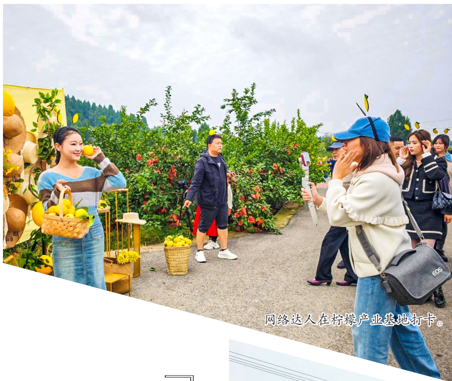
网络达人在柠檬产业基地打卡。