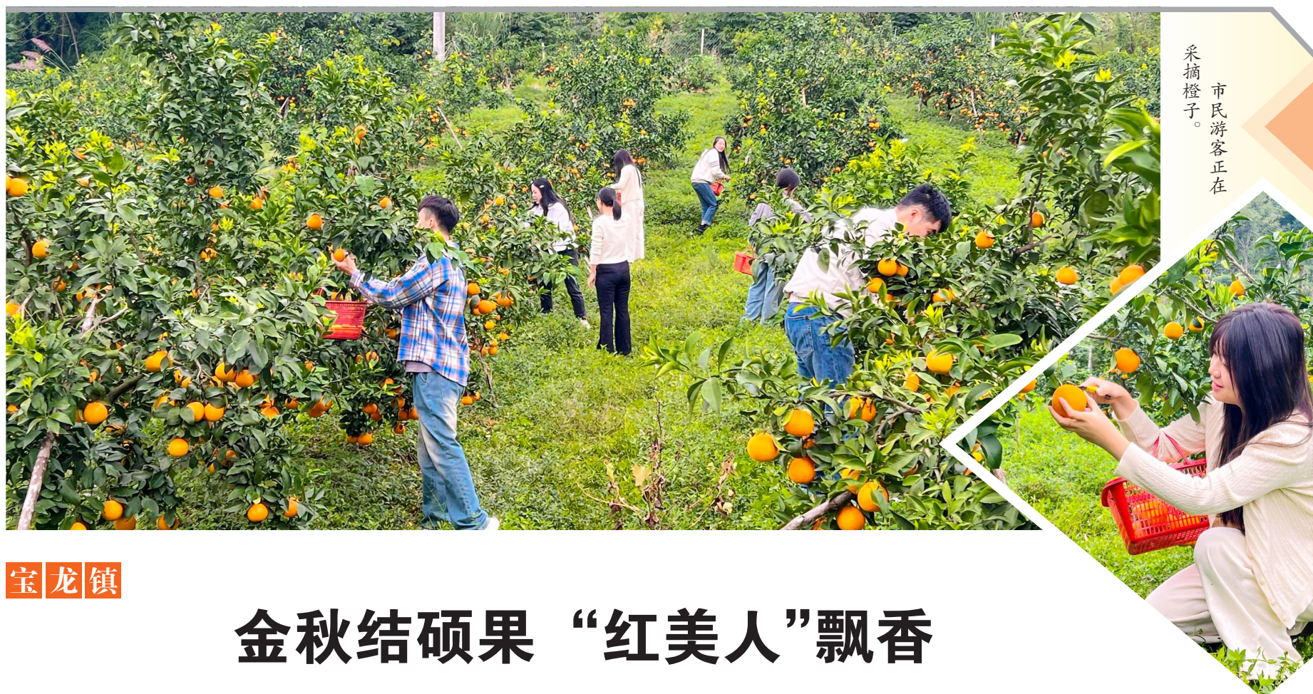
市民游客正在采摘橙子。

参训学员纷纷表示,此次培训的内容实用、指导性强,不仅学到了新知识、新技术,更重要的是开阔了视野,增强了发展农业产业的信心和决心。卧佛镇将以此次培训班为契机,常态化开展各类农业培训活动,为实现农业强、农村美、农民富的美好愿景添砖加瓦。