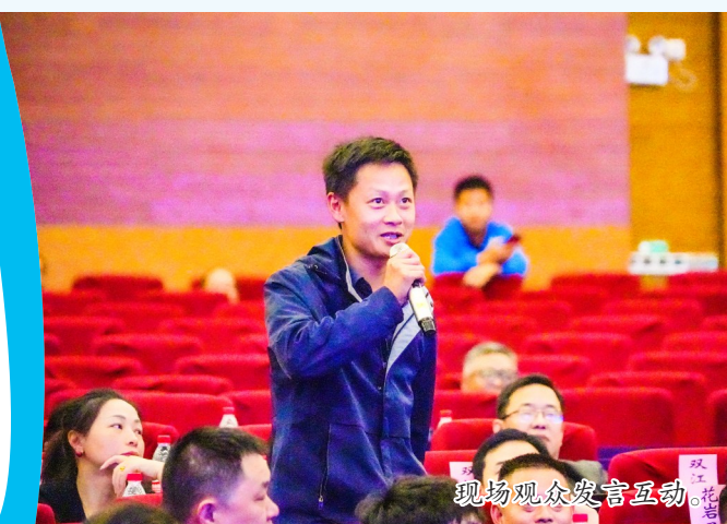
现场观众发言互动。