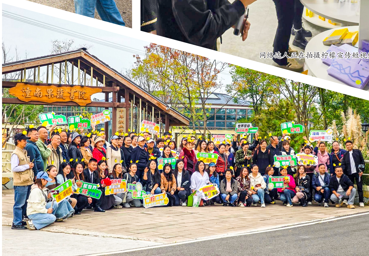
网络达人在果蔬书院打卡。