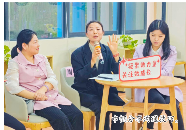
巾帼分享沟通技巧。

潼南乡村振兴巾帼联盟是一支以乡村振兴为己任,由返乡创业就业妇女组成的队伍,是推进我区乡村振兴的重要力量,她们坚持问题导向,聚焦乡村妇女发展面临的难点和痛点,通过整合资源、搭建平台、创新机制,激发乡村妇女的内生动力,提升她们的综合素质,为乡村振兴贡献着巾帼力量。