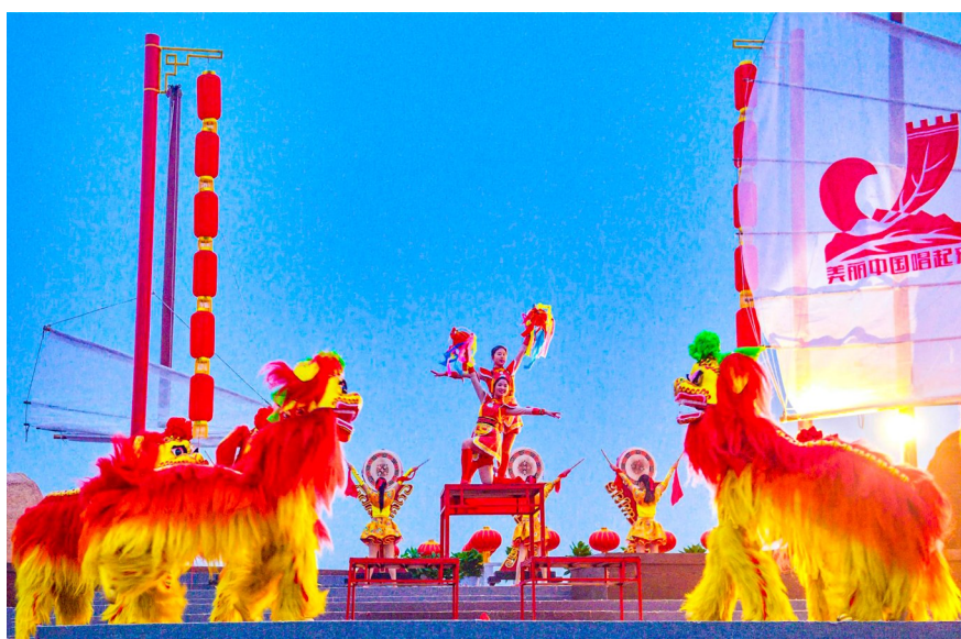
花岗岩女子狮舞表演。

“花岗岩女子狮舞”从地域上分主要属北狮，从种类上看，属于文狮，传承人全部为女性，传女不传男。表演中主要角色有两种，笑罗汉逗狮子、二人舞狮，共需三人扮演，其在模仿狮子动作的基础上融入了女子日常生活中的梳头、洗脸、打扫卫生等动作，给粗犷雄浑的狮舞平添细腻和妩媚，凸显女性不甘示弱，争取男女平等的精神。