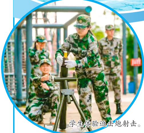
学生体验迫击炮射击。

下一步,区残联将加强遂潼联动,汇聚多方力量,针对特殊教育学生组织开展更多形式的教育活动,丰富学生的学习体验,多层次促进学生全面发展。