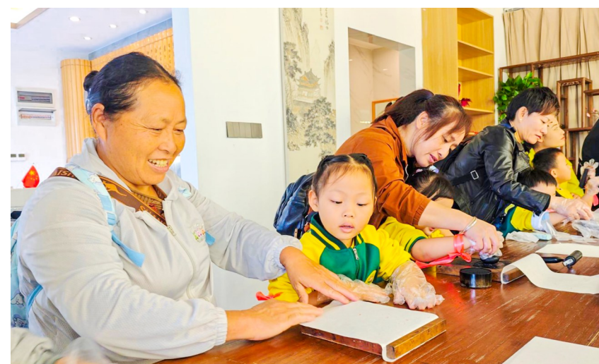
孩子和家长一起体验活字印刷。

据了解,果蔬书院是“潼南太安十二院”首院,也是区农投集团打造的首个“以文促旅、以旅兴农,农文旅互惠共赢”的乡村振兴模式示范性书院。书院以农科城果蔬产业为基底,以农耕文化为载体,果蔬书院融合劳动技能、田园诗歌、汉字文化、餐饮文化、民俗礼仪