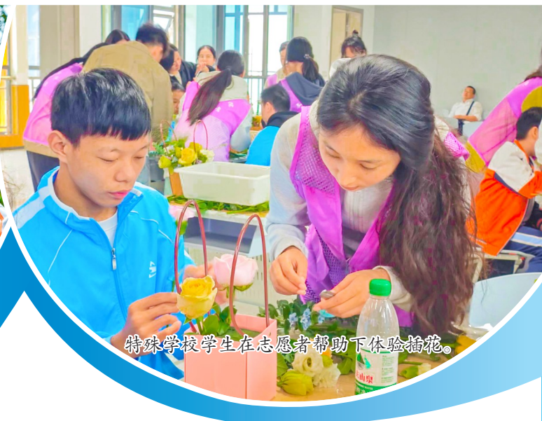
特殊教育学校学生在志愿者帮助下体验插花。