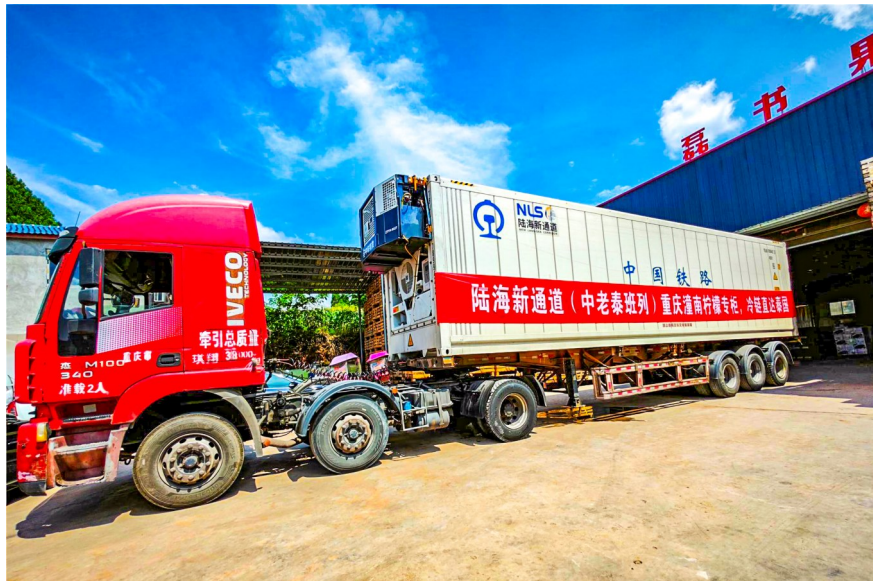
磊书果品装运出口的柠檬。

地处神奇的北纬30度线，重庆潼南区通过种植柠檬，跻身世界三大优质柠檬产地，全区种植面积32万亩、年产柠檬鲜果35万吨，综合产值达75亿元。产业规模有了，接下来要守成还是求变？潼南选择了后者，在气候的“天时”、产业的“地利”、贸易的“人和”上找到最大公约数，开启柠檬的新一轮创业，新的打法是科技化、品牌化和国际化，三者互为倚靠，形成潼南柠檬高质量发展的新动能。日前，华龙网记者深入潼南采访，为你全面解析“小柠檬大作为”的背后故事。