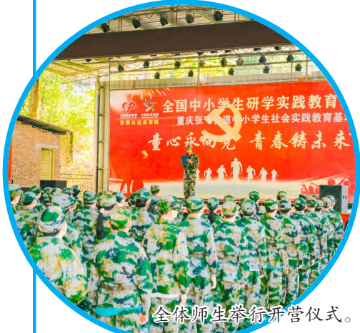
全体师生举行开营仪式。