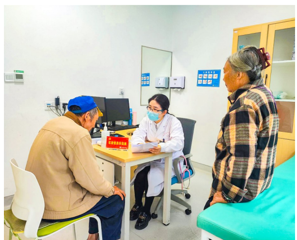
医生为感冒患者就诊。