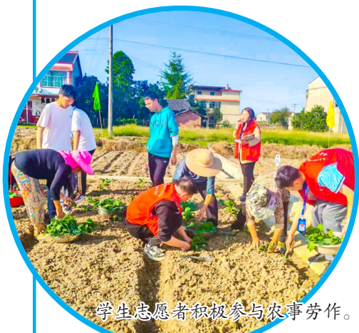
学生志愿者积极参与农事劳作。