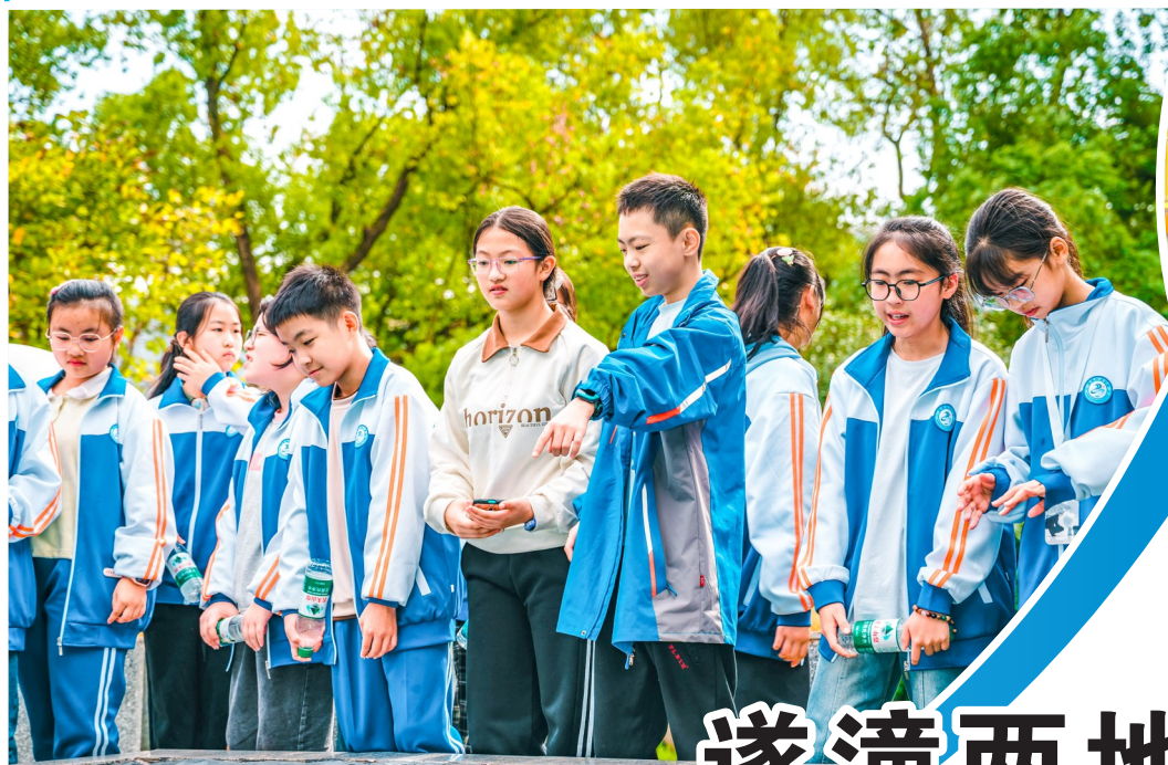
学生们参观西南大学。