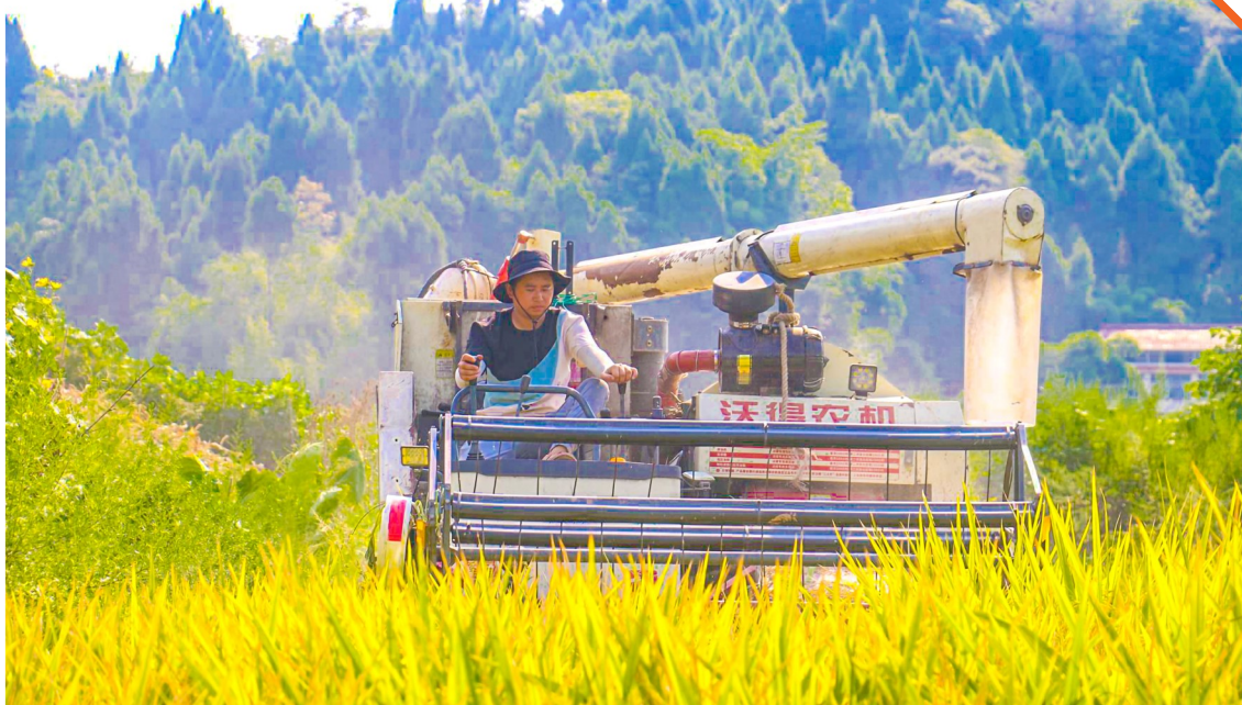
农机手驾驶收割机马力全开地进行水稻收割作业。

接下来,双江镇将继续做好粮食生产安全保障,持续发力扶持和培育种粮大户、土地合作社等新型经营主体,推广适宜本地的农机农艺融合技术,不断提高农业机械化水平和社会化服务水平,进一步健全高标准农田建后管护机制,筑牢保障粮食根基。