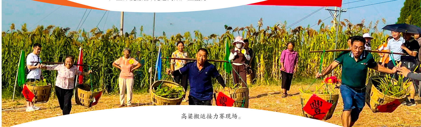
高粱搬运接力赛现场。

近年来,玉溪镇深入贯彻落实党的二十大精神,紧扣发展实际,坚持把确保粮食和重要农产品供给作为实施乡村振兴战略的首要任务,创新“企业+专业合作社+农户”的模式,专业化、规模化种植“红缨子”高粱1000余亩,预计产量175吨,实现收入100余万元,切实做到了“高粱种植+白酒酿造+乡村旅游”三产融合发展,逐步实现从“高粱红”到“产业红”再到“农旅融合”的跨越升级。