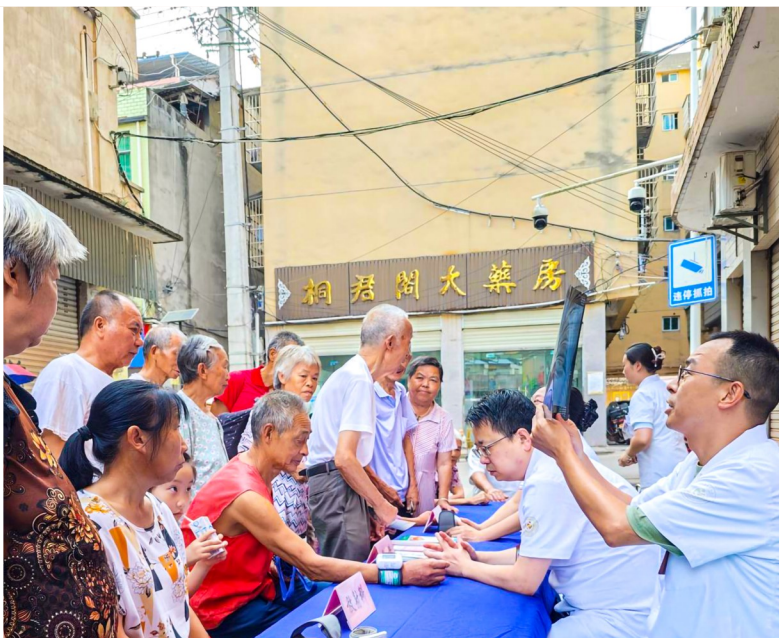
“师徒”走进基层开展义诊。