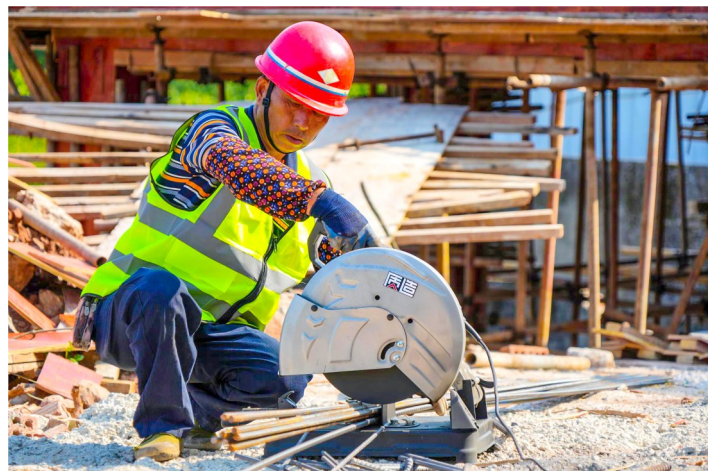
▲ 大石桥水库中型灌溉项目施工现场。 ▶ 青岩子灌区续建配套与节水改造项目施工现场。