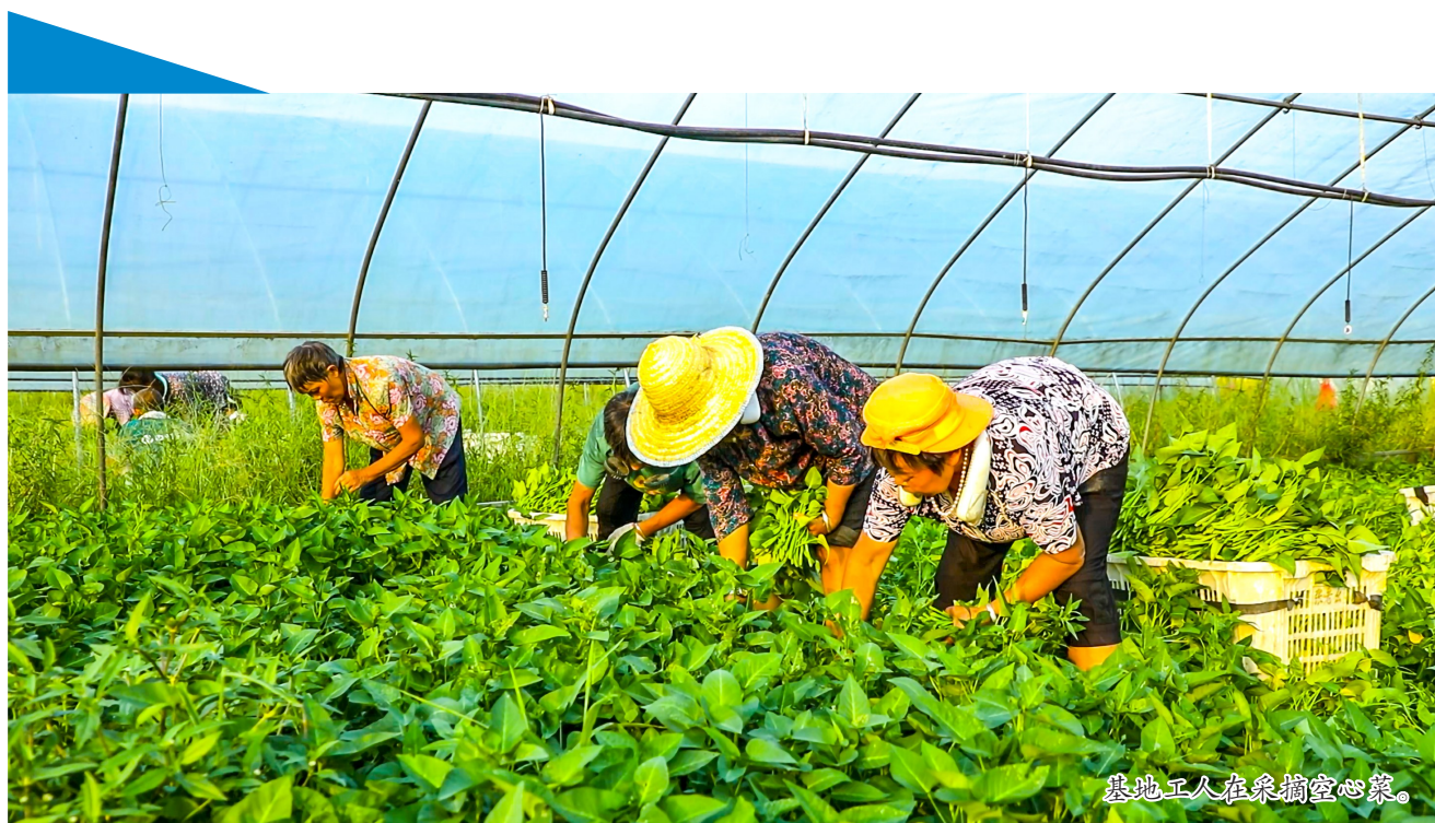
基地工人在采摘空心菜。

本报讯（全媒体记者 吴鑫袁 王浪）立秋过后，受高温天气和外省洪灾等影响，重庆蔬菜价格上涨。我区作为全市“菜篮子”，农业部门提前谋划、统筹安排，多措并举落实蔬菜保供工作。