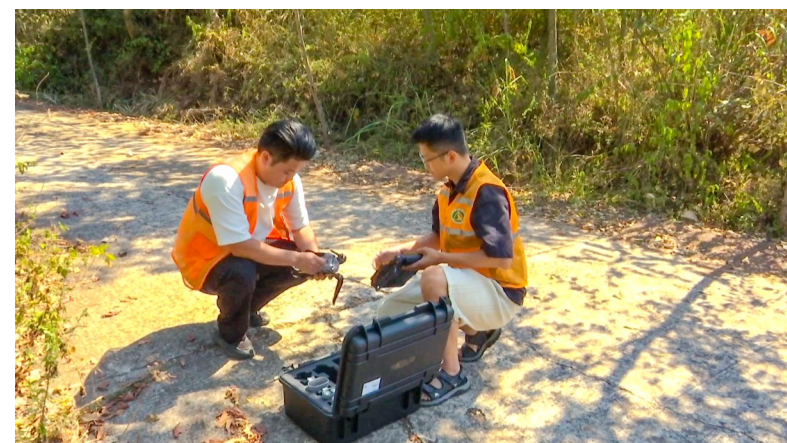
工作人员准备无人机巡护。

据了解，目前五桂山楠木生态公园、马鞍山森林公园、九龙山生态公园等区域集中连片林区全部实行了封山。封山以来，当地安排工作人员对重点区域进行二十四小时值守巡护，派驻9个包片蹲点组，开展督查检查，林区周边镇街在通往封山区域所有路口设立卡点，落实专人值守和检查，严格查验进入林区的人员及车辆，严禁无关人员进入封山区域，加强林区内原住民森林防火宣传，杜绝森林火灾发生，全力保障森林资源和人民群众生命财产安全。