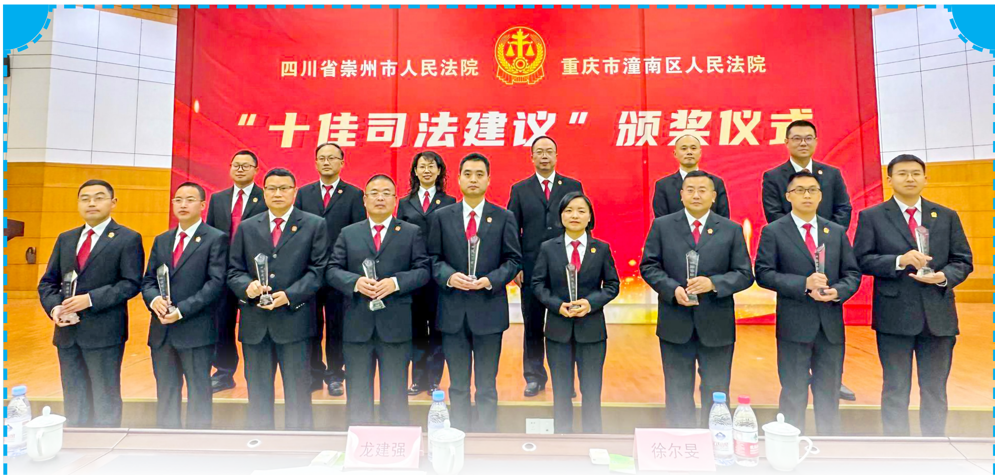
潼南法院与崇州法院联合发布“十佳司法建议”。