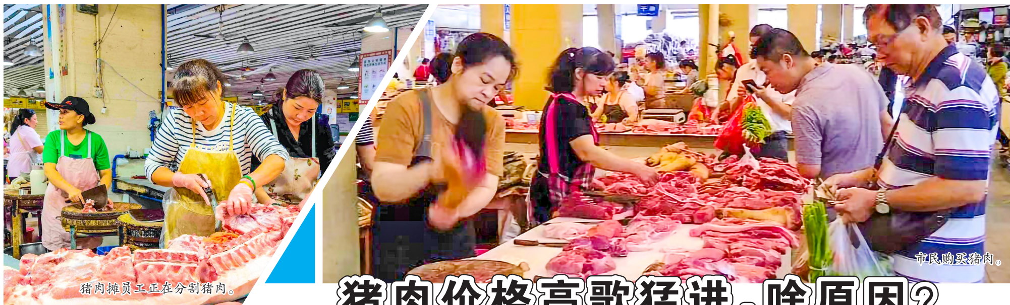
猪肉摊员工正在分割猪肉。

韦纯友强调,要加强“十户联防”和森林防火宣传教育,不断提高群众防火护林意识,营造“森林防火、人人有责”的浓厚氛围。要持续推进“林长+警长”工作协同机制,切实督促林长责任区内各级林长与警长履职尽责,积极构建协同高效、打防结合、治理有力的森林资源保护机制。