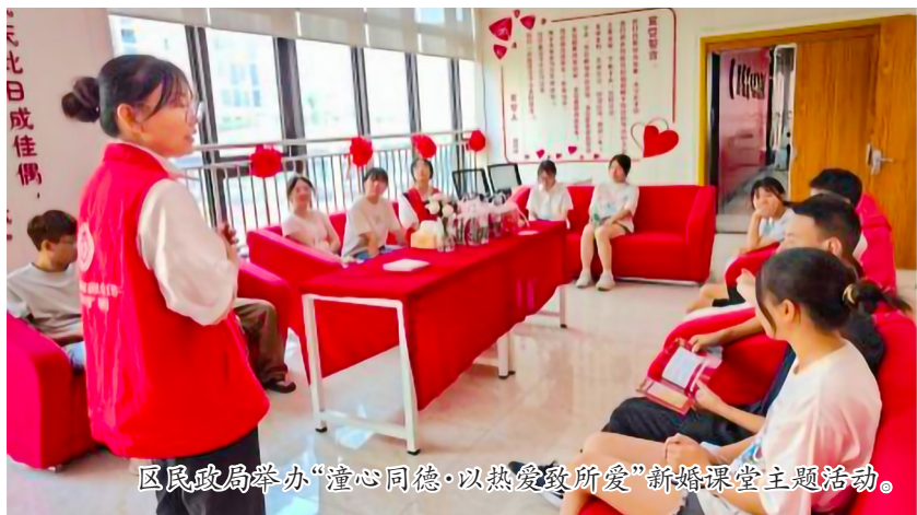
区民政局举办“潼心同德·以热爱致所爱”新婚课堂主题活动。