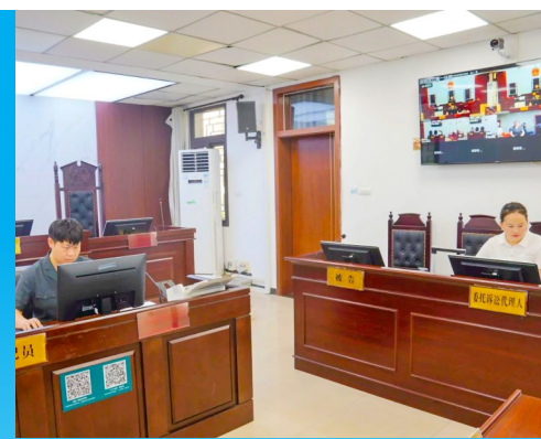
法官通过“全渝数智法院TV版”审理案件。