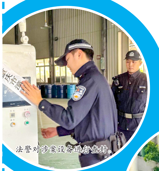
民警对涉案设备进行查封。