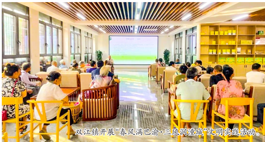
双江镇开展“春风满巴渝·三风润潼城”文明实践活动。