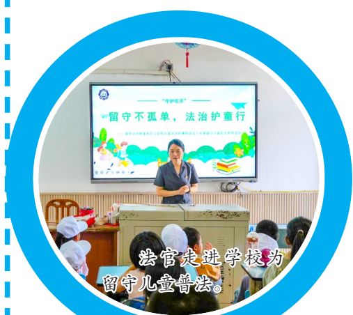
法官走进学校为留守儿童普法。

接下来，区法院将持续深化执行信息化、智能化建设，聚焦执行环节难点奋力攻坚，拓展网络查控系统，迭代升级“5G执行背包”应用场景，深化“执行一件事”改革，以高质量司法服务辖区经济社会高质量发展。