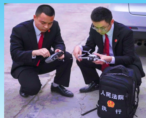
法官利用“5G执行背包”办案设备了解情况。