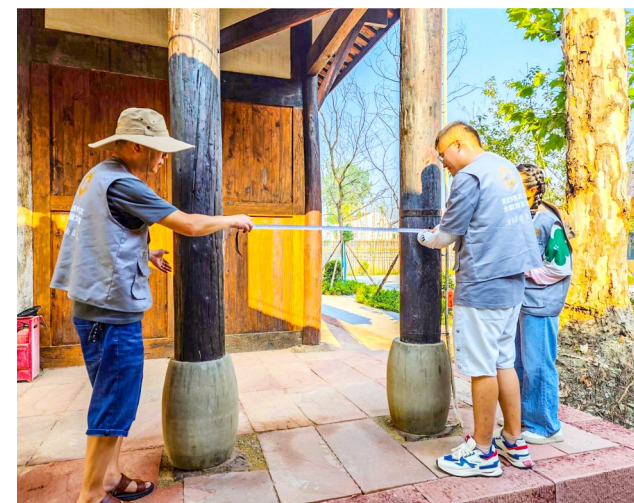
普查队员测量文物数据。

本报讯(全媒体记者 张凡 罗昌泽)近日,我区第四次全国文物普查工作组对我区23个镇街文物点开展信息采集、数据测量、图片绘制等工作。