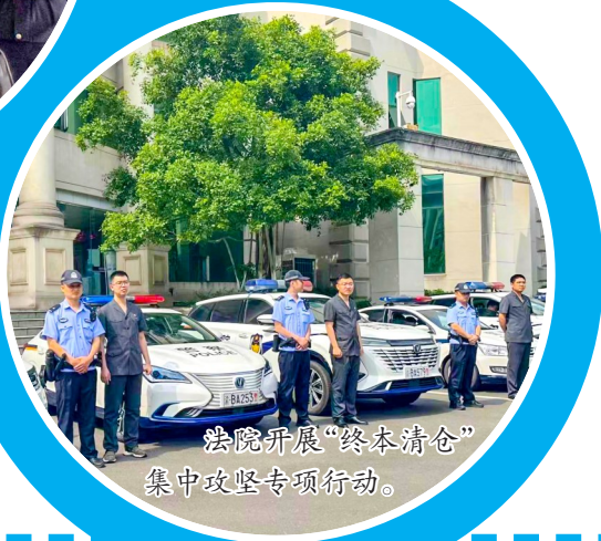
法院开展“终本清仓”集中攻坚专项行动。