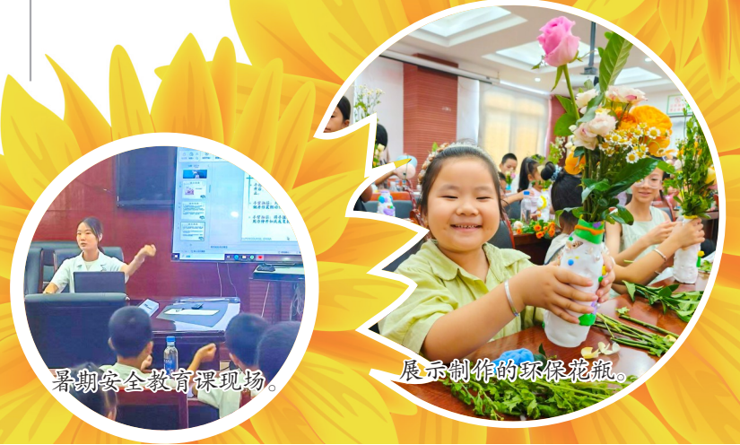
暑期安全教育课现场。

此次活动培养了青少年们的创造思维和实践能力,引导他们从小树立环保意识,养成垃圾分类、废物回收的好习惯。今后,上和镇将持续开展丰富多彩的环保宣传教育活动,引导辖区青少年积极践行绿色环保理念。