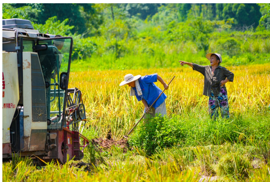
村民招呼收割机下田。