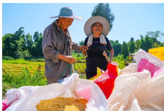
村民脸上洋溢着丰收的喜悦。