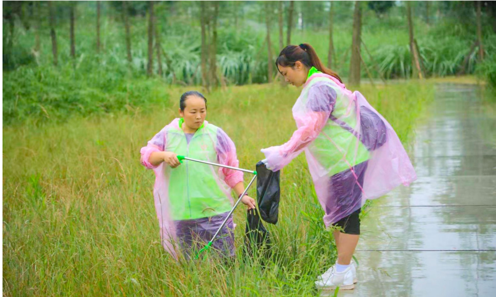
“河小青”志愿者清理江边垃圾。

根据协议,川渝九地将以美丽涪江建设为统领,合力推进涪江流域干支流、上下游、左右岸系统治理,共抓生态管控、共治跨界污染、共建美丽河湖、共促绿色转