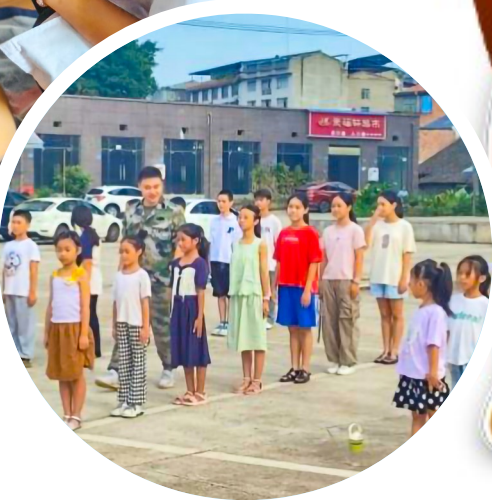
基本军事动作训练。