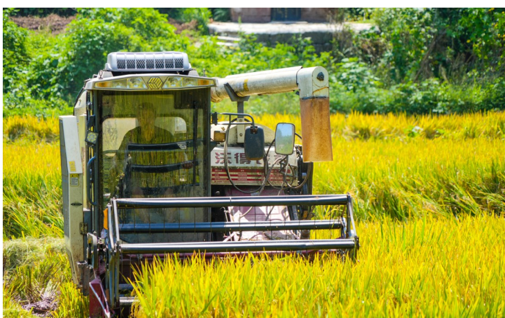
机手驾驶收割机在稻田间劳作。