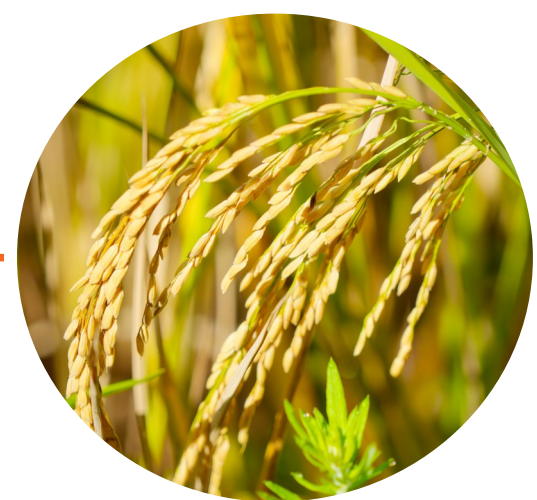
饱满的稻谷压弯稻秆。

记者了解到，我区今年水稻种植面积达39.3万亩，预计产量超过21万吨，本地的农机合作社和区外跨区服务队共计600多台农机正在开展水稻机收服务，为水稻颗粒归仓提供强大助力，预计水稻在8月中下旬收割完毕。