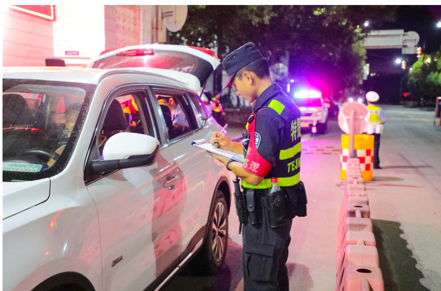
对过往车辆进行登记检查。

入夏以来,区公安局紧密结合辖区实际,综合运用“船巡+步巡”等方式,紧盯重点时段、重点地点,每日对涉水区域开展巡查看护,提高见警