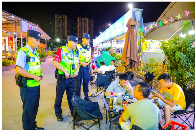
▲ 提醒市民夜间降低音量不要噪声扰民。 ▶ 向从业人员宣传安全防范知识。