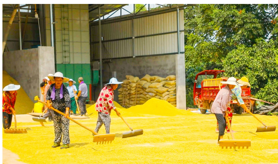
村民正在晾晒稻谷。