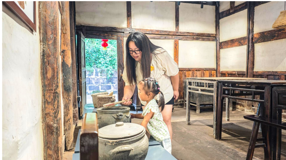
家长带小朋友体验乡土旧物。