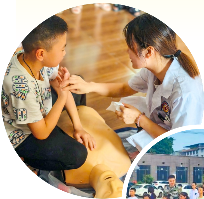
学习应急救护知识。

据了解,本次公益课堂由上和镇、团区委、区妇联、区关工委等单位联合举办,采取教育与托管相结合的方式,动员本地非遗传承人、大学生、志愿者等各类人才,积极参与暑期公益课堂志愿活动,实现“暑期安全+兴趣培养+国防教育+环保知识”的有效融合,让孩子们暑假安全“不放假”、学习有“趣”处。