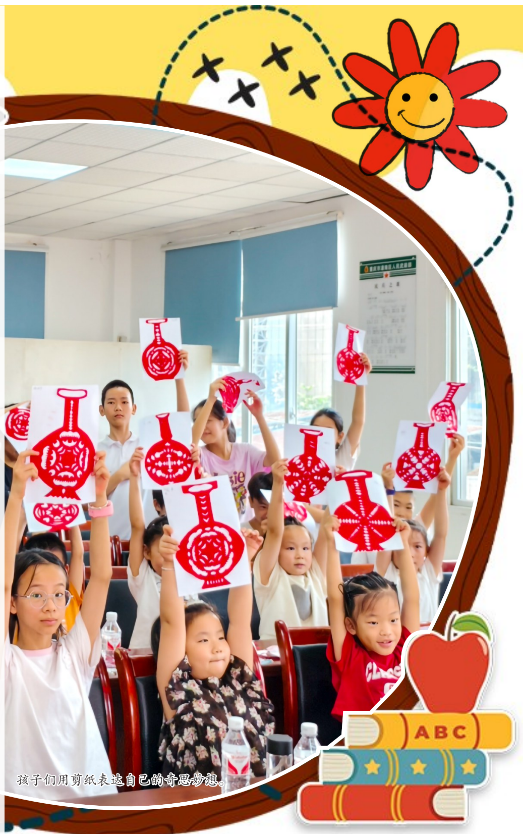
孩子们用剪纸表达自己的奇思妙想。