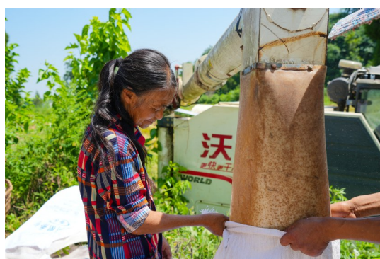
村民将脱粒后的稻谷装袋。