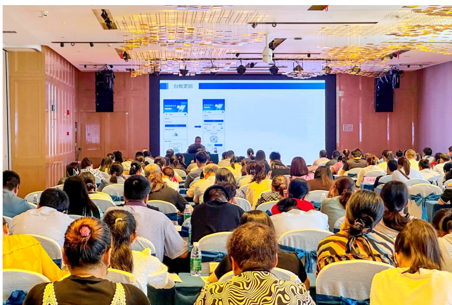
劳务经纪人培训课程现场。

老师对人力资源信息库信息采集更新、“渝职聘”推广应用、劳务经纪人平台实操进行深入培训。区人力社