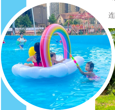
▲ 家长带着孩子到水上乐园感受清凉。

近年来,区非遗中心立足现有非遗资源,通过非遗进校园、进社区等活动,助推非遗项目向全民保护和传承方向发展。“下一步,我们将持续开展类似活动,通过寓教于乐的方式,让孩子们近距离感受非遗的独特魅力,也让潼南的非遗在传承中焕发新的生机。”区非遗中心相关负责人表示。