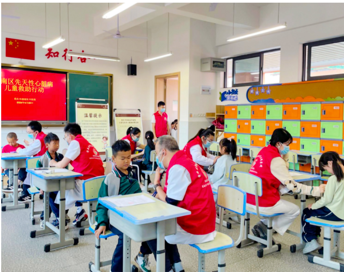
先天性心脏病筛查进校园。