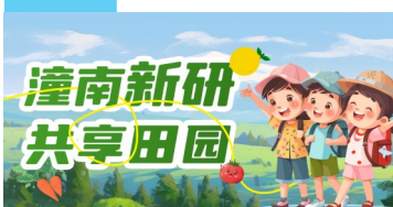
▼ 儿童展示制作成品。