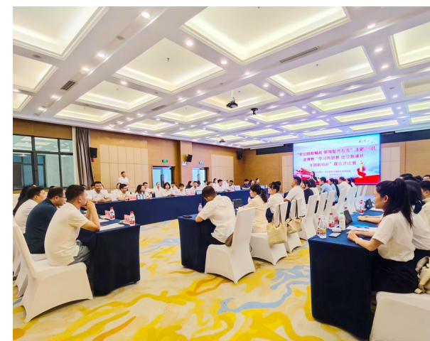
竞赛现场选手们仔细聆听规则做好充分准备。

下一步,我区将深化竞赛宣讲成果,创新学习方式,拓宽实践渠道,以赛促学、以学促干,推动党的创新理论走深走实,切实把学习成果转化为干事创业的强大动能,奋力谱写潼南高质量发展新篇章。