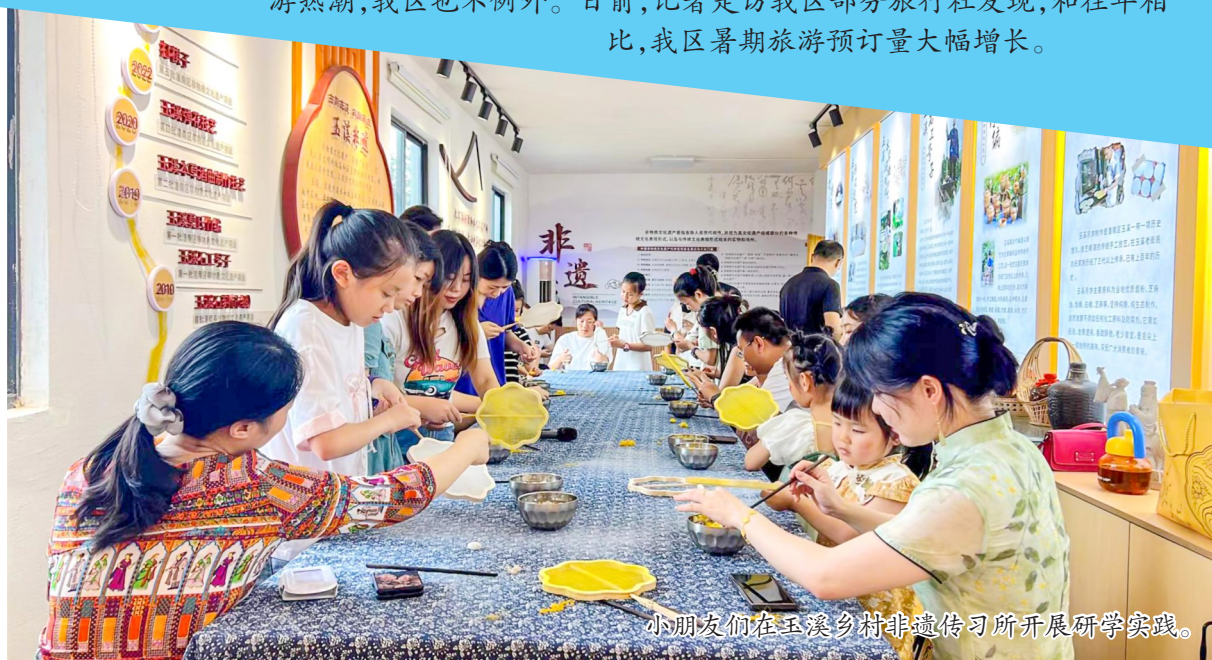
小朋友们在玉溪乡村非遗传习所开展研学实践。

夏日渐深,从繁华都市到宁静乡村,从山川湖海到历史名城,处处都洋溢着游客的欢声笑语,文旅市场焕发出勃勃生机与无限活力。全国范围内都掀起暑期旅游热潮,我区也不例外。日前,记者走访我区部分旅行社发现,和往年相比,我区暑期旅游预订量大幅增长。