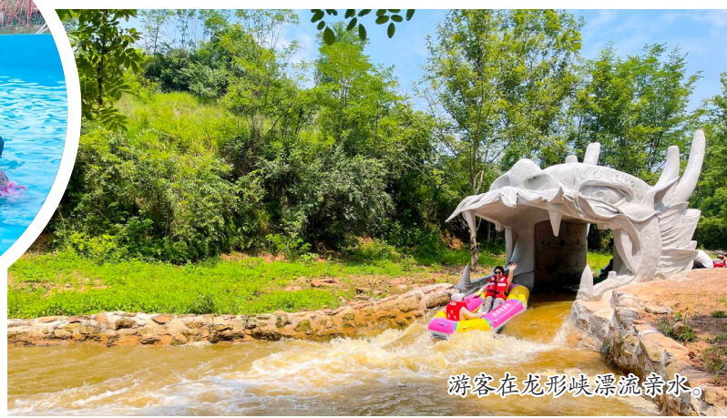
游客在龙形峡漂流亲水。