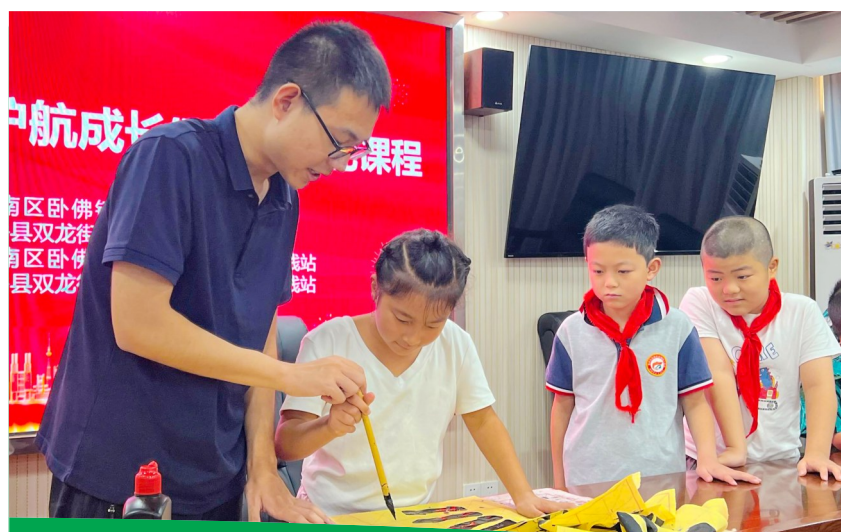
练习书法基本笔法。