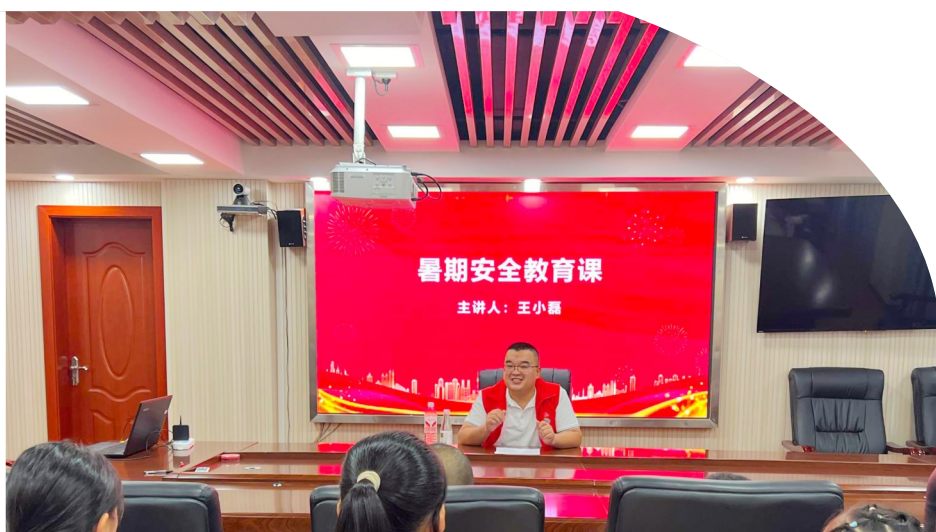
暑期安全教育课现场。