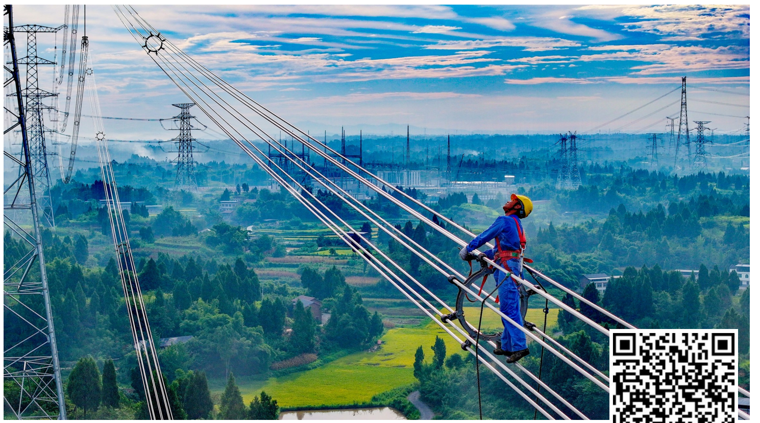
走线验收现场。