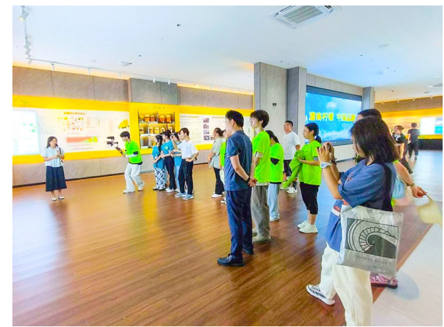
实践团成员了解潼南柠檬脱毒流程与培育管理。

本报讯（全媒体记者 李彦亭）日前，四川大学“柠”聚力暑期社会实践团队来潼开展为期五天的暑期“三下乡”社会实践活动。