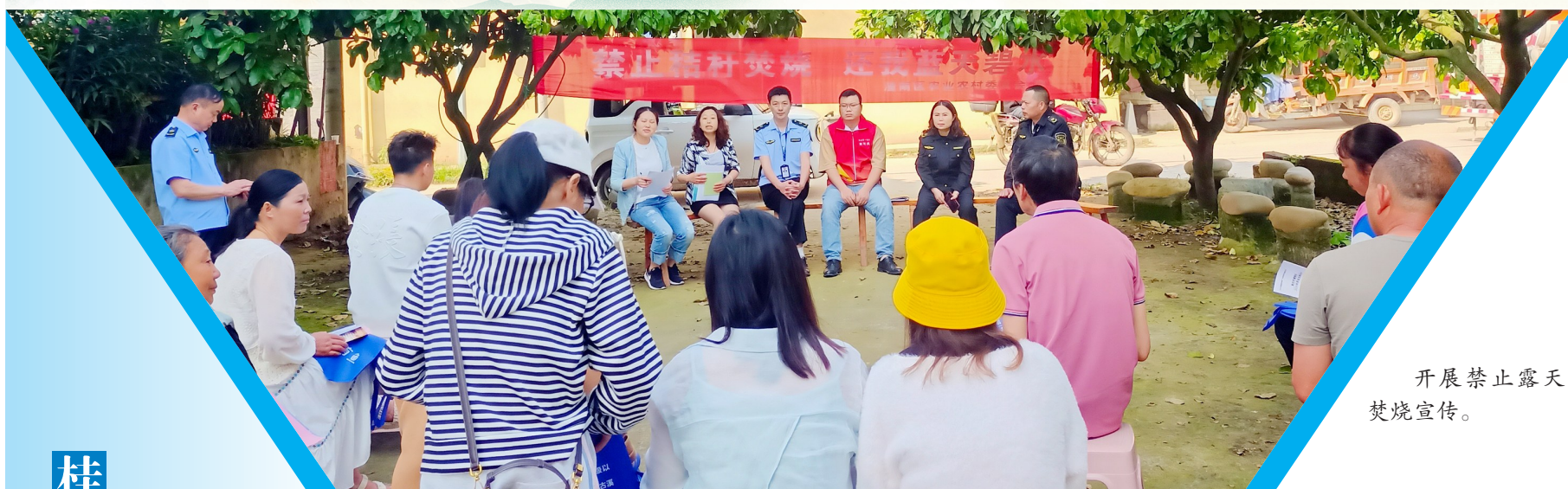
开展禁止露天焚烧宣传。