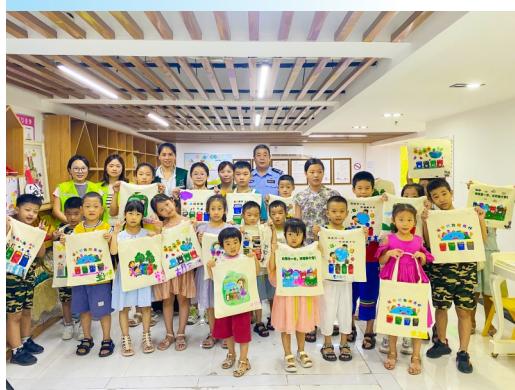
小朋友参加垃圾分类手绘活动。