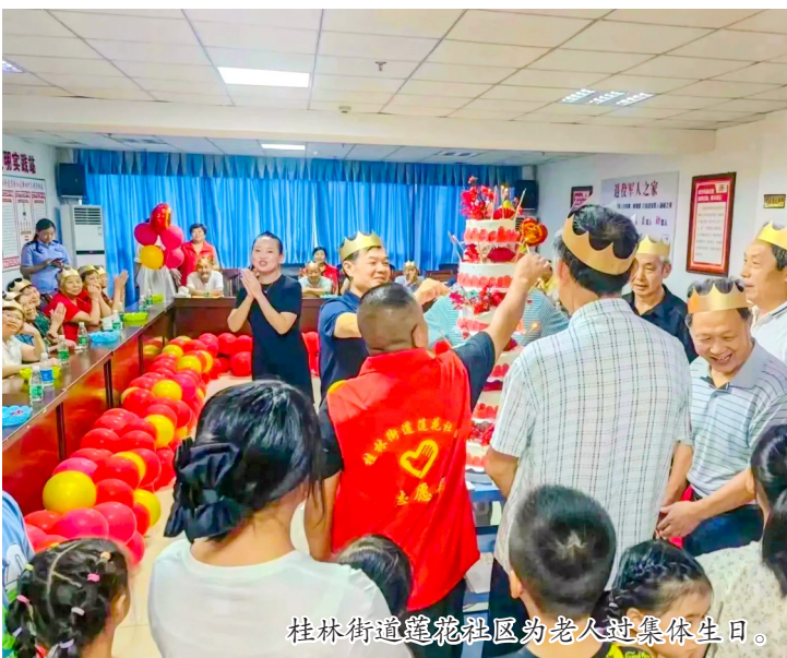
桂林街道彩虹社区为老人过集体生日。