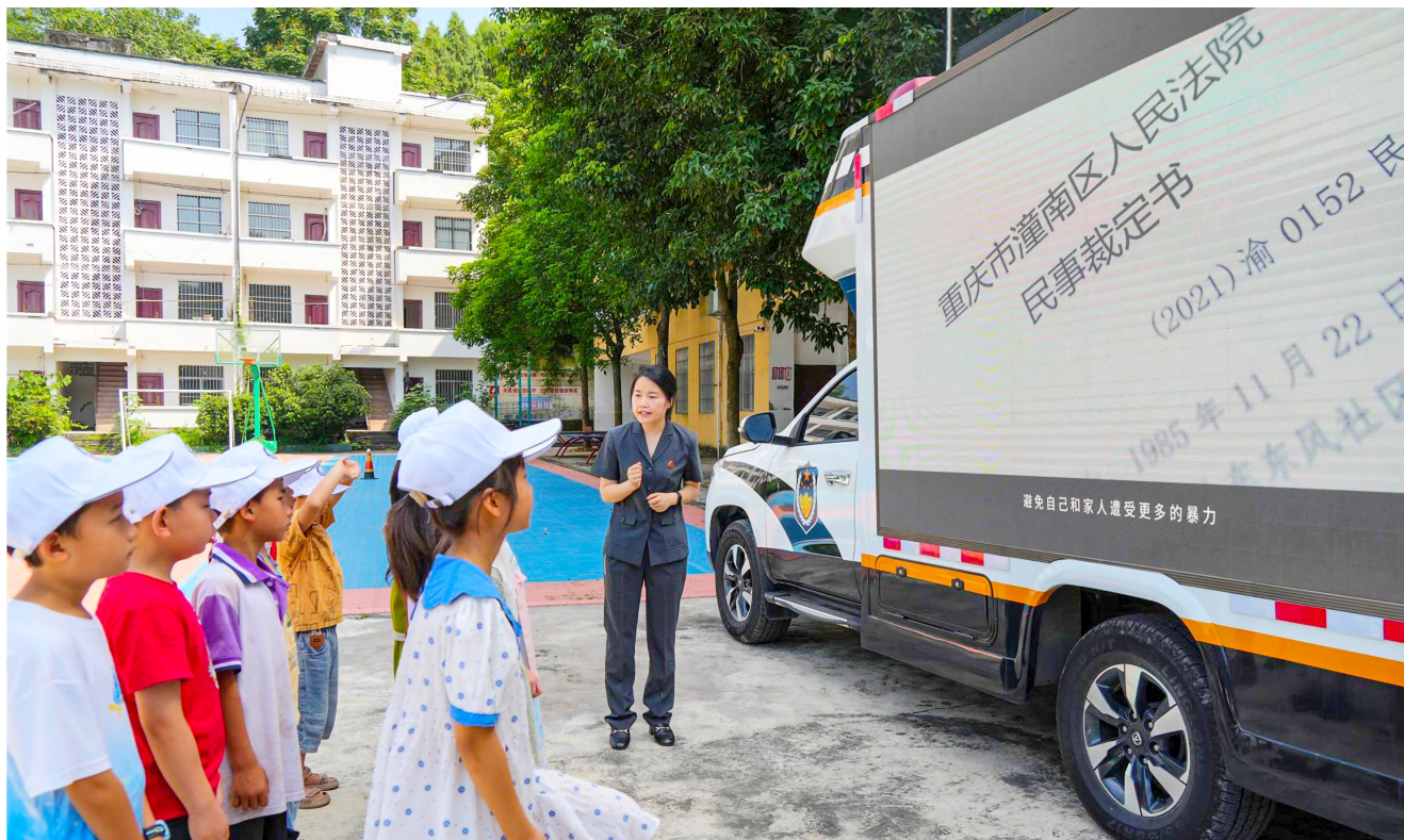
法官播放宣传片，帮助儿童了解法院工作。

随后，在法官的带领下，孩子们有序地走进车载便民法庭参观。在法官详细的讲解下，了解车载便民法庭的来历、用途和功能，近距离感受法律的庄严和公正。