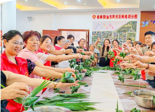
桂林街道东风社区“粽”情端午活动现场。