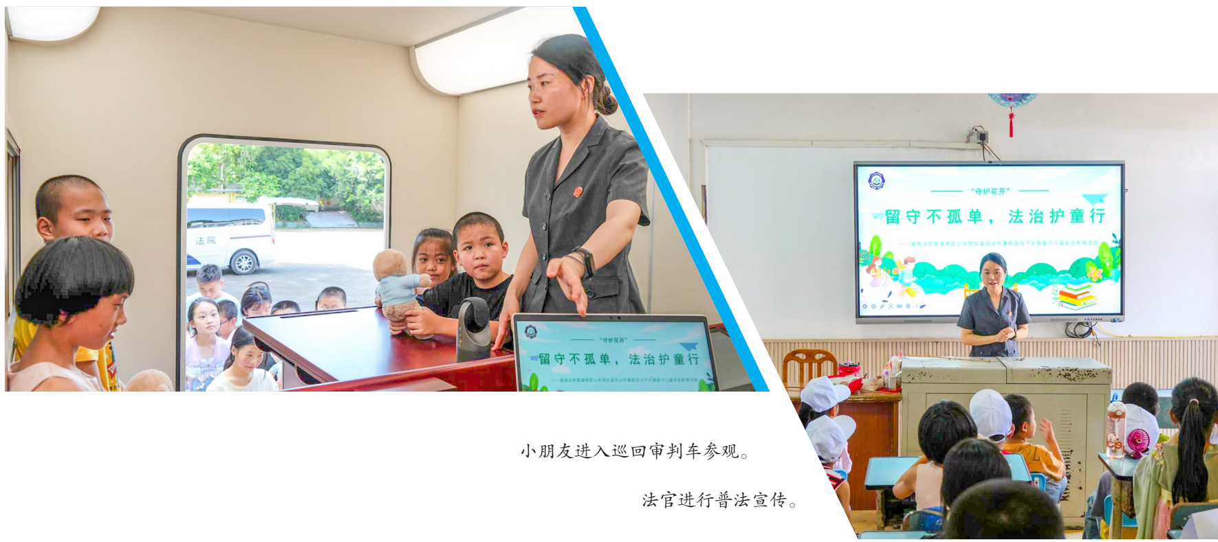
小朋友进入巡回审判车参观。