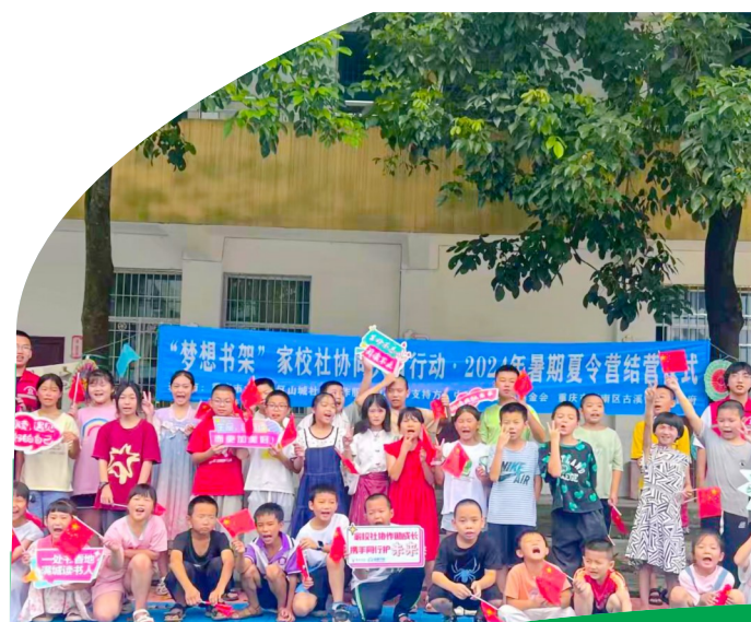
结营仪式合影留念。