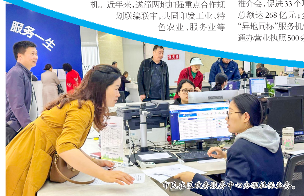
市民在区政务服务中心办理社保业务。