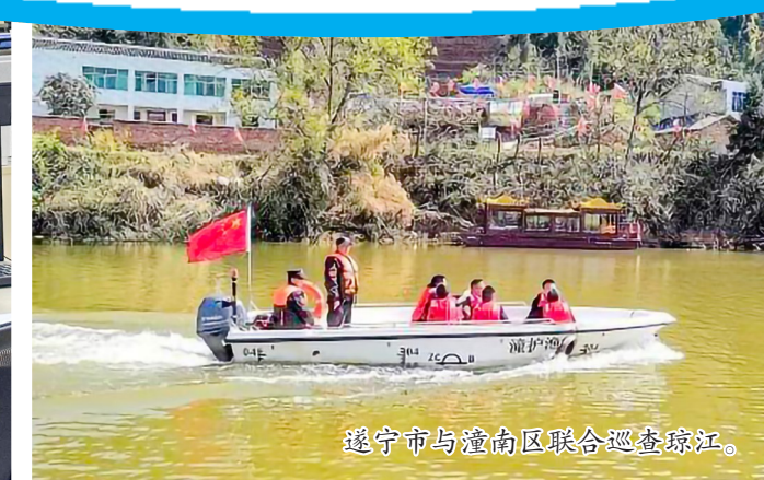
遂宁市与潼南区联合巡查琼江。