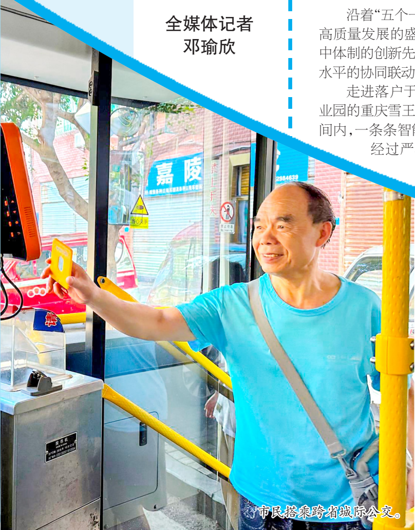
市民搭乘跨省城际公交。

遂潼一体化,共建先行区。围绕“五个一体化”,遂潼两地将继续拓展合作领域、深化合作内涵,推动成渝中部先进制造业集聚地先行跨越、成渝现代高效特色农业带先行示范等“十个先行”实现新突破,努力打造毗邻协作新样板。