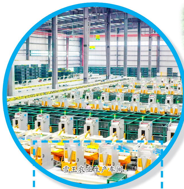
雪王农业生产车间。