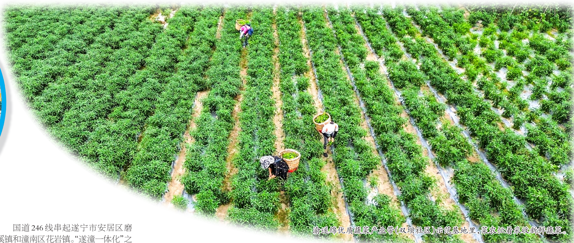
渝遂绵优质蔬菜产业带(双坝社区)示范基地里,菜农忙着采收新鲜蔬菜。