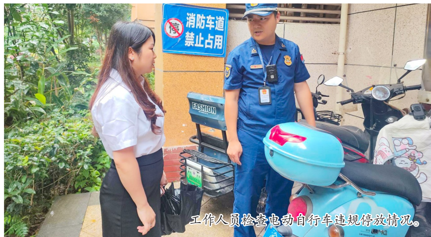
工作人员检查电动自行车违规停放情况。

本报讯(全媒体记者 陈俊豪 罗昌泽)6月26日,区住房城乡建委联合区城市管理局、区公安局、区市场监管局、区应急管理局、区消防救援支队、梓潼街道、国网潼南供电公司等单位在健能绿都小区集中开展电动自行车专项整治行动。