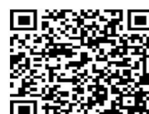
扫码看更多精彩内容

“通过本次活动,潼南非遗不仅展示了中国的独特魅力,也促进了中外文化的交流与融合,进一步助力推动潼南产品的国际化进程。”区人社局负责人表示,将继续积极营造尊重劳动、崇尚技能的社会氛围,全力推进我区高技能人才队伍建设,为培育和发展新质生产力提供坚强技能人才支撑。