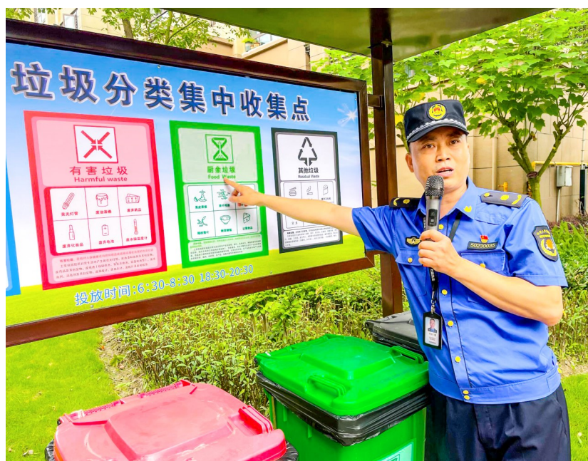
工作人员讲解示范垃圾分类。

本报讯(全媒体记者 徐利 刘城志)6月25日,我区城市生活垃圾分类现场观摩会在桂林街道华夏城小区开展,梓潼街道、桂林街道、大佛街道、区物业协会及辖区各物业企业相关负责人参加活动。