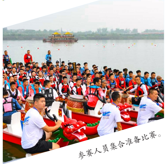
参赛人员集合准备比赛。