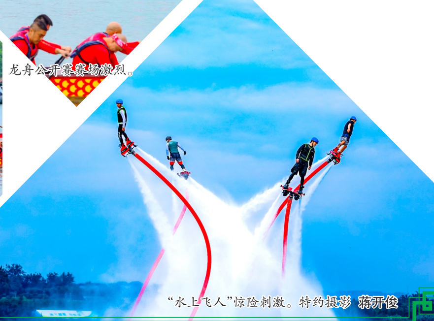
“水上飞人”惊险刺激。