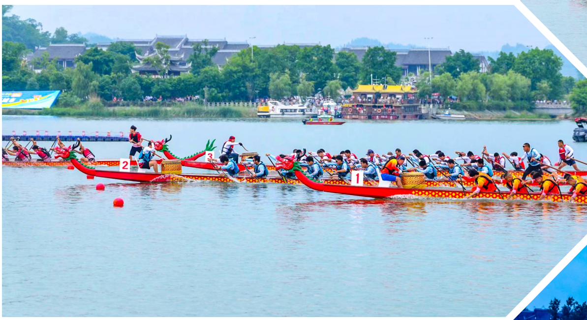
龙舟如同离弦之箭,竞相冲刺而出。