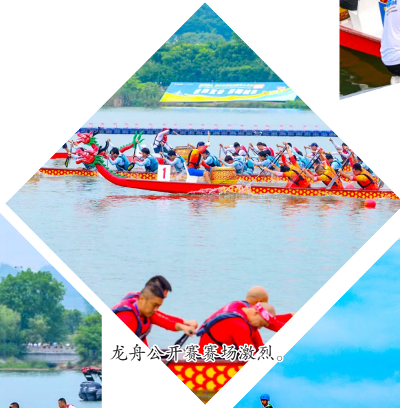
龙舟公开赛赛场激烈。