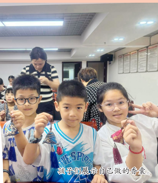
孩子们展示自己做的香囊。