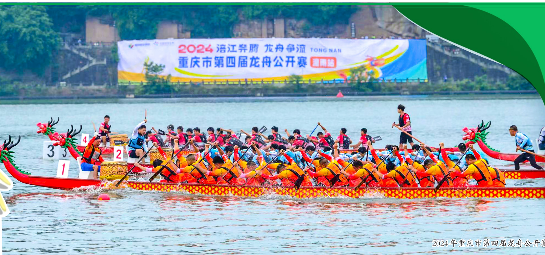
2024年重庆市第四届龙舟公开赛(潼南站)。

百舸争流涪江畔,挥桨击楫赛龙舟。6月1日上午,2024年重庆市第四届龙舟公开赛(潼南站)在涪江大佛寺段水域激情开赛,八方来客再次相约涪江之畔,齐庆端午佳节。