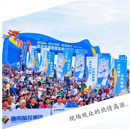
现场观众的热情高涨。