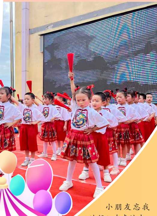
小朋友忘我地投入在表演中。