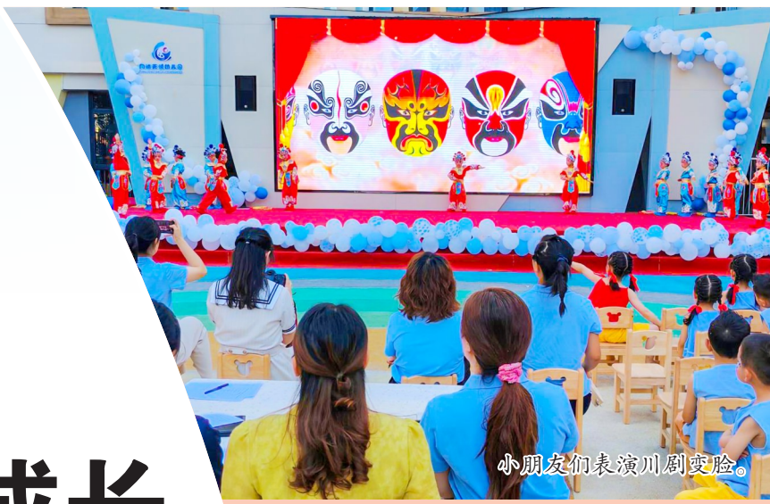
小朋友们表演川剧变脸。