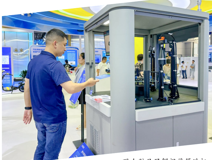
观众驻足了解视觉筛选机。