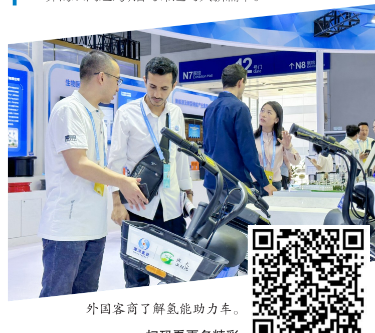
外国客商了解氢能助力车。