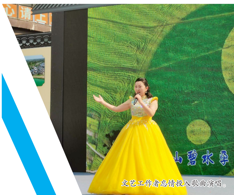
文艺工作者忘情投入歌曲演唱。