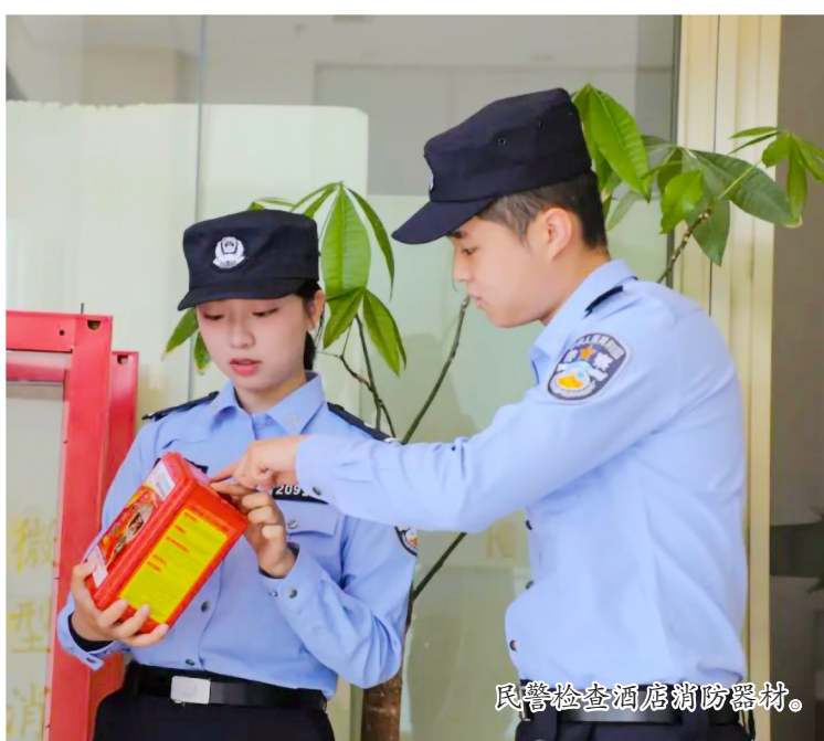
民警检查酒店消防器材。