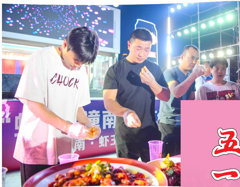
大众评审评选虾味王。