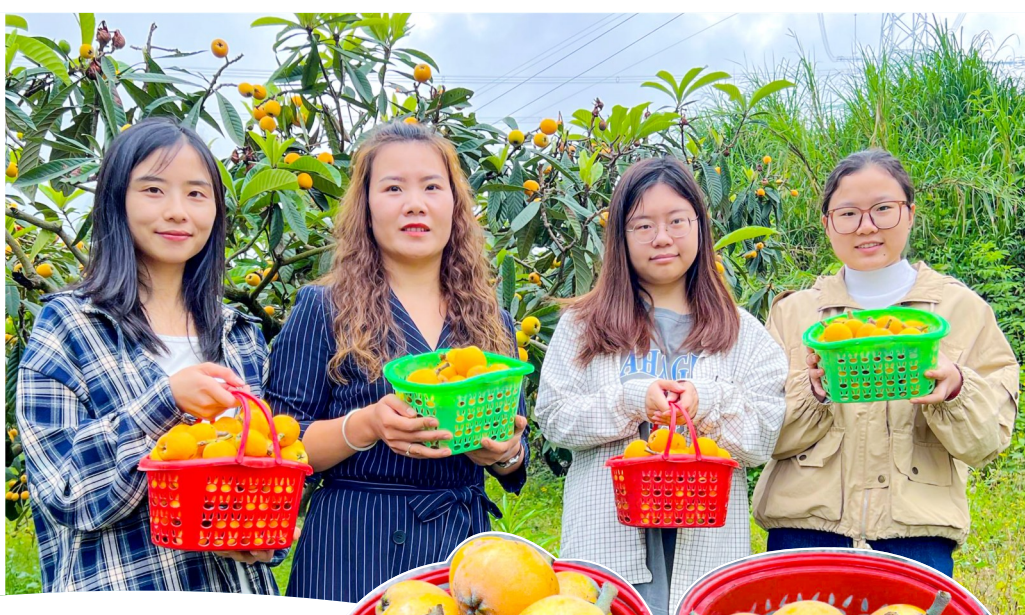
市民尽享收获的喜悦。