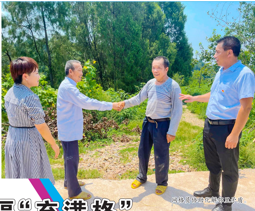
网格员协助化解邻里矛盾。