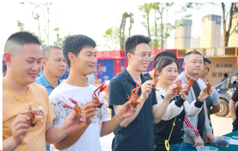
养殖户展示虾皇虾后。