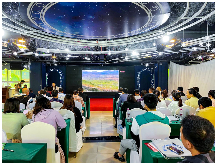
理论知识培训现场。

农业机械化是现代农业生产的重要标志,也是实现农业现代化的关键举措。近年来,潼南紧紧围绕