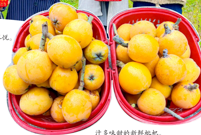
汁多味甜的新鲜枇杷。