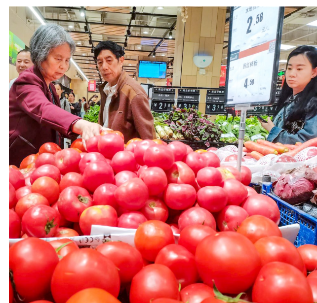
市民在超市选购蔬菜。