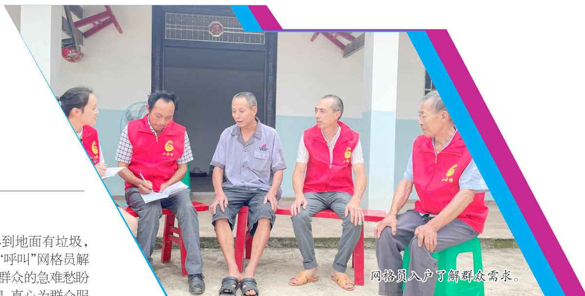
网格员入户了解群众需求。

“网格员在不在，小区有人乱停车”“修隧道把我房子震裂了，还怎么住，必须要给个说法”在基层，网格员的任务常常多而杂，小到巡查村社卫生、解决邻里纠纷，大到排查安全隐患、维护稳定，都要时