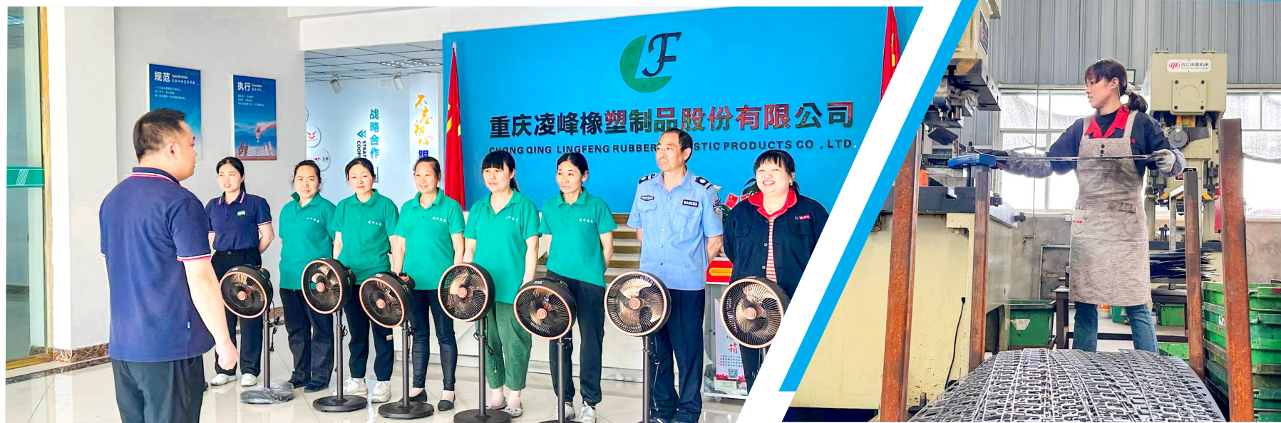
◀ 企业为生日员工发放礼物。 ▶ 车间工人生产作业。