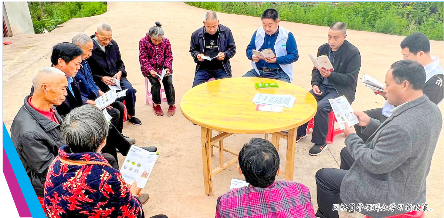
网格员带领群众学习新政策。

区欧美同学会会长、潼南高新区科创中心主任叶森表示，习近平总书记在重庆主持召开新时代推动西部大开发座谈会并发表重要讲话，为推动西部地区高质量发展擘画蓝图、领航掌舵。当前潼南正处于赶超跨越的黄金期，正迎来双城经济圈建设、成渝中部崛起和渝西地区一体化高质量发展、西部陆海新通道建设等历史性机遇，发展潜力巨大、前景广阔。作为欧美同学会会员，我将牢牢把握“留学报国人才库、建言献策智囊团、民间外交生力军”的工作定位，广泛团结海内外留学人员，不断凝聚思想共识，与党同心同向同行，充分挖掘和整合留学人员的资源，以实际行动，为潼南加快建设成渝地区中部崛起增长极、产城景融合发展桥头堡添砖加瓦，为新时代推动西部大开发建设增光添彩。