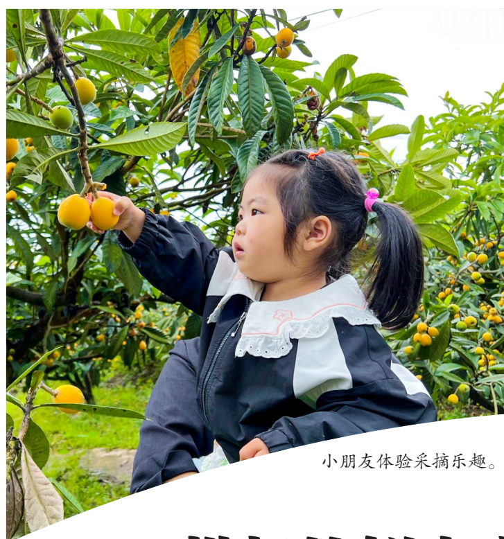
小朋友体验采摘乐趣。