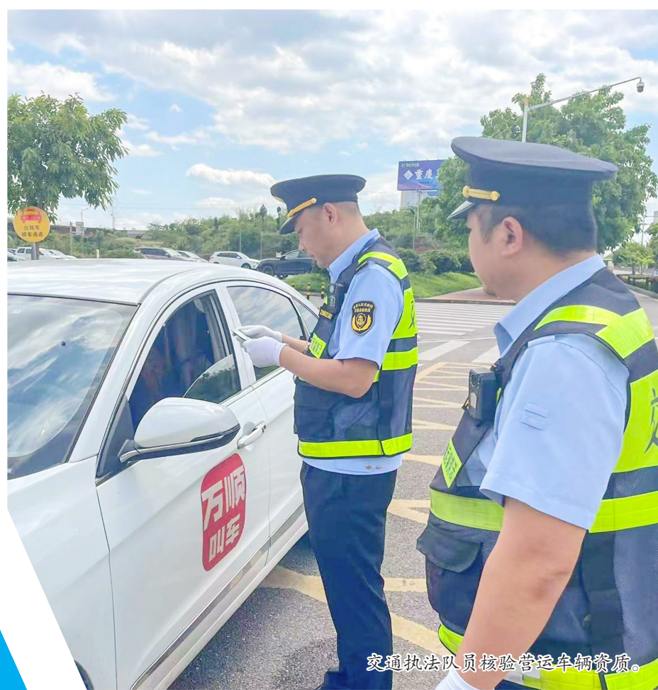
交通执法人员核验营运车辆资质。