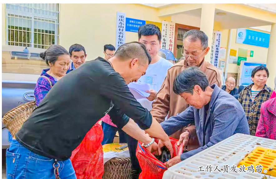
工作人员发放鸡苗。

本报讯(全媒体记者 陈俊霖)“快来领鸡苗咯,大家排好队,按照顺序一个一个来,鸡苗拿回家要第一时间放出来降温哟……”为激发困难群众