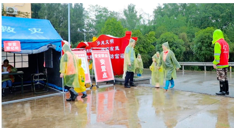
安置点有序安置转移群众。