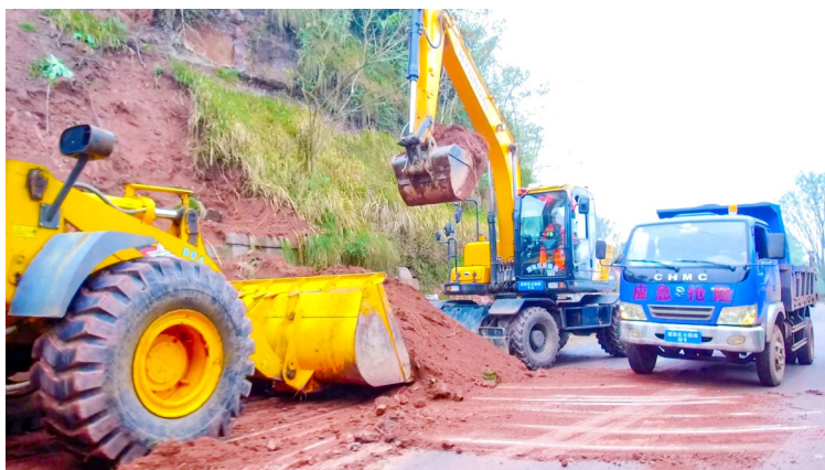
演练中,紧急疏通塔防受阻道路。