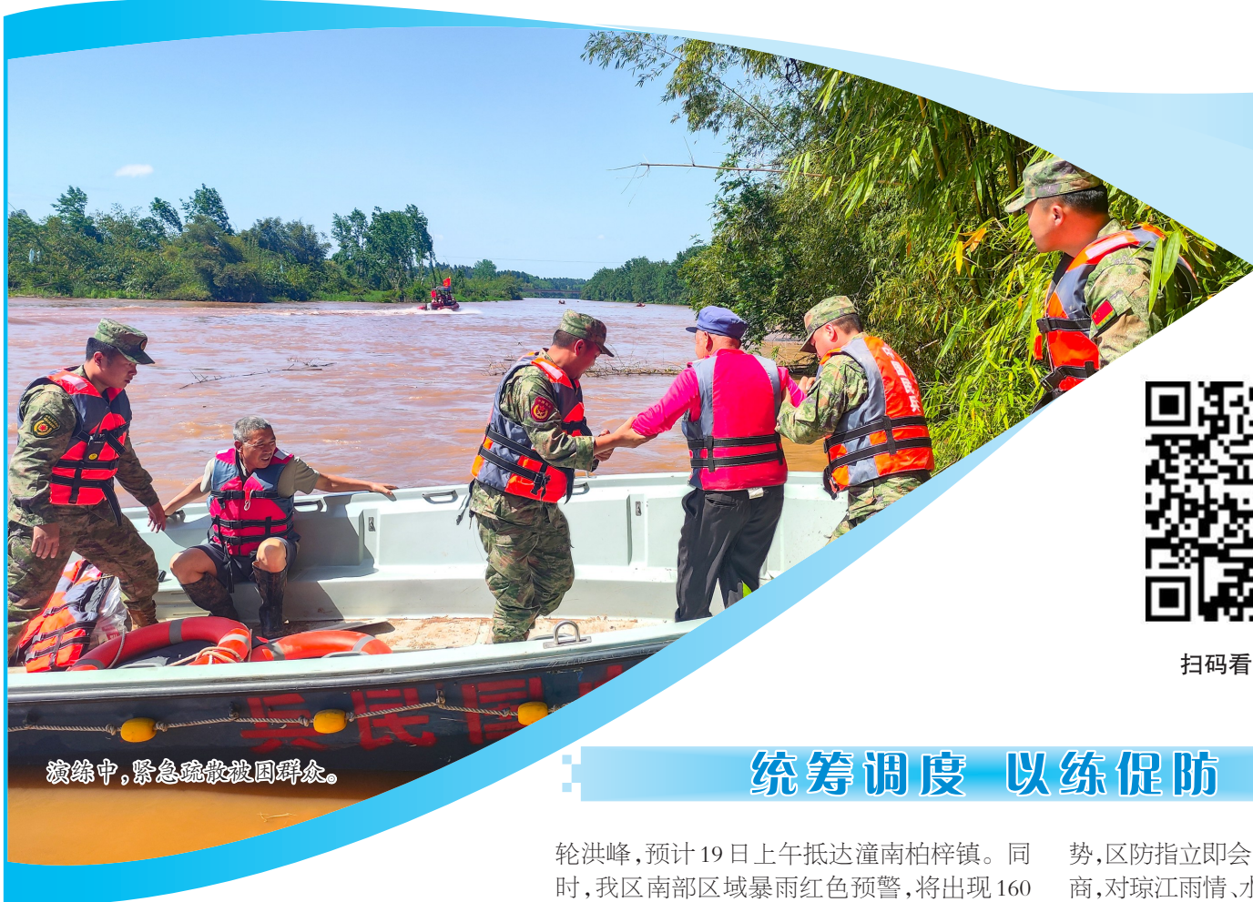
演练中,紧急疏散被困群众。

4月15日,全市提前进入2024年汛期。据气候预测,今年汛期,我区气温偏高,降水偏多,总体趋势涝重于旱,自然灾害趋势严峻复杂。汛期早涝交替、涝重于旱,暴雨洪涝和强对流天气重于常年。