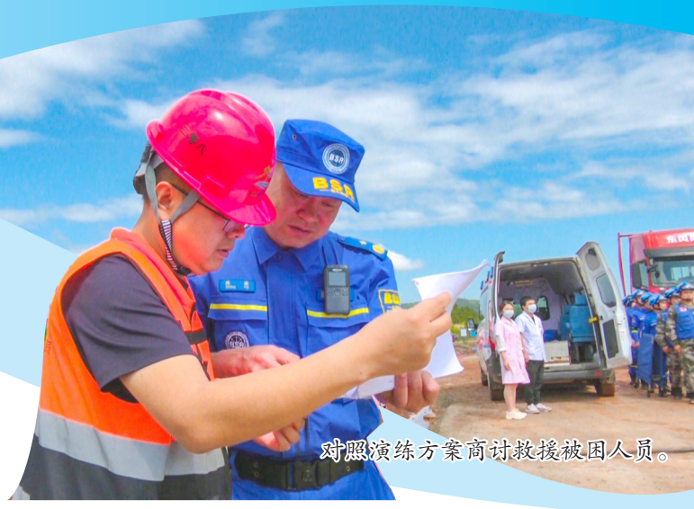
对照演练方案商讨救援被困人员。