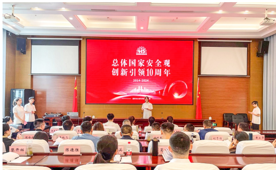
宣讲员讲解总体国家安全观的核心要义。