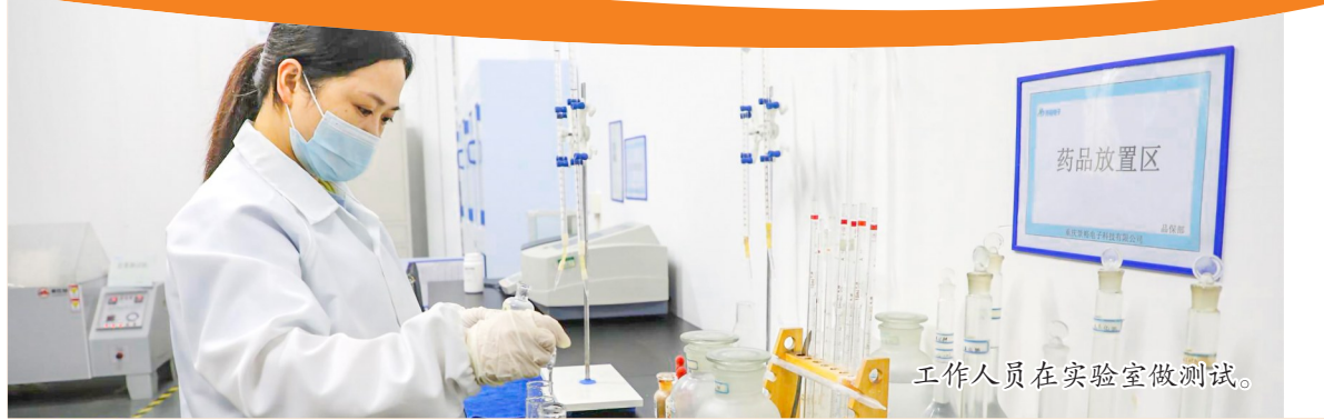
工作人员在实验室做测试。

为大力弘扬劳模精神、工匠精神、劳动精神，区总工会联合本报推出“中国梦·劳动美”——劳动筑梦 榜样“潼”行系列报道，走近各行各业的先进集体和个人，与读者一起分享劳动者的奋斗故事，团结引领潼南广大职工在建设美丽新潼南、共圆伟大复兴梦想中建功立业，展现新作为，作出新贡献。