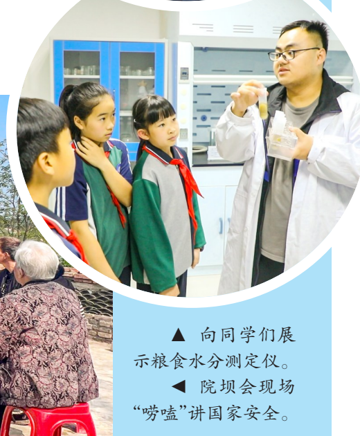
▲ 向同学们展示粮食水分测定仪。 ▲ 院坝会现场“唠嗑”讲国家安全。