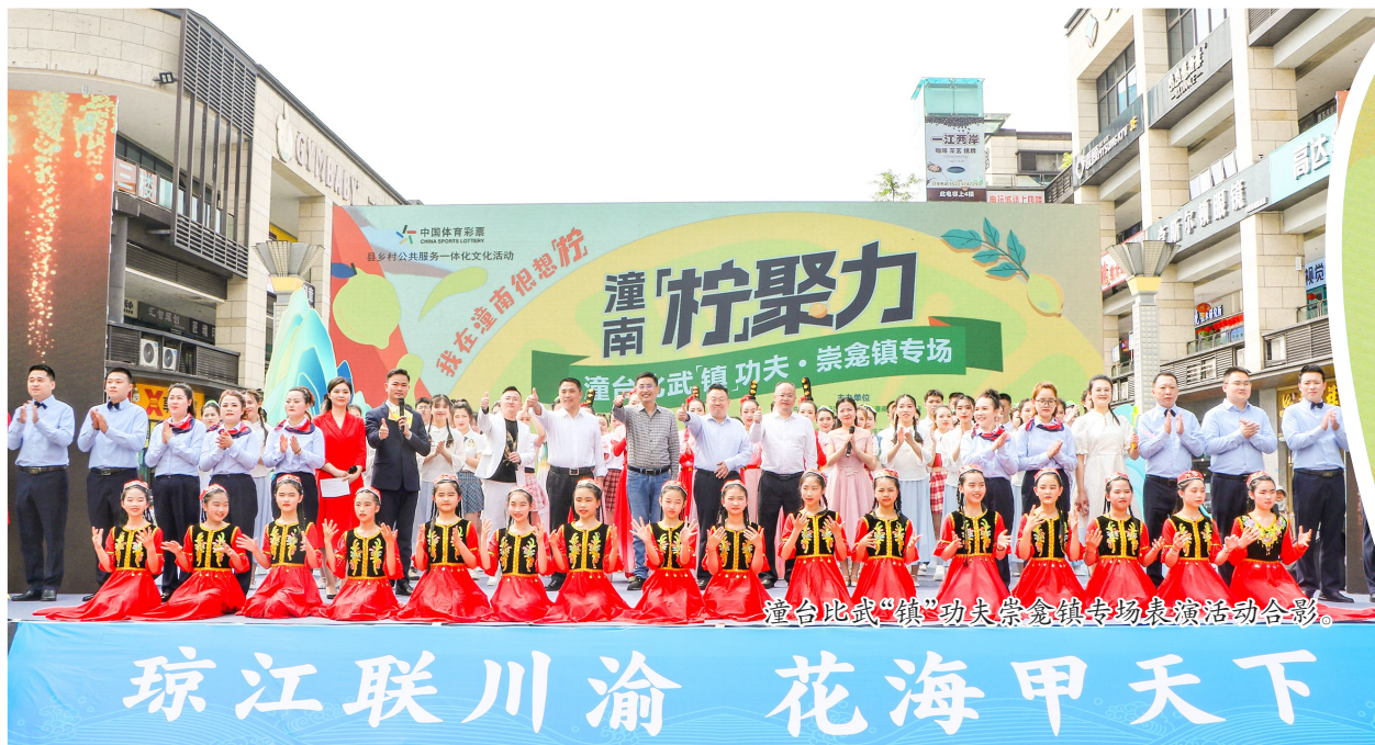
潼台比武“镇”功夫崇龛镇专场表演活动合影。