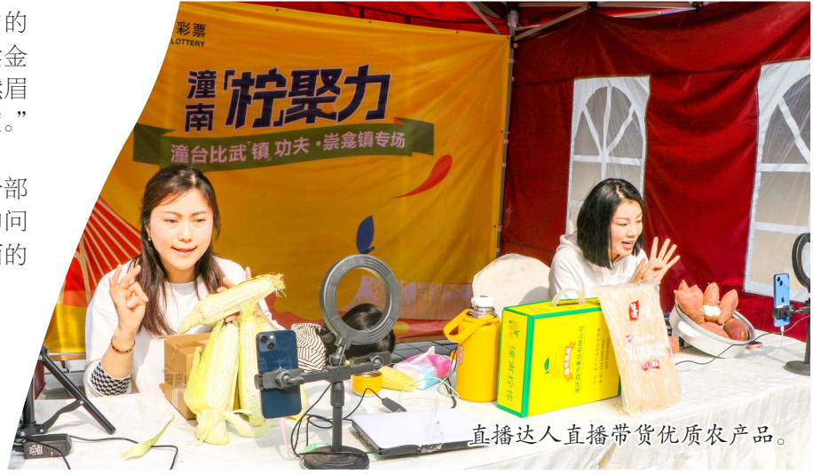
直播达人直播带货优质农产品。