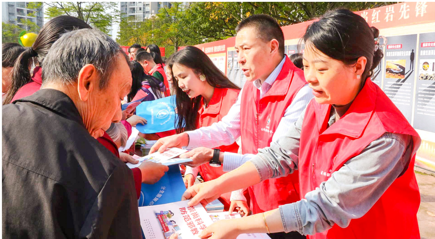
活动现场发放宣传资料。