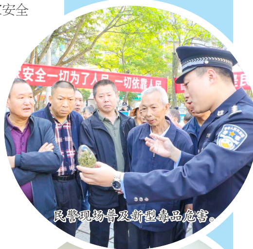
民警现场普及新型毒品危害。

4月15日是第九个全民国家安全教育日。为进一步提高群众的国家安全意识,营造国家安全“人人有责、人人可为”的良好社会氛围,近日,我区通过开展总体国家安全观宣传活动等形式多样的国家安全教育宣传行动,全方位普及国家安全知识,切实推动国家安全教育走向基层、深入群众。