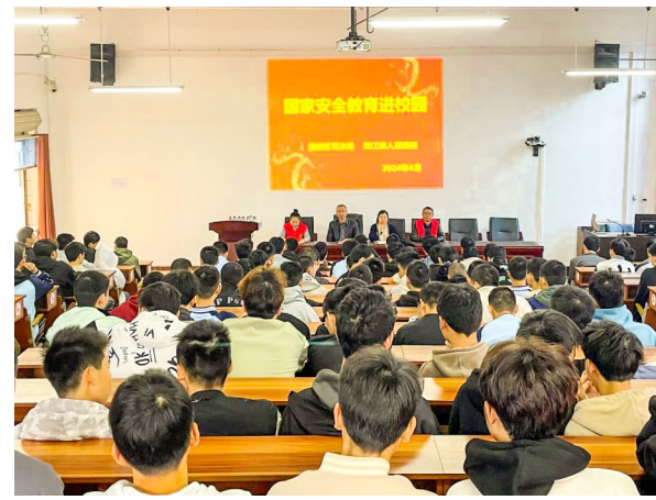
向学生讲解国家安全教育知识。