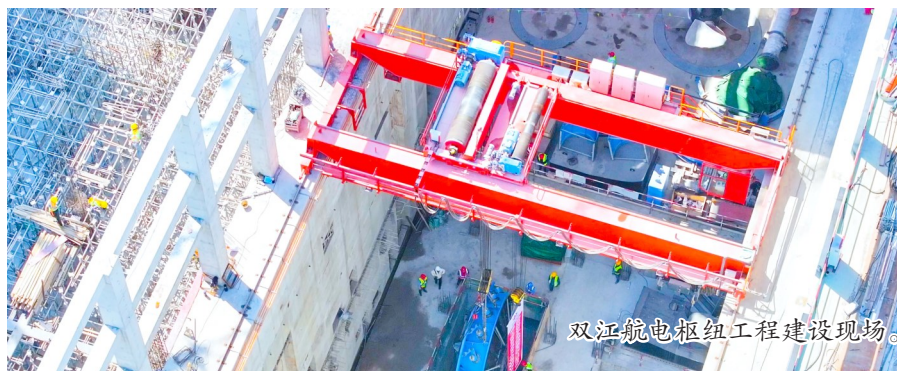
双江航电枢纽工程建设现场。

春潮涌动催奋进，项目建设正当时。今年以来，我区共谋划项目160个，含市级重点项目25个，总投资716.02亿元。截至目前，完成投资19.58亿元。其中，双江航电枢纽、东升大桥等续建项目83个，重庆市潼南区大石桥水库中型灌区、潼南区火车站及配套设施升级改造等项目等计划新开工项目77个。据统计，目前，续建项目复工率100%，新建项目开工率40%。