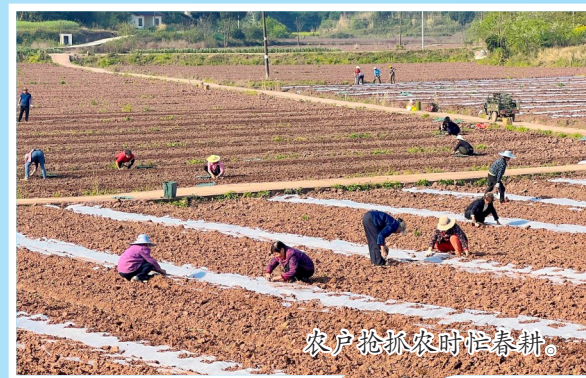
农户抢抓农时忙春耕。