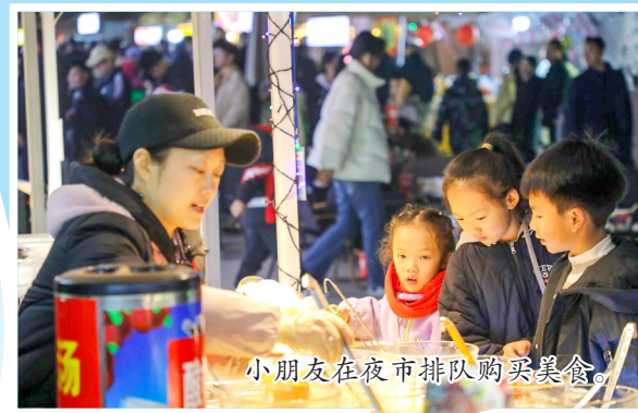
小朋友在夜市排队购买美食。