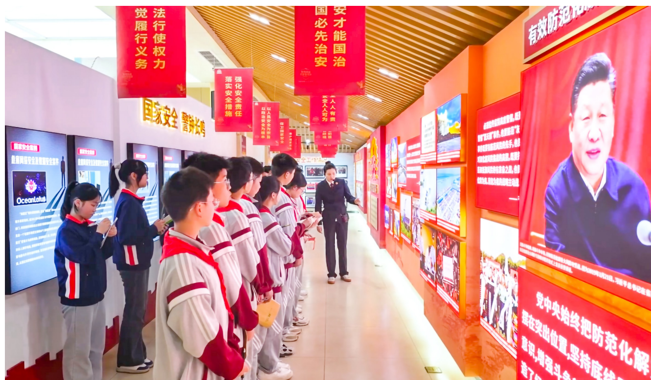
学生在解说员的引导下深入了解总体国家安全观。

“大家看到这里，总体国家安全观，为做好新时代国家安全工作提供了根本遵循和行动指南……”4月8日，在我区国家安全教育基地，讲解员正详细地为来访人员讲解总体国