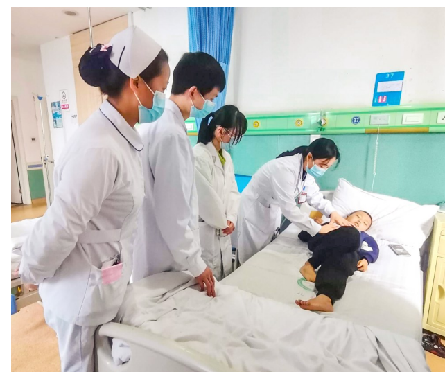
医生给患儿检查身体。

本报讯(全媒体记者 陈俊霖 罗昌泽)进入春季，气温回升，儿童手足口病也进入高发季节，学校和托幼机构等人员密集场所发生聚集性疫情的风险升高。手足口病有哪些特点？又该如何预防？来听听医生的建议。