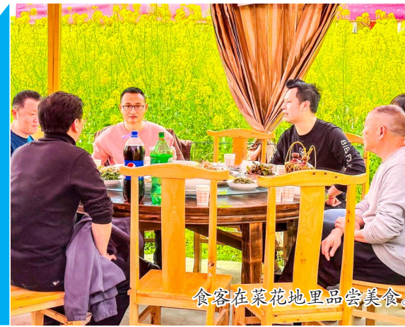
食客在菜花地里品尝美食。

据统计，一季度以来，全区消费市场火热，限上商品销售总额197328万元，同比增长23.4%。节日期间，潼南限上住宿营业额1453万元，同比增长21.7%，限上餐饮营业额15115万元，同比增长13.9%。