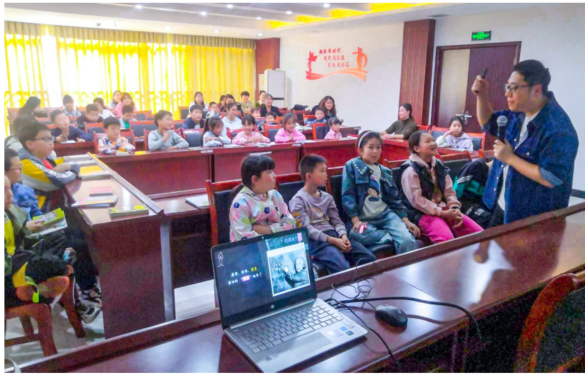
教授讲解家庭教育知识。