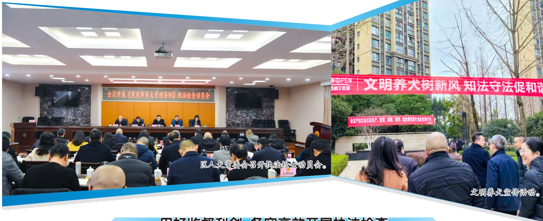
区人大常委会召开执法检查动员会。

养犬事小，关系民生。为增强人大监督实效，切实推动解决犬只伤人、犬吠扰民等突出问题，根据市委、市人大常委会工作安排，上下联动开展《重庆市养犬管理条例》（以下简称《条例》）执法检查，区人大常委会立足潼南实际，将《条例》执法检查列入2024年重要议题，强化法律法规实施监督，在依法监督上展现新作为，用法治力量守护居民健康生活、文明城市风景，着力推动依法养犬、规范养犬、文明养犬。