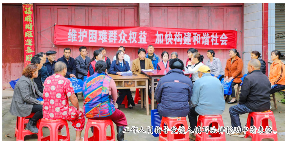
工作人员指导受援人填写法律援助申请表。