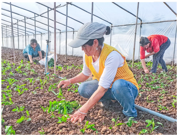
▲ 村民们正在栽种空心菜苗。