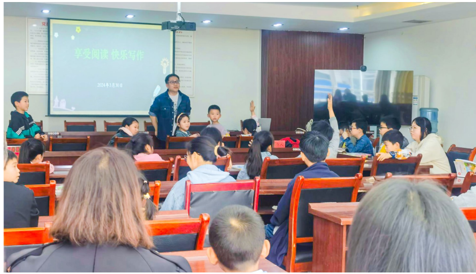
与会人员踊跃举手回答问题。