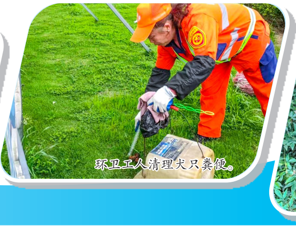
环卫工人清理犬只粪便。