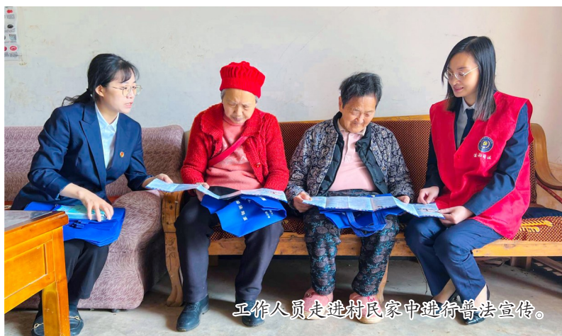
工作人员走进村民家中进行普法宣传。