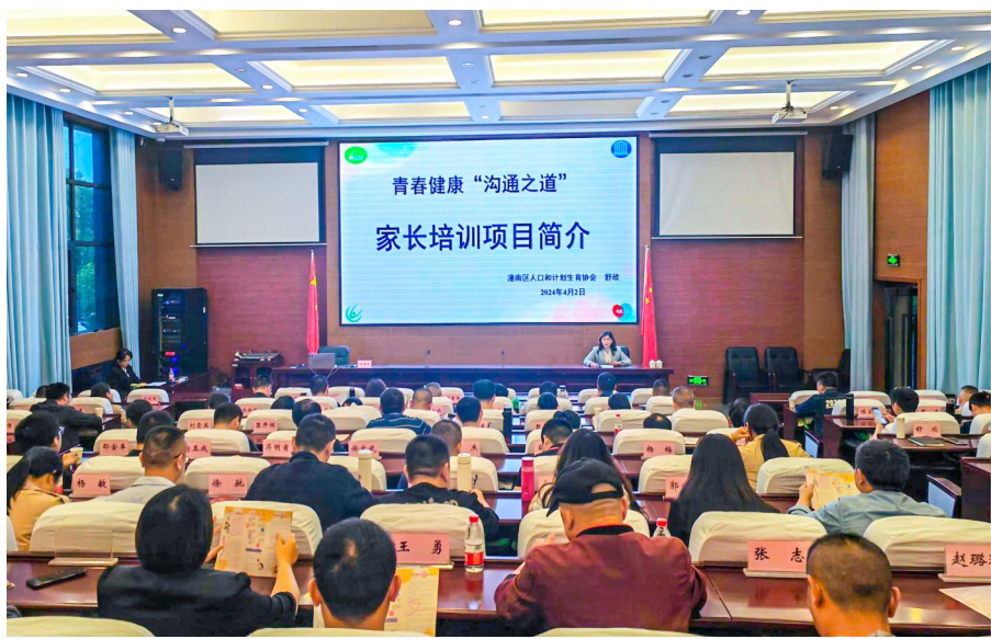
青春健康科学知识讲座现场。

本报讯(全媒体记者 徐利 通讯员 江盼)近日,由区计生协主办的青春健康“沟通之道”家长培训项目走进潼南区委党校,与我区2024年第一期党政干部主体学员交流青春健康知识,与亲子沟通技能。