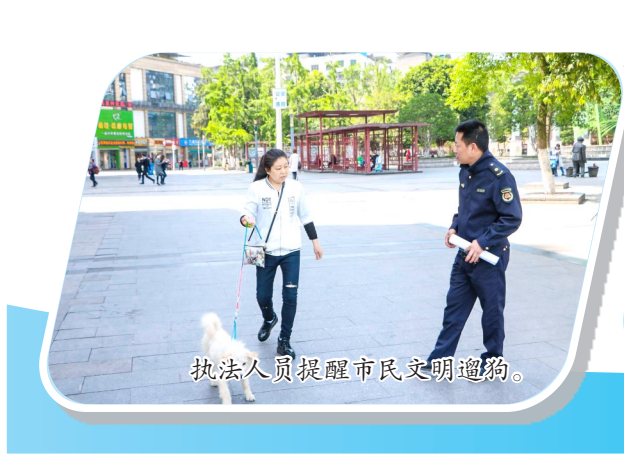
执法人员提醒市民文明遛狗。

接下来，我区将围绕“世界宽谷·田园城市”，进一步打造涪江旅游度假区内产城景相融、农文旅相生，自然人文景观交相辉映，助推涪江诗画长廊建设。