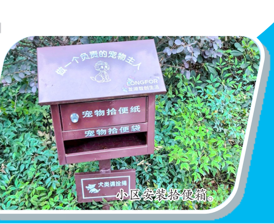
小区内安装拾便箱。