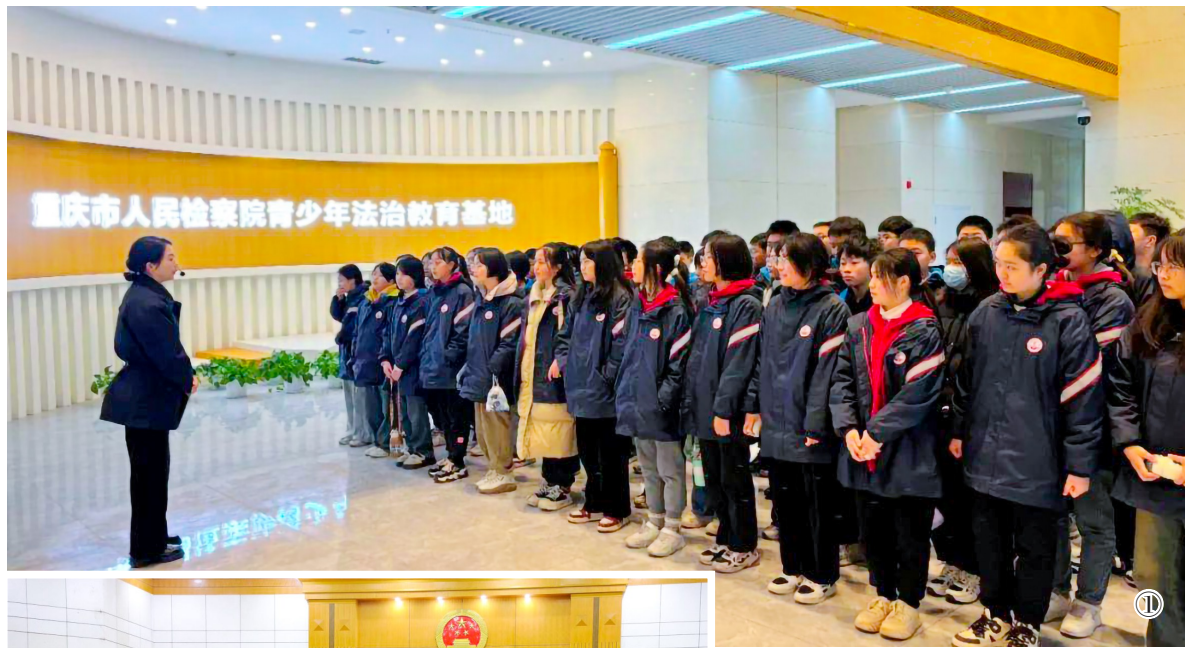
① ② ③ 法官为同学们介绍车载便民法庭。同学们旁听寻衅滋事刑事案件庭审。学生认真聆听法律案例讲解。