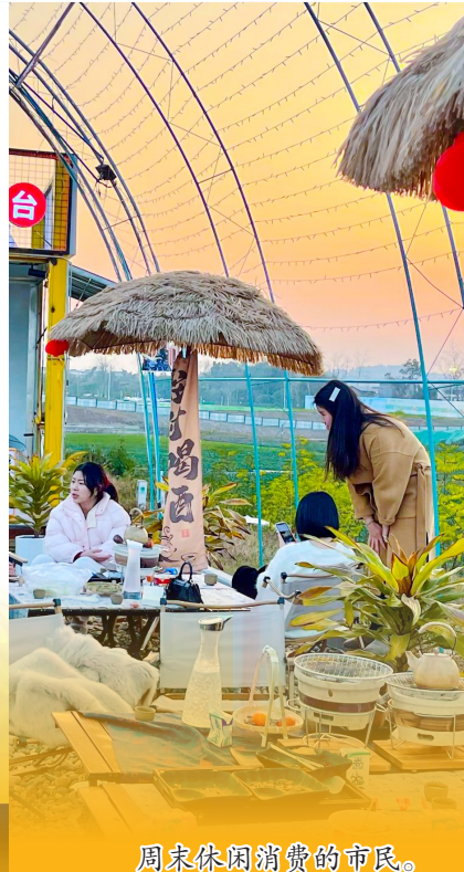
周末休闲消费的市民。