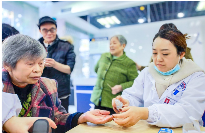
碓楼坡社区为老年人开展义诊。

本报讯（全媒体记者 陈俊霖）为进一步保护生态环境，打造整洁优美的人水和谐环境，近日，五桂镇组织全体机关干部、青年志愿者、人大代表等30余人开展新时代文明实践巡河护河志愿服务活动，对辖区内的老鸭山水库、五桂——复兴河段的周边环境进行卫生大整治。 在河道清理整治过程中，一群身着马甲的志愿者穿梭在河道两岸，携带着铁钳、环保垃圾袋等清洁工具，将岸边因不文明行为遗留的落叶、杂