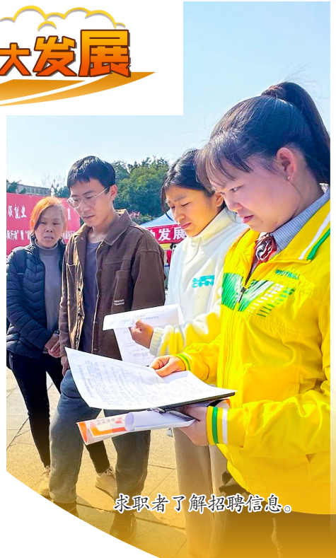
求职者了解招聘信息。