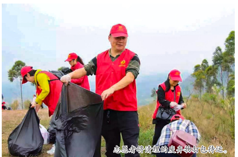
志愿者将清理的废弃物打包待运。

本报讯（全媒体记者 陈俊霖）为进一步保护生态环境，打造整洁优美的人水和谐环境，近日，五桂镇组织全体机关干部、青年志愿者、人大代表等30余人开展新时代文明实践巡河护河志愿服务活动，对辖区内的老鸭山水库、五桂——复兴河段的周边环境进行卫生大整治。 在河道清理整治过程中，一群身着马甲的志愿者穿梭在河道两岸，携带着铁钳、环保垃圾袋等清洁工具，将岸边因不文明行为遗留的落叶、杂