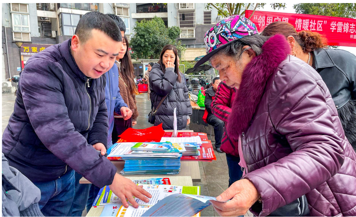
志愿者为居民宣传政策。

本报讯(全媒体记者 张峻豪 李彦亭)为大力弘扬雷锋精神,增进社区和居民的鱼水情,3月1日上午,梓潼街道组织同诚志愿者协会志愿者在纪念碑社区开展“邻里守望·情暖社区”学雷锋志愿服务活动,以丰富多样的形式为广大社区居民送去了志愿服务的关心和慰问。