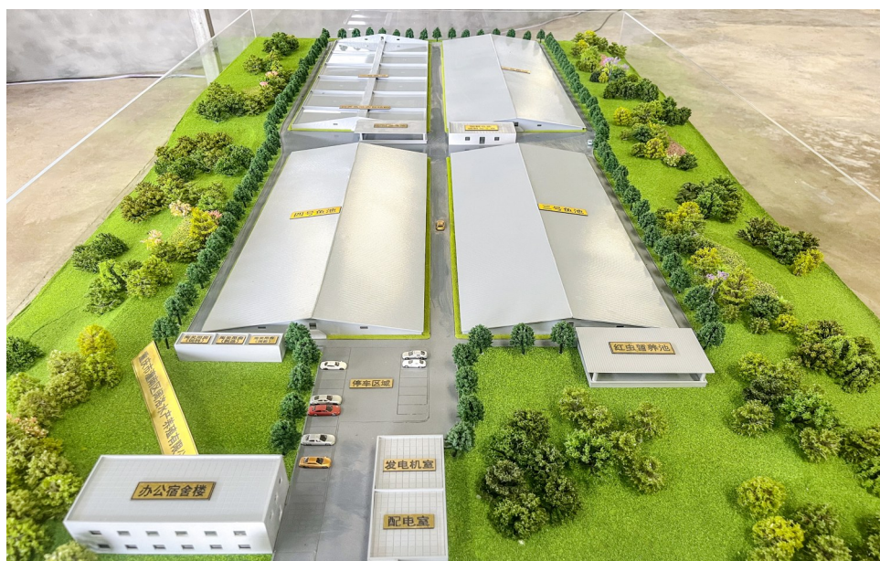
鳊鱼养殖项目效果图。

本报讯（全媒体记者 罗列 彭春 刘文静）鳊鱼因富含丰富的营养，素有“水中软黄金”“水中人参”“可以吃的化妆品”等美誉，如今在中国餐桌上已屡见不鲜。