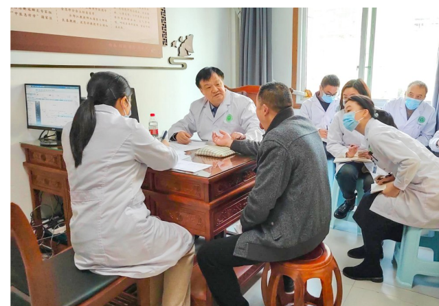
方邦江教授正在为患者号脉。

本报讯(全媒体记者丁怡然 李彦彦)近日,国家中医药领军人才“岐黄学者”、教育部“长江学者”、上海市名中医方邦江教授来到区中医院开展坐诊带教。