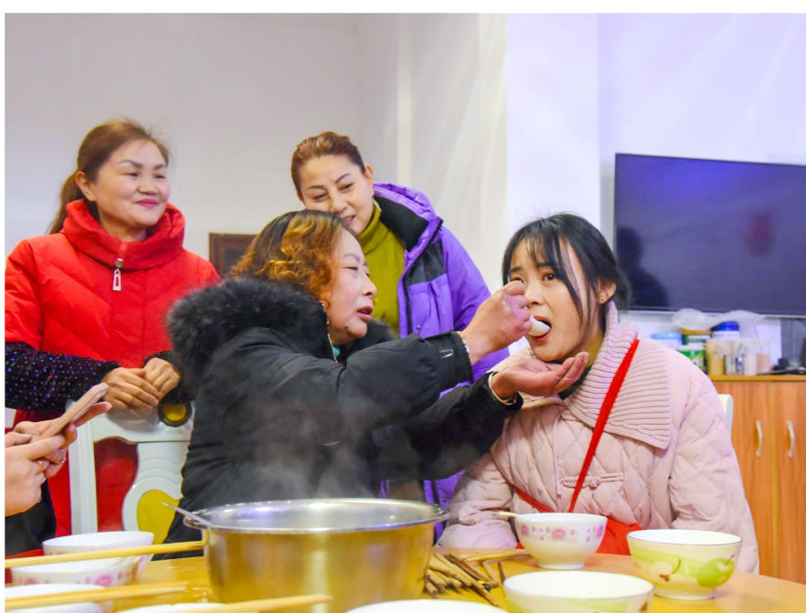
妈妈喂女儿吃下回家的第一颗汤圆。