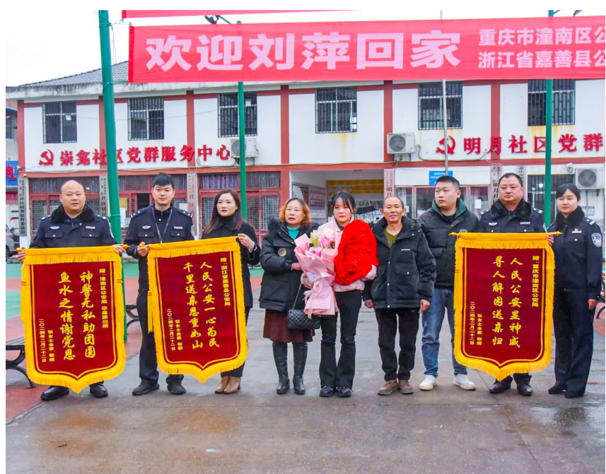
一家人向两地公安部门送上锦旗致谢。