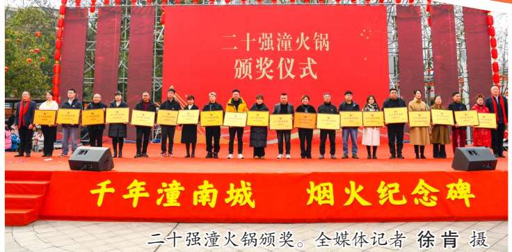
二十强潼火锅颁奖仪式。