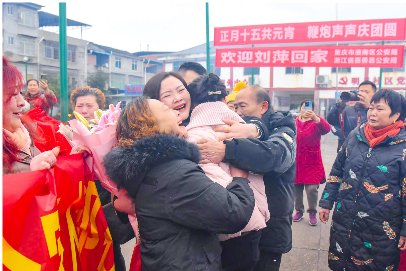
失散36年后再重聚的一家人喜极而泣。

团圆是刻在中国人骨子里的执念。2月24日，正月十五元宵节这天，对潼南区崇龛镇明月社区邓氏夫妇一家来说，注定是难忘的一天。在重庆潼南和浙江嘉善两地警方的帮助下，被拐36年的大女儿回家了，一家人时隔36年后终于团聚。