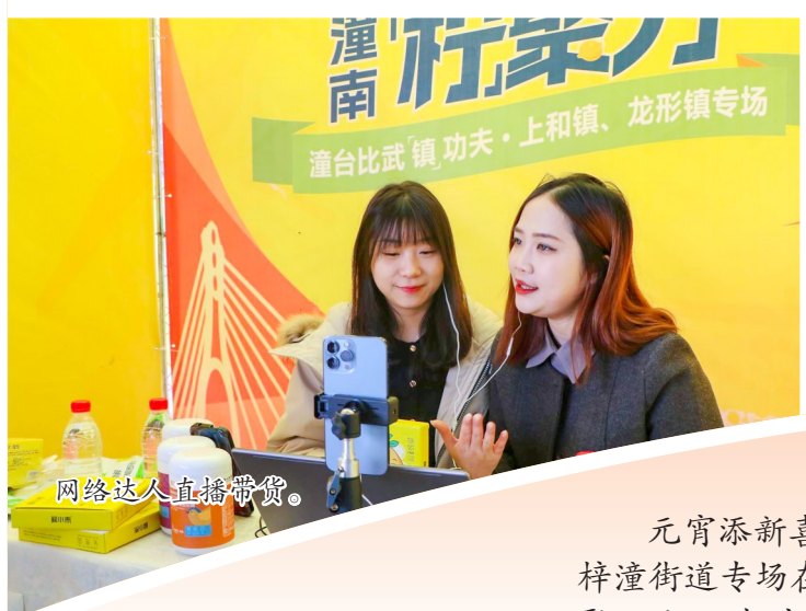
网络达人直播带货。