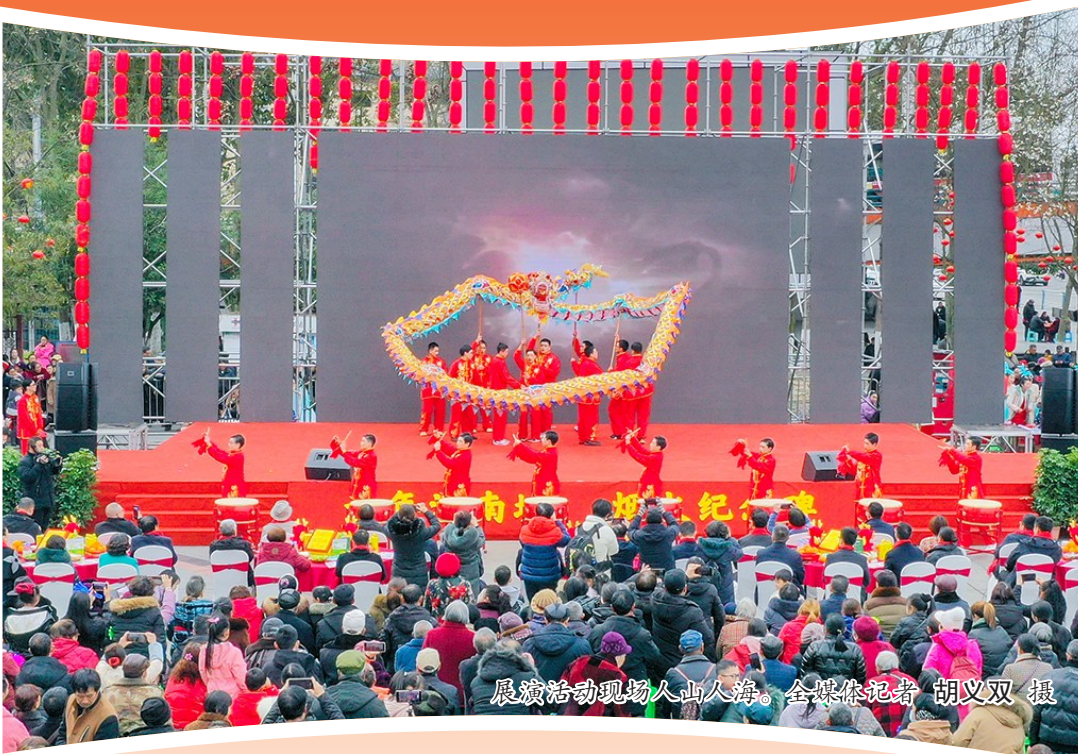
展演活动现场人山人海。