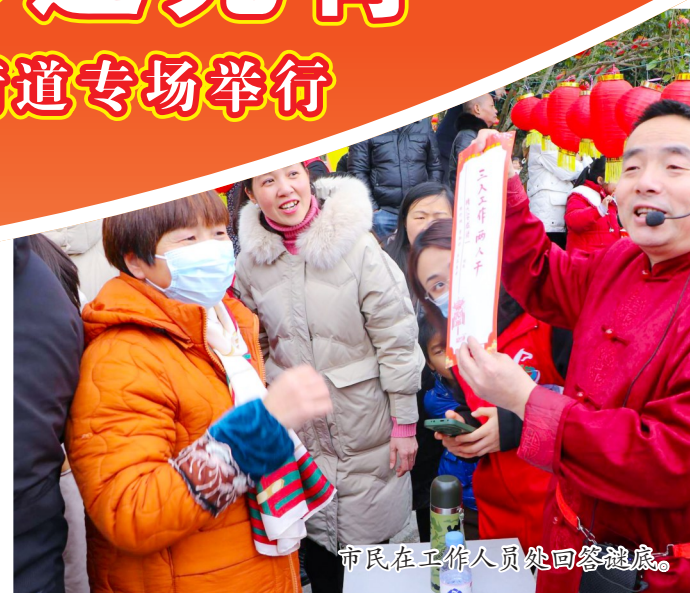
市民在工作人员处回答灯谜。