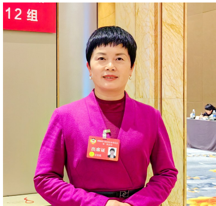
“作为推动成渝地区双城经济圈建设的重要内容和打造全国文旅发展新高地的重要举措,加快推进巴蜀文化旅游走廊建设意义重大。”

今年市两会期间,我区市人大代表、政协委员认真履职尽责,围绕全市经济社会发展大局,聚焦人民群众普遍关注的热点难点问题,积极建言献策,传递民之所呼,为全面建设社会主义现代化新重庆贡献自身智慧和力量。