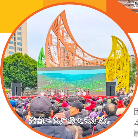
潼南三色广场文艺汇演。

据了解,此次潼南“柠”聚力·潼台比武“镇”功夫活动,不仅丰富了当地居民的文化生活,还为地方经济发展注入了新的活力。通过文艺汇演和土特产展销的结合,有效提升了地方文化的知名度和影响力,为促进地方经济发展起到了积极的推动作用。