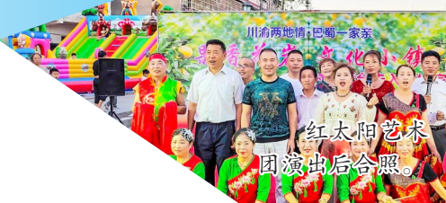
红太阳艺术团演出后合影。