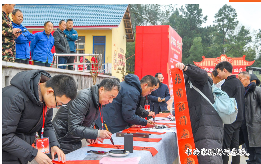
书法家现场写春联。

当天,杀猪、烧炭、支烤架……万众期待的“逐梦山乡 巴蜀年味”黑猪长席宴正式上线。黑乳猪烤得滋滋冒油,香味扑鼻,随着刨猪汤、大刀烧白、炭烤黑乳猪等特色美食一一亮相,市民游客纷纷落座长席宴,顾不上形象大快朵颐,举杯欢庆即将到来的新春。