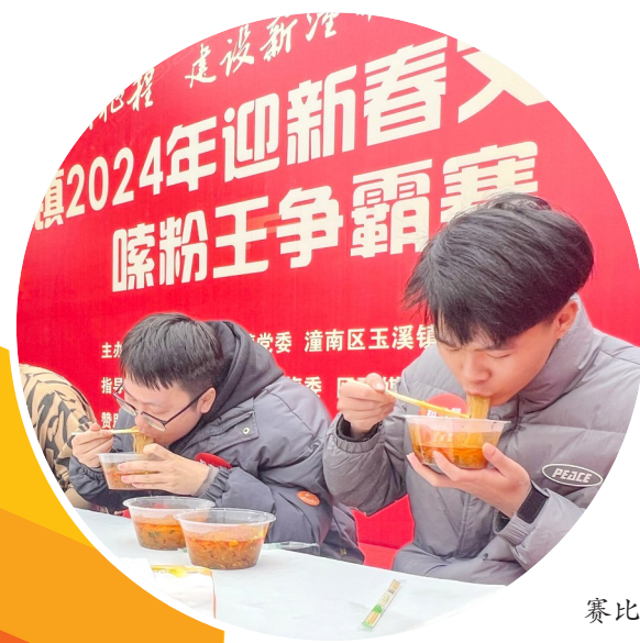
嗦粉争霸赛比赛现场。