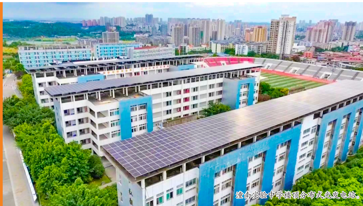
潼南实验中学楼顶分布式光伏电站。