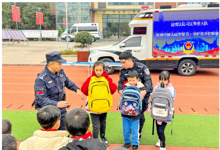
民警向学生教授自我保护技巧。

本报讯(全媒体记者 邓瑜欣 唐菘涵)近日,为庆祝第四个中国人民警察节的到来,潼南法院司法警察大队开展了形式多样、丰富多彩的庆祝