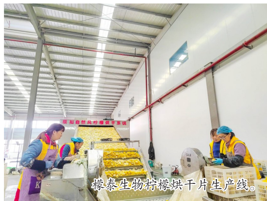
檬泰生物柠檬烘干片生产线。

会议强调,要时刻把牢政治方向,始终把坚决维护习近平总书记党中央的核心、全党的核心地位,坚决维护党中央权威和集中统一领导作为最高政治原则和根本政治规矩,做到对党绝对忠诚。要用习近平新时代中国特色社会主义思想凝心铸魂,把坚定理想信念作为党的思想建设的首要任务。(下转2版)