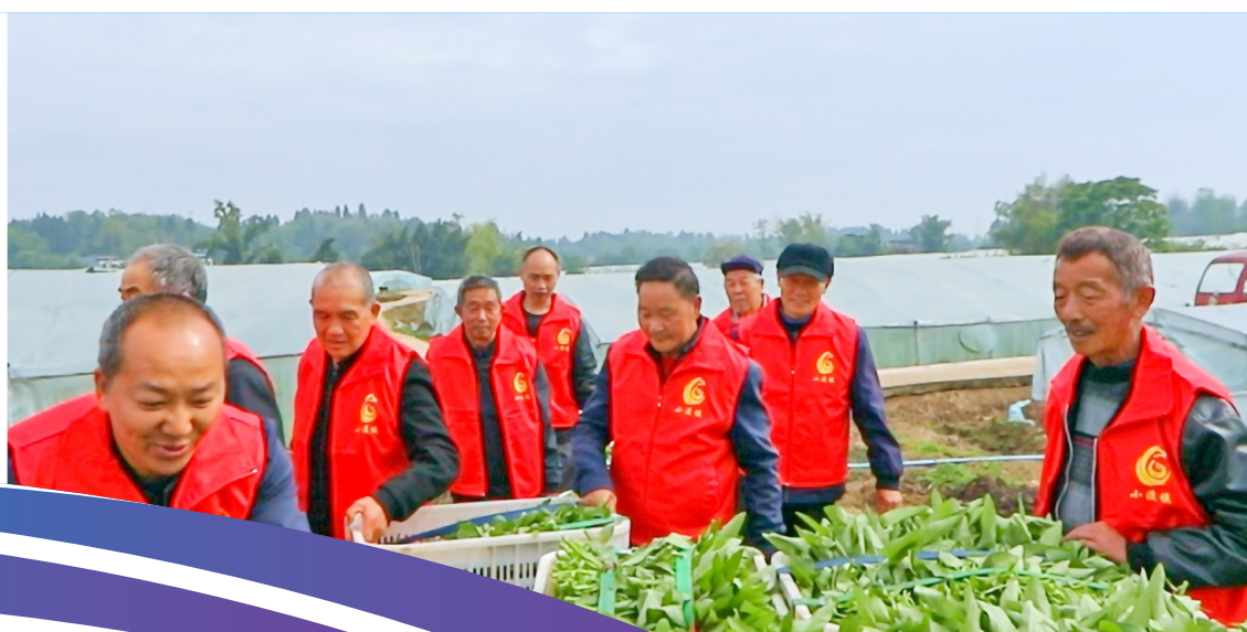
网格员帮助农户采收空心菜。