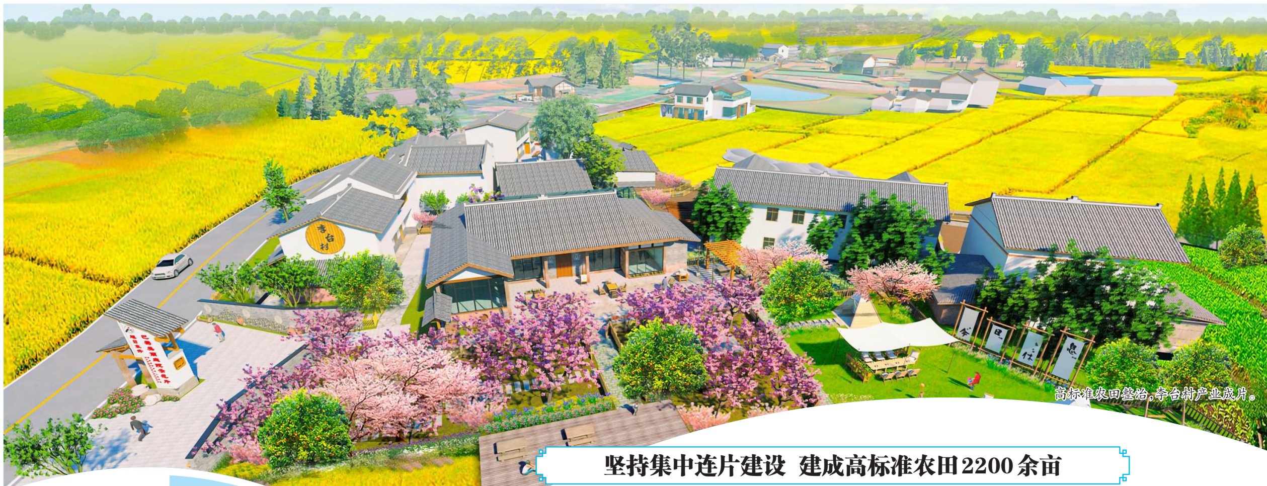
高标准农田整治,李台村产业成片。