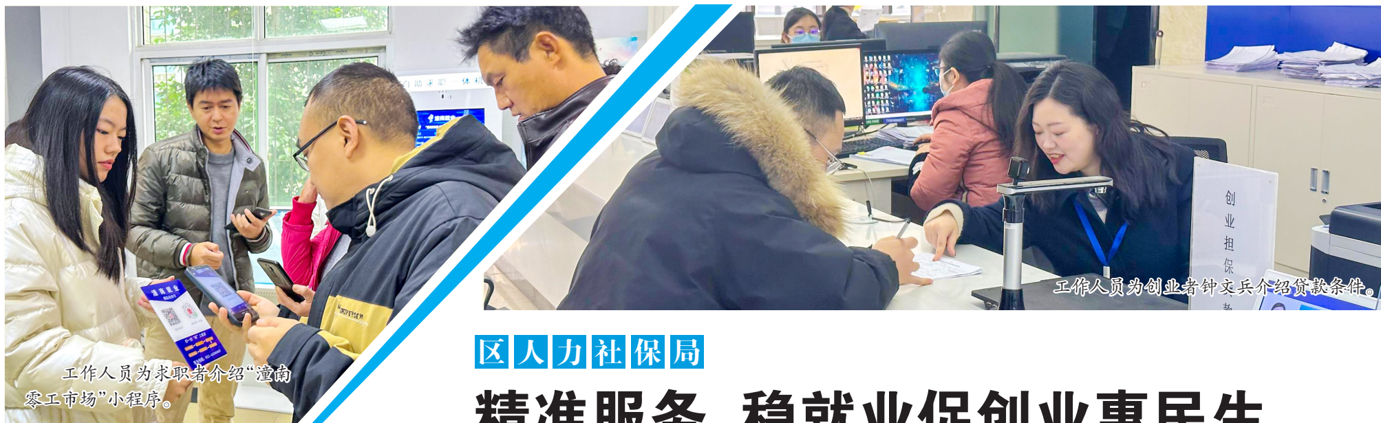
工作人员为求职者介绍“潼南零工市场”小程序。