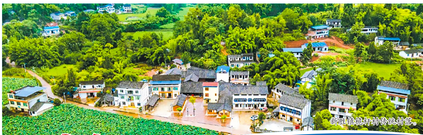
新胜镇桅杆村传统村落。