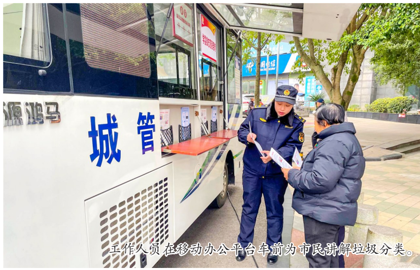
工作人员在移动办公平台车前为市民讲解垃圾分类。