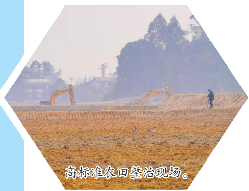
高标准农田整治现场。