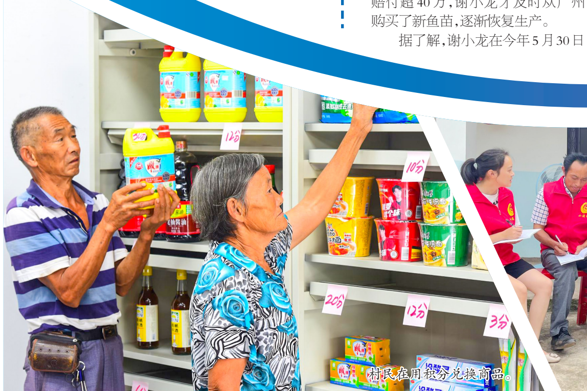
村民在用积分兑换商品。