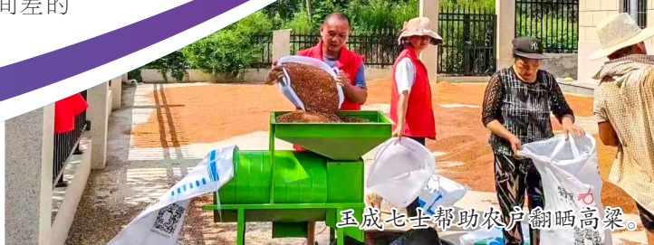
玉成七士帮助农户翻晒高粱。