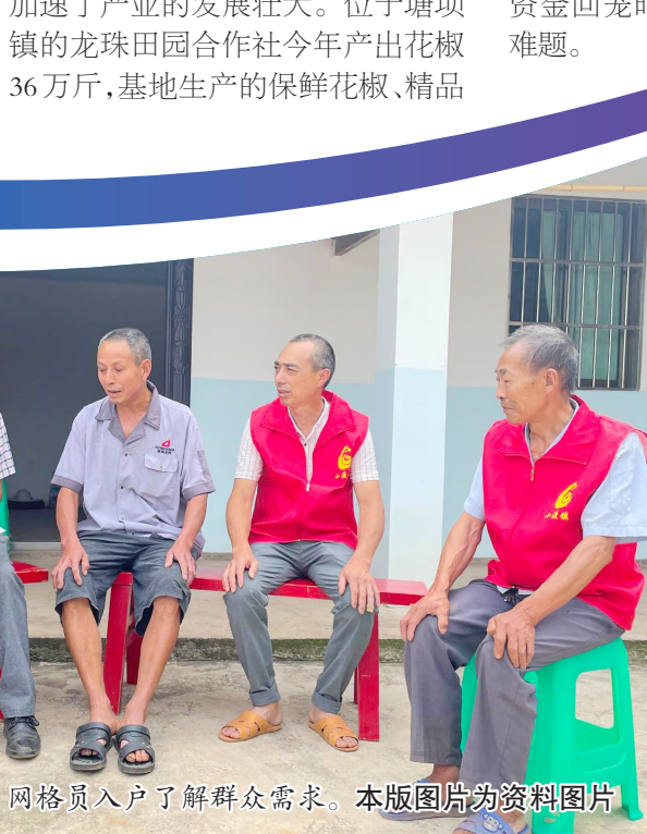
网格员入户了解群众需求。本版图片为资料图片