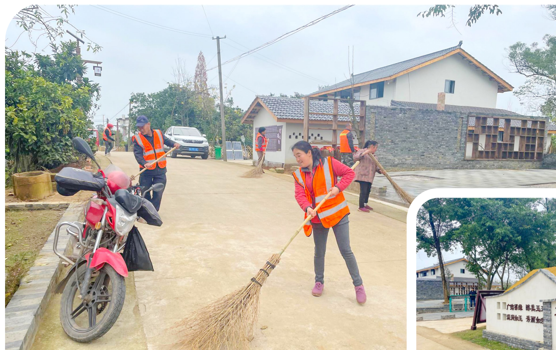
村民和环卫工人一起打扫小院卫生。