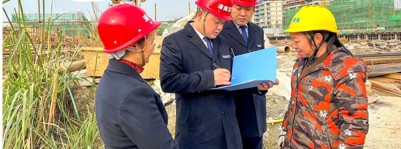
执法人员与农民工进行交流，了解是否存在欠薪情况。

本报讯(全媒体记者 邓瑜欣 唐茂涵) 临近岁末年初,欠薪问题进入易发期,多发期。连日来,区人力社保局行政执法支队持续开展“根治欠薪冬季专项行动”,深入全区各在建项目工地、企业、商超,进行专项检查和政策宣讲,有效预防农民工欠薪问