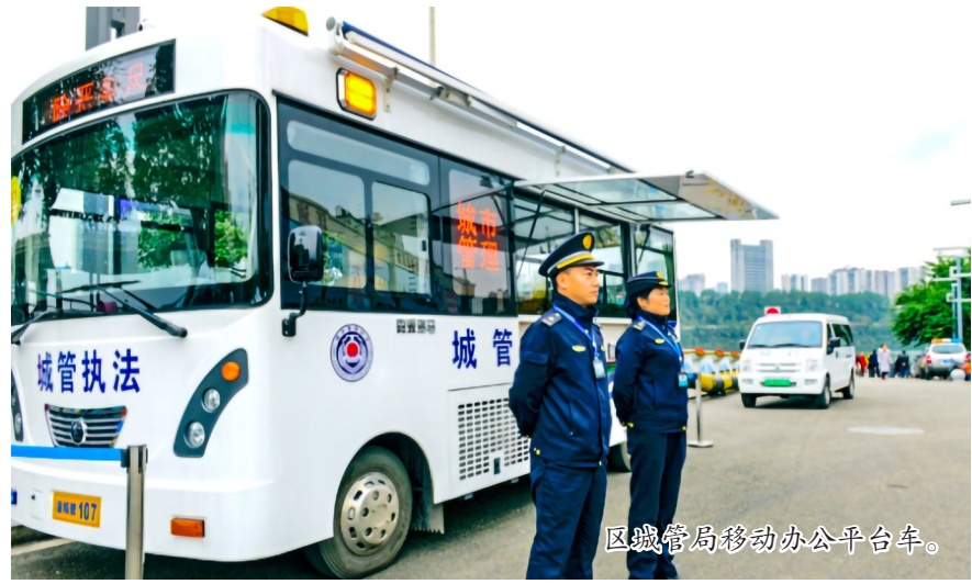
区城管局移动办公平台车。