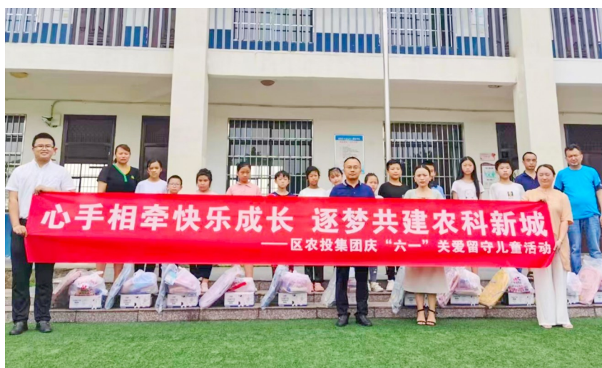
开展关爱留守儿童活动。

打破集体经济土地流转的传统模式,探索采取“薪金+租金+分红”模式,让周边村民加入到集团产业发展中来。一方面,流转周边村级组织土地共4500余亩,村民可获得每亩800元的土地租金;另一方面,将部分土地租金作为流转土地经营活动入股资金,获利后按照入股比例分红,目前为止已累计分红36万元;同时,区农投集团用活用好村级组织剩余劳动力,雇佣周边村民到生产基地从事除草、栽培、摘果等基础劳动,截至目前,共有200余名工人在基地从事劳动。