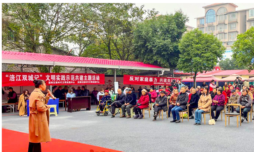
唱好双城记 共建经济圈