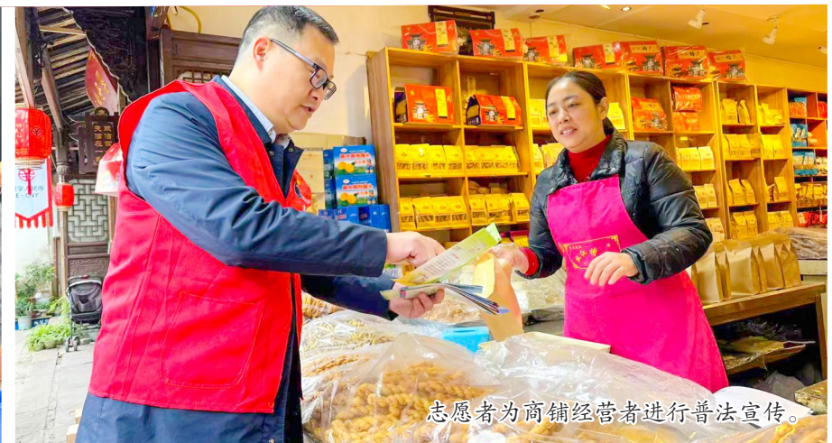
志愿者为商铺经营者进行普法宣传。