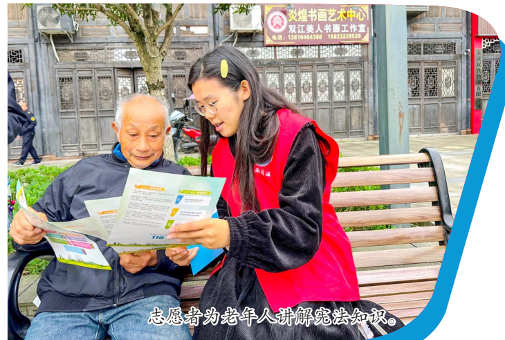
志愿者为老年人讲解宪法知识。