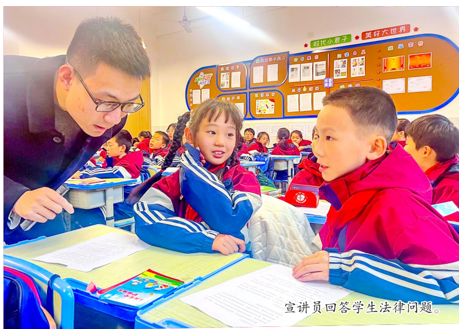
宣讲员回答学生法律问题。

连日来,我区各级各部门紧紧围绕活动主题,深入开展“宪法宣传周”宣传活动,以宪法精神凝心聚力,引导全社会坚定不移走中国特色社会主义法治道路。