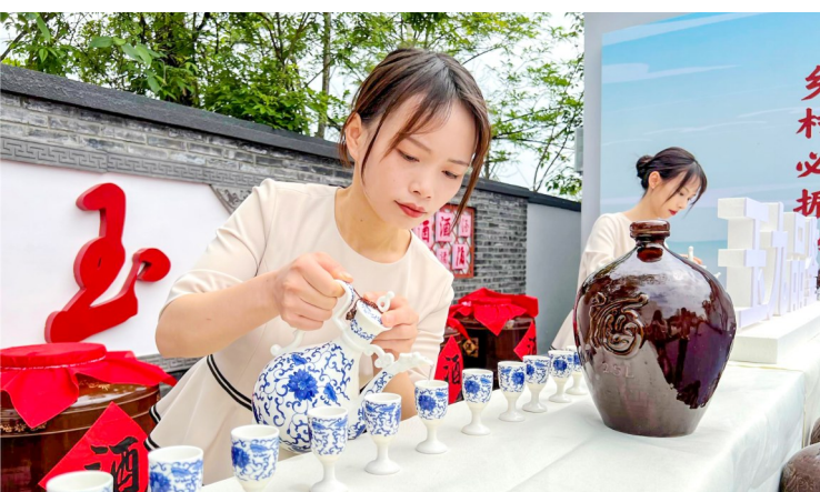
备酒等待游客体验。

推动农村一二三产业融合发展，是实施乡村振兴战略、加快推进农业农村现代化的重要举措。当前，玉溪镇五通村正抢抓机遇，以“高粱”为媒，因村制宜推进三产融合，大力发展高粱种植、白酒生产、乡村旅游于一体的新型集体经济，交出了一份强村富民的高分报表。