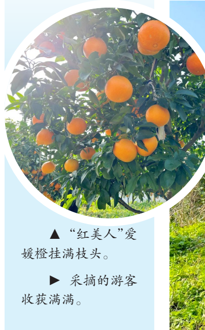
▲“红美人”爱媛橙挂满枝头。 ▶ 采摘的游客收获满满。