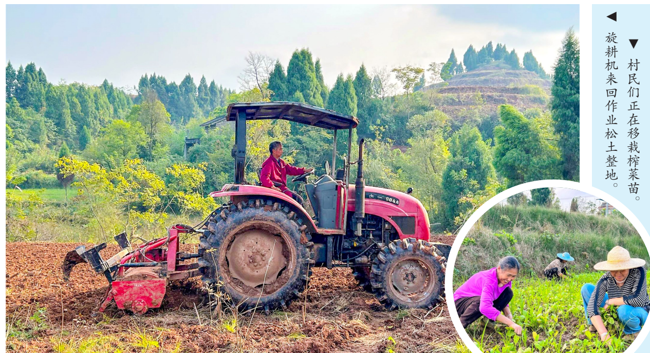
村民们正在移栽榨菜苗。旋耕机来回作业松土整地。

后难、因地制宜、平稳推进的原则,在全镇范围内开展农田使用情况摸排统计,对标对表分析、制定并实施图斑整改措施,切实保障耕地“进出平衡”工作高效有序推进,守住粮食生产命根子。目前已完成恢复补足