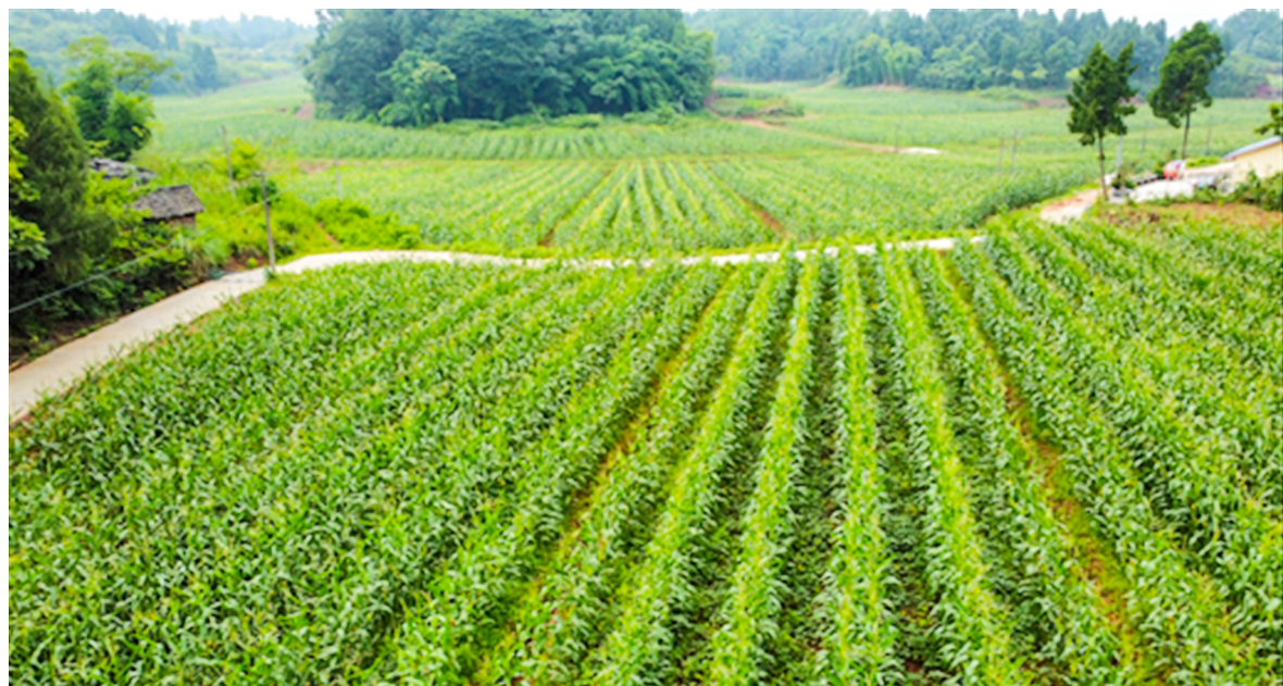
太平村集体经济大豆玉米带状复合种植基地。

本报讯(全媒体记者 郑三清)“5月插秧时,我放了一批鱼苗,那时只有5厘米左右,你看,现在长得又大又好。”太平村村民张大叔双手捧起一尾鲤鱼,兴奋地向周围人“炫耀”。这批稻田鱼迎来收获,为张大叔的荷包再添一份重量。