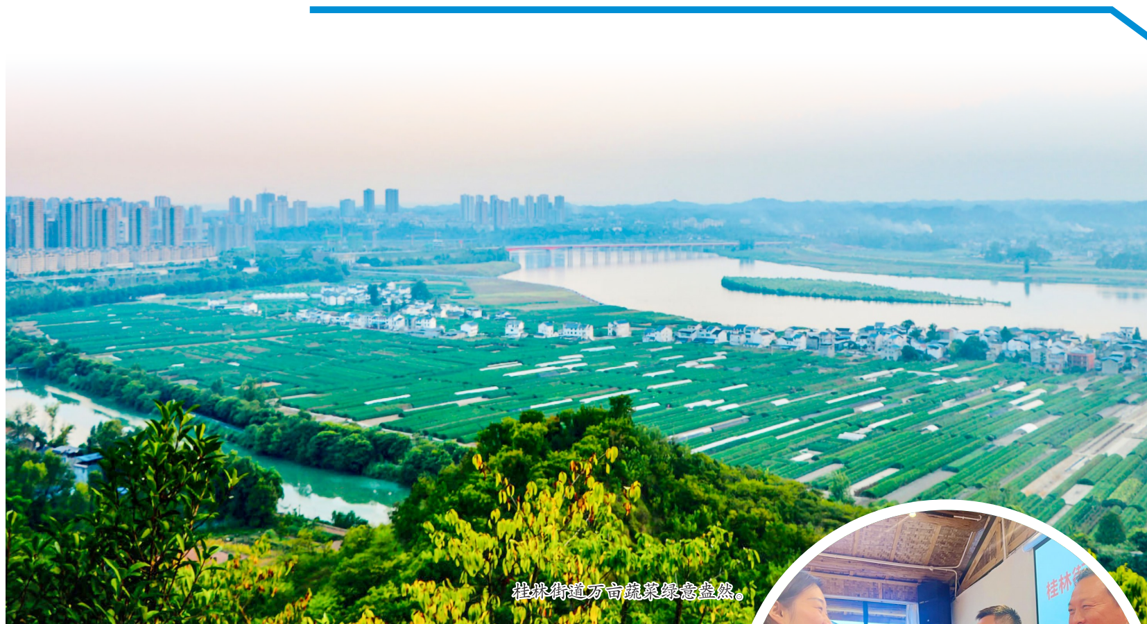
桂林街道万亩蔬菜绿意盎然。