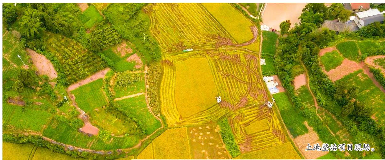
土地整治项目现场。

近年来,我区积极做强柠檬产业基础,做优产业质量,做大产业价值,着力打造全国最齐全的柠檬产业链条。目前全区柠檬种植面积32万亩、产量28万吨,居全市第一,“潼南柠檬”获评国家地理标志商标,被纳入国家生态原产地产品保护名录,认定为全国名特优新农产品。下一步,将聚焦中国柠檬第一品牌目标,坚持“大产业、大加工、大科技、大品牌”思路,加快潼南柠檬产业链链强链,把潼南柠檬打造成为中国第一柠檬种苗繁育高地、第一柠檬核心产区、第一柠檬产品研发基地、第一柠檬出口基地、第一柠檬数字大脑、第一柠檬融合发展标杆,形成“中国柠檬看潼南”的发展格局。