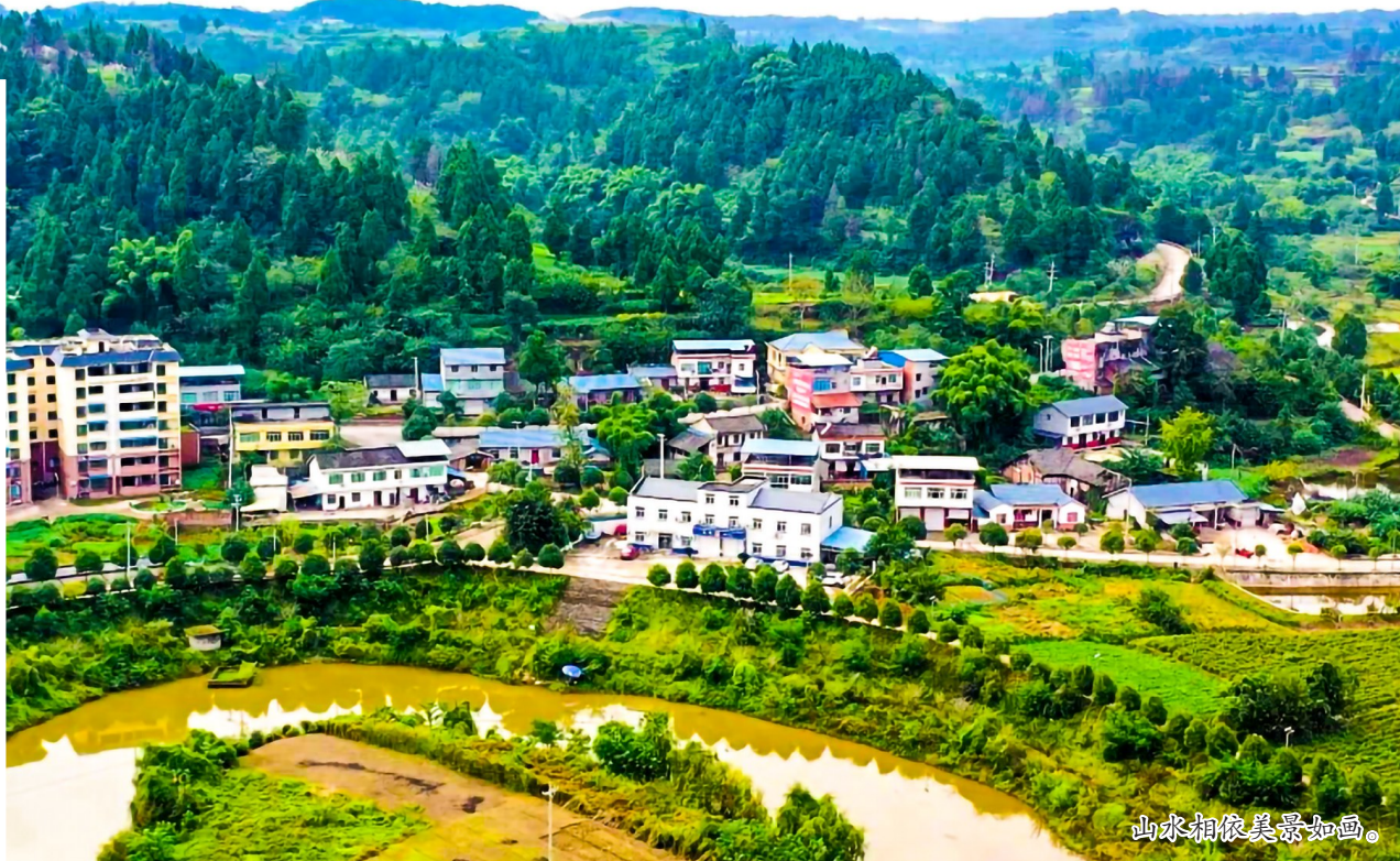
山水相依美景如画。

今年以来，别口镇坚持以习近平新时代中国特色社会主义思想为指导，紧紧围绕区委、区政府明确的“1356总体部署”，强化党建统领“三项重点任务”，聚焦聚力“五拼五比五赛”，在新赛道上争做“急先锋”、练就“铁肩膀”、敢啃“硬骨头”，为建设“滨江魅力小城镇、效益农业示范镇、休闲旅游慢城镇、长寿宜居幸福镇”奠定了坚实的基础。