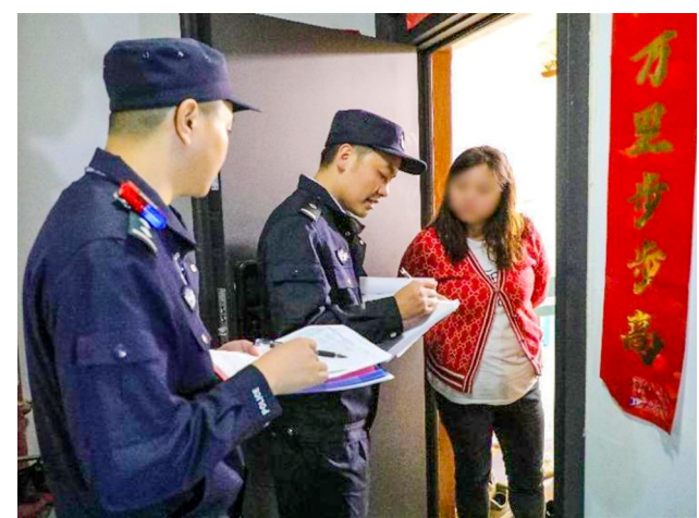
民警入户采集并核对居住人员相关信息。