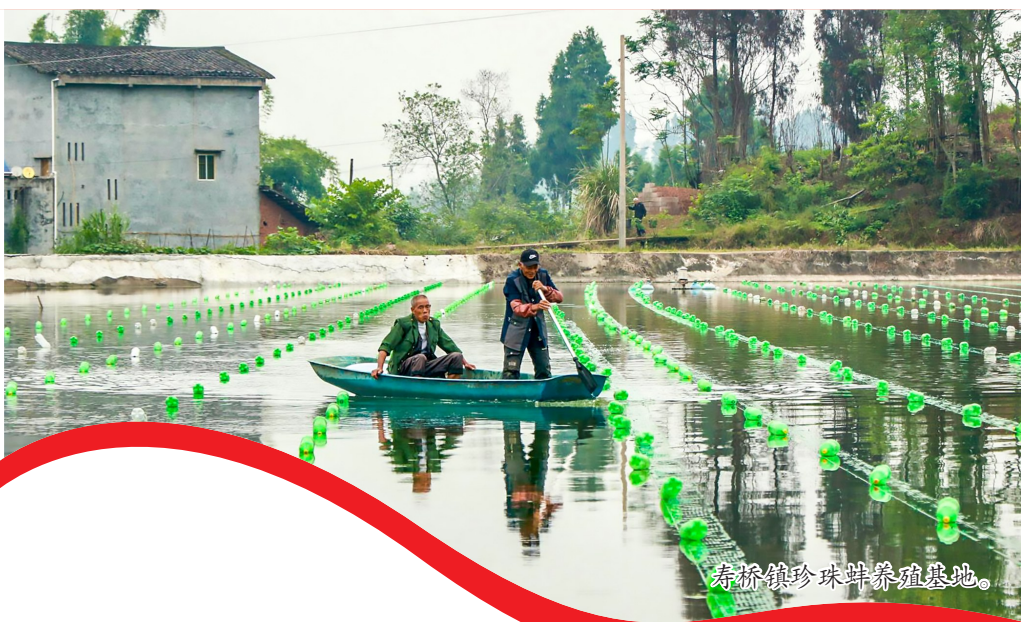
寿桥镇珍珠蚌养殖基地。