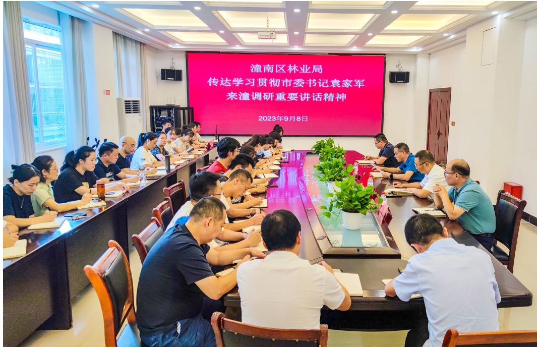
▶ 区林业局召开专题会议组织学习调研指示精神。