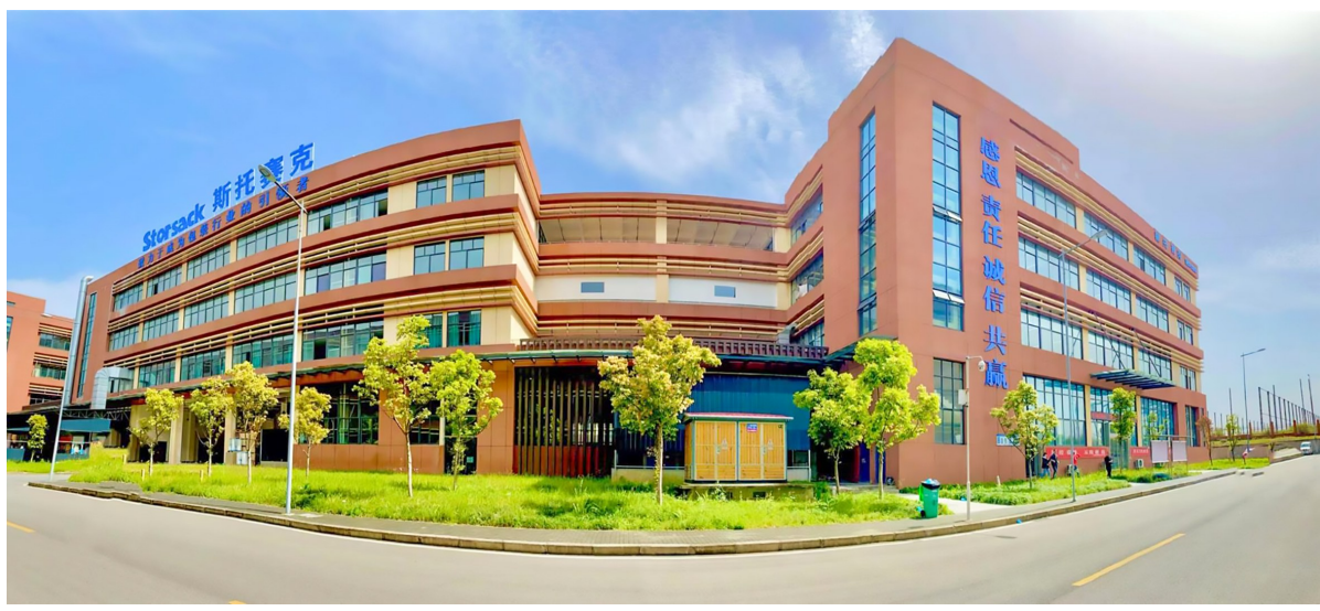
斯托赛克厂区一角。

扬帆起航，这是争分夺秒的活力潼南；乘势而上，这是昂扬行进的奋发潼南。在高质量发展的赛道上，位于潼南高新区的重庆斯托赛克新材料有限公司，在大家都将注意力放在常见的吨袋集装袋时，他们却细分赛道，发展包装行业领域中的铝塑膜集装袋生产，积极融入成渝地区双城经济圈建设中，入局“行业蓝海”。