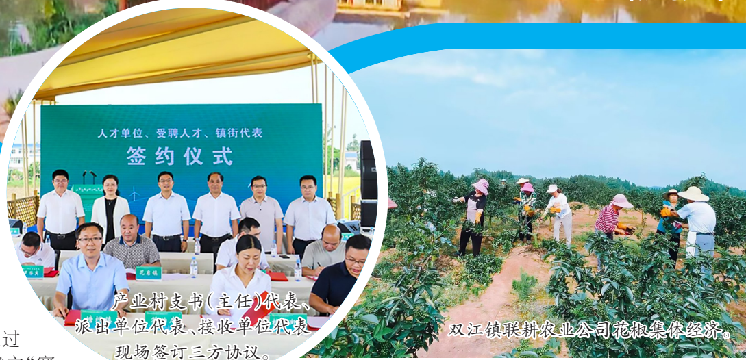
产业村支书（主任）代表、派出单位代表、接收单位代表现场签订三方协议。

同时，通过赛马比优，建立“赛马比拼·潼台比武”考评体系，聚焦镇街、村（社区）、驻村“三级书记”，开展集体经济大比武活动，设置村均收益、经营性收益10万元以上占比、农村产权流转交易额等5条赛道，每季度亮晒成效，每半年现场观摩，每年评选集体经济示范村，排查整顿薄弱村，赛马结果与“一把手”例会、单位个人目标考核、抓党建述职评议“三挂钩”，推动比学赶超、争先创优。