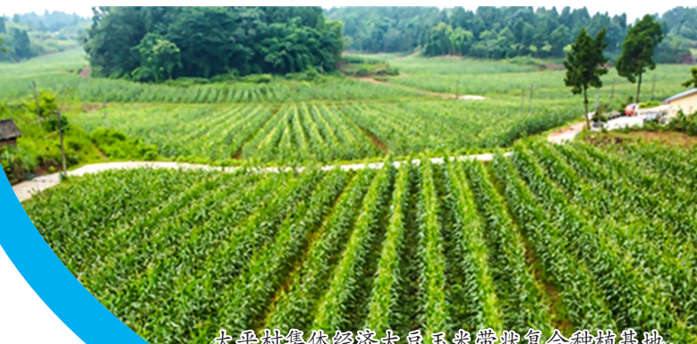
太平镇集体经济大豆玉米带状复合种植基地。

“我们坚持支部带头、群众自愿、风险共担，推动30个集体经济示范村成立村办企业，布局20个农产品初加工基地，构建订单种植、产品回购、加工销售全流程闭环、辐射带动周边连片发展。”据区委组织部相关负责人介绍。