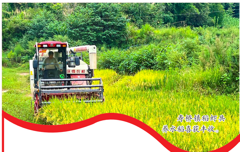
寿桥镇稻虾共 养水稻喜获丰收。