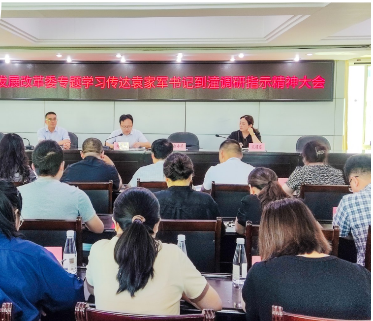
▶ 区发展改革委专题学习传达调研指示精神。