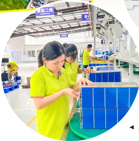
◀ 工人对“状态良好”的电池进行重组。