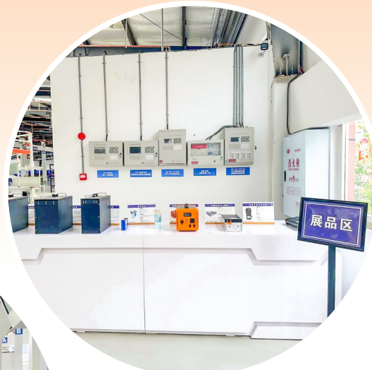
▲ 梯次动力电池展示区。