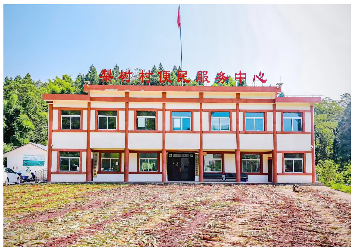
眼下正是稻谷、高粱、玉米等农作物抢收、抢晒的关键时期，连日来，我区各地农户趁着晴好天气抓紧收割晾晒，到处一派丰收的繁忙景象。图为桂林街道梨树村便民服务中心院坝晒满了高粱，助力粮食归仓。