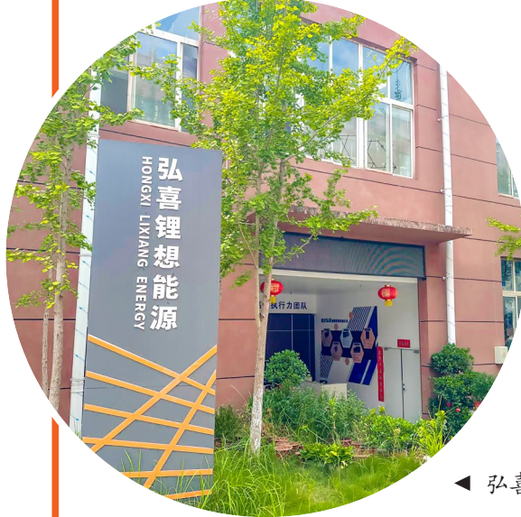
◀ 弘喜汽车新能源“退役”电池研究厂。