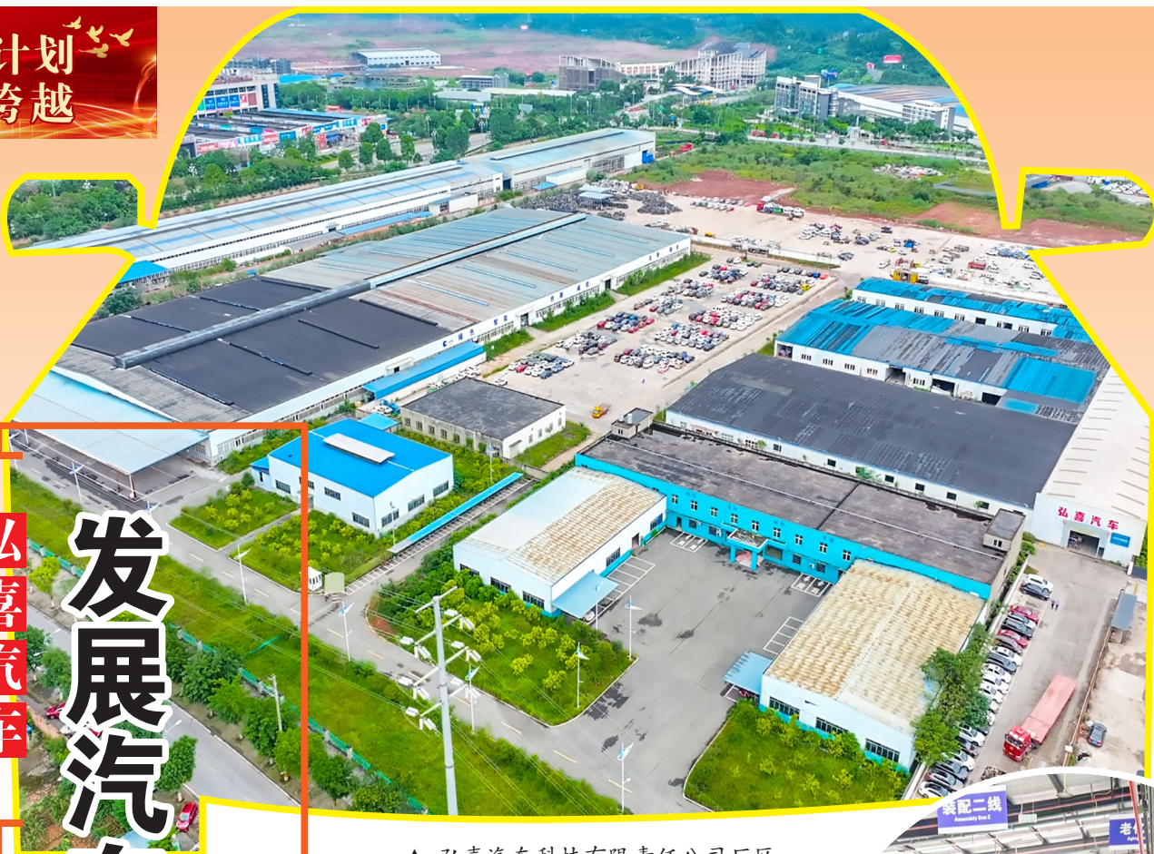
▲ 弘喜汽车科技有限责任公司厂区。