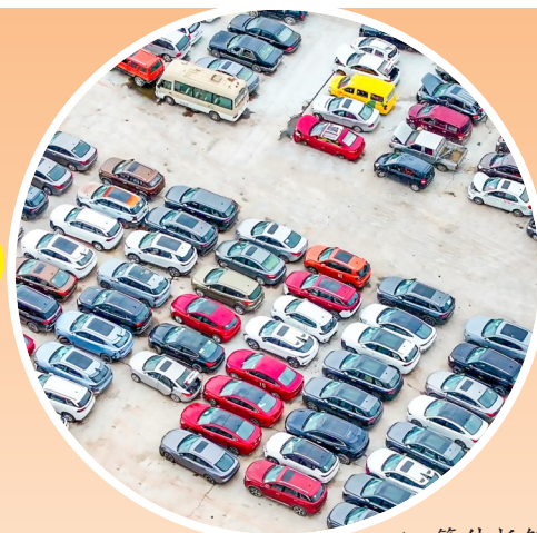
▲ 等待拆解的废旧汽车。