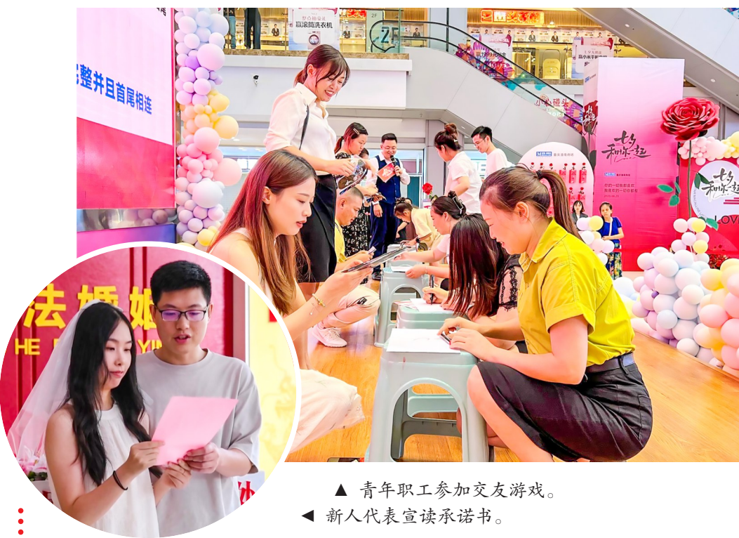
▲ 青年职工参加交友游戏。 ◀ 新人代表宣读承诺书。