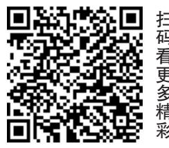
扫码看更多精彩内容

狠抓作风勇担当。持续巩固整治部分党员、干部不作为慢作为乱作为工作成果，发扬“马上就办”的精神，紧盯群众关心事、区域重点事，以奋进者姿态推动各项工作争先创优。