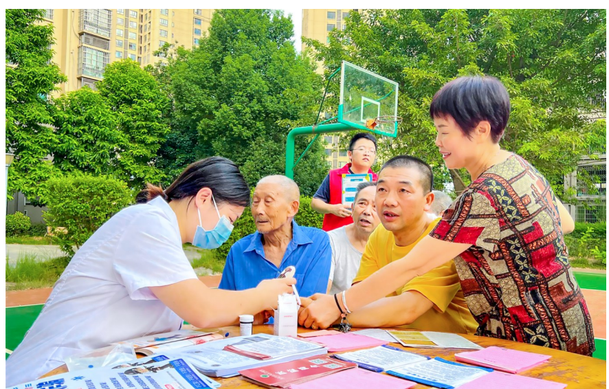
医务人员免费为小区居民检查身体。