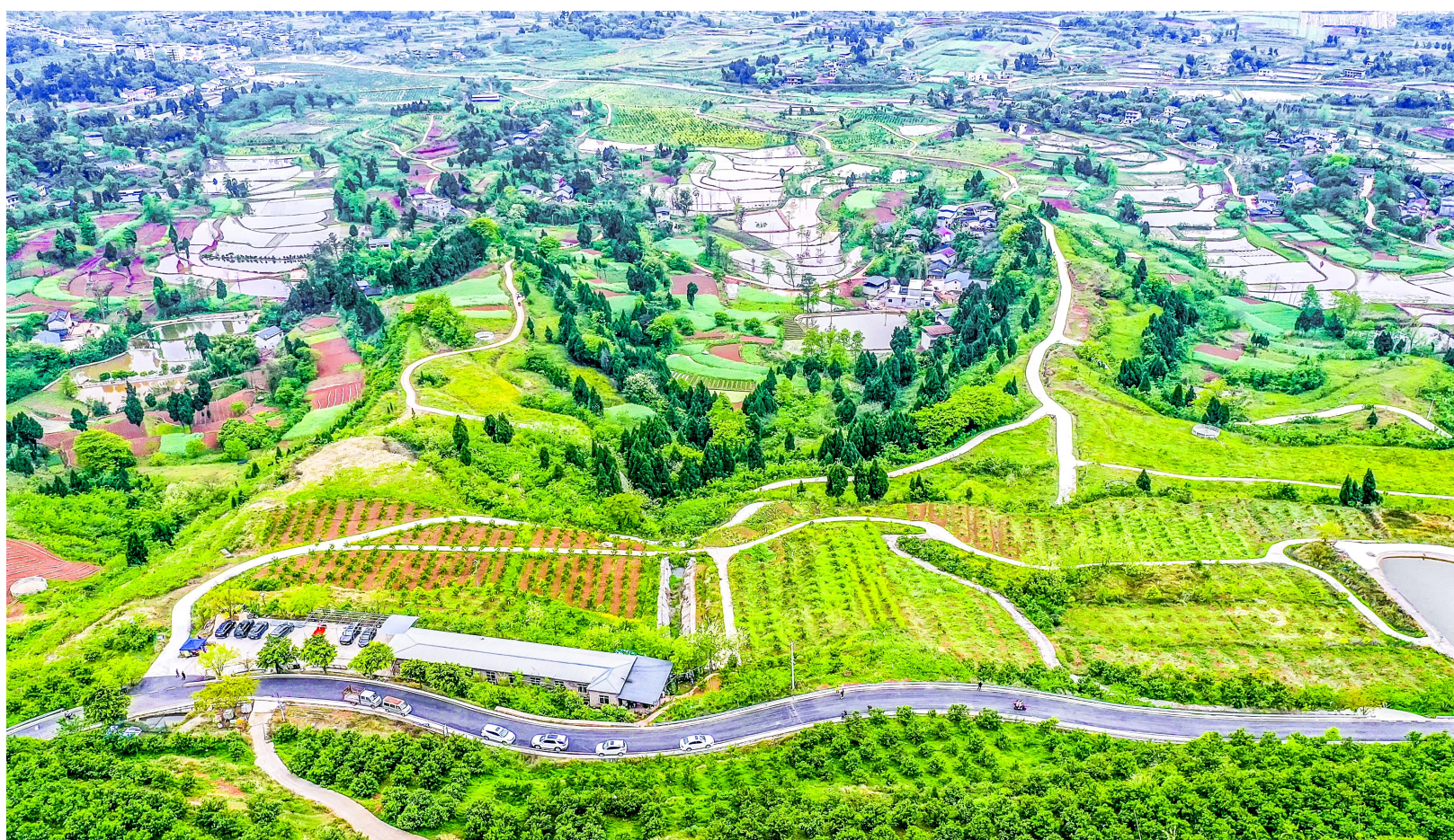
4月的龙多山,绿意盎然,公路在山间蜿蜒,景色怡人。近年来,我区大力推进美丽乡村和