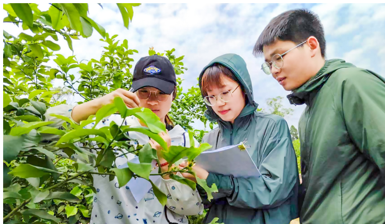
详细记录调研数据。

目前，柠檬科技小院阶段性成效显著，该团队围绕植物保护、农业昆虫与害虫防治领域开展田间试验，申请受理“一种柑桔全爪螨田间快速精准选药的方法”“基于图像的柑桔全爪螨智能监测系统及方法”两项专利，成功开发出应用型快速精准选药试剂盒产品“螨抑”。